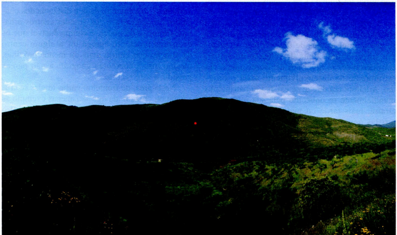
Redor do Porco, Figueira de Castelo Rodrigo, Parque Natural do Douro Internacional — núcleo de arte paleolítica de ar livre, com uma única gravura, do mesmo estilo e mesma cronologia das mais antigas gravuras do Parque Arqueológico do Vale do Côa classificadas como património mundial.

algum debate entre organismos da Administração Pública e a definição de alguns tratados de Tordesilhas : a fixação de fronteiras administrativas e de atuação face ao Parque e Museu do Côa. Mas não se trata de ocioso despique ou de um qualquer bélico deleite administrativo. Se olharmos com algum distanciamento o processo recente, podemos perceber que tem havido, desde o primeiro momento, dois movimentos paralelos que atravessam o Côa atual: por um lado, a necessidade de se afirmar enquanto Côa, um território que a generalidade das comunidades hodiernas não concebe enquanto tal e que renasceu do Riba-Côa por força da arte rupestre paleolítica. Menos ainda se revêem nas terras do Côa as populações dos confins setentrionais do Vale do Côa da Associação de Desenvolvimento, que se inicia na nascente deste rio e termina em Mogadouro, muitos quilómetros a norte da foz. Trata-se, pois, de criar um território de referência, empresa para a qual muitos parceiros terão de direcionar esforços num