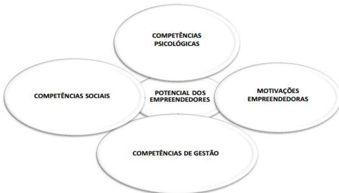
Figura 1 - Modelo Concetual sobre o Potencial dos Empreendedores