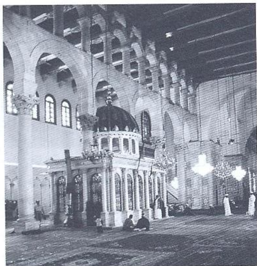
Interior da Mesquita Omeia de Damasco. Neste mausoléu, e segundo uma antiga e persistente tradição, estará a cabeça de S. João Baptista.

Olhando mais perto para o Mediterrâneo, seguimos as correntes migratórias e pendulares do Próximo Oriente sempre em demanda