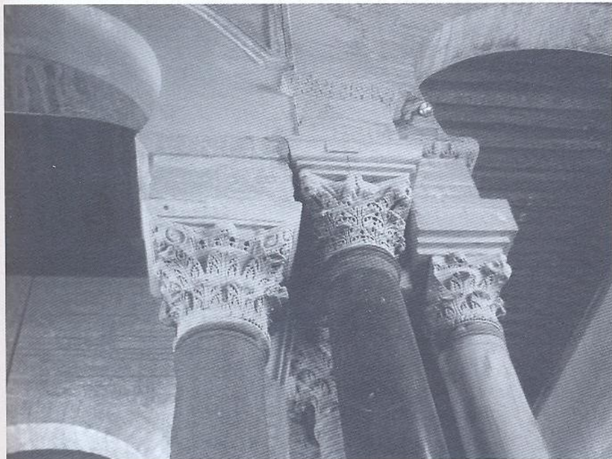
Interior da Grande Mesquita de Kairouan.

Entramos agora num plano mais concreto, decorrente de uma experiência com mais de vinte anos a investigar o passado de Mértola. De facto, esta pequena povoação foi um importante porto fluvial a 70 km do Oceano onde, antes dos bojudos galeões quinhentistas, atracava todo o tipo de barcos mercantes ou de guerra. Foi um municipium romano e uma importante cidade no período conturbado que se seguiu ao desmoronamento do Império. Datado da segunda metade do século VI, encontramos e continuamos a investigar um importante palácio episcopal implantado sobre uma plataforma artificial que dominava a cidade. Este conjunto baptismal de grande luxo decorativo, foi edificado num período de transição quando os reis visigóticos de Toledo se preparavam para abandonar o cristianismo ariano e