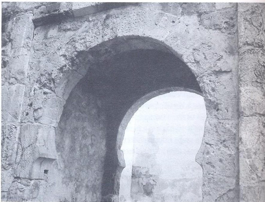
Porta da antiga muralha islâmica de Coimbra.

Muito antes do Islão que, mais tarde, vai oficializar esta ruptura, no seio do mundo cristão oriental as diferenças de sistema económico são potenciadas por divergências religiosas. Como é sabido, o Império Bizantino tentou de várias formas, incluindo a força armada, impor a sua ordem às cidades de Alexandria, Antioquia e Damasco, que entretanto se tinham reorganizado na igreja Monofisita. Aliás não é por acaso que tenha sido nesta zona do Mediterrâneo a surgir e a afirmar-se à nova religião muçulmana, ela também intransigentemente monoteísta e hostil à dominação imperial bizantina. Ao contrário do que ainda hoje é afirmado sobre as influências do deserto na sua génese, o Islão forma-se como uma espécie de cisma do cristianismo e judaísmo, bebendo das mesmas fontes bíblicas e difundindo-se rapidamente nas comunidades urbanas de mercadores e artesãos, onde tinha garantida a sua base de apoio. Muitas vezes para justificar a fulgurante expan-