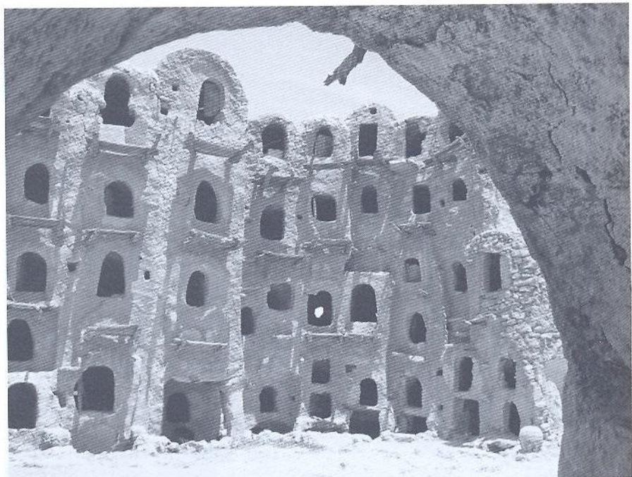
Celeiro comunitário (agadir) na fronteira do deserto líbio.