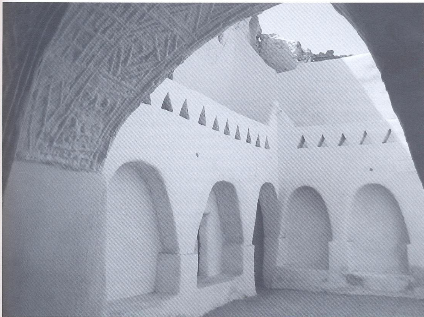
Pátio interior na cidade líbia de Ghadamés, antigo entreposto comercial entre o Mediterrâneo e a África Negra.

Almorávida e Almóada, e era certamente a forma de viver das comunidades de judeus, cristãos e muçulmanos. A história do Mediterrâneo é afinal a história fantástica de saber olhar, de saber ver o «outro», de respeitar o diferente. É a história de uma cultura milenar onde é vital o equilíbrio hábil de tensões e de saberes. É essa inteligência e sabedoria que nos dias conturbados que vivemos, esperamos sejam entendidas e respeitadas pelos senhores do Império Americano que nos governam.