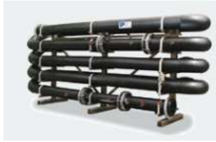
Figura 5 - Flocculador tubular do tipo plug-flow (Lenntech, 2017).

O flocculador tubular é alimentado através de dois grupos electrobomba de parafuso excêntrico, com regulação de velocidade, a partir do tanque de equalização/homogeneização de efluentes concentrados. São adicionados três produtos químicos, dependendo da situação. O primeiro será um neutralizante: Soda caustica (aumento de pH) ou ácido clorídrico (baixa de pH) em caso de o valor de pH não se encontrar dentro da gama de neutralização espectável. O segundo será um coagulante, PAX (nome comercial) e um flocculante, polielectrólito.