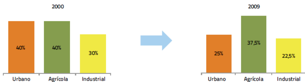
Figura 1 - Ineficiência nacional do uso da água por sector (relativas às perdas no armazenamento, transporte e distribuição) (PNUEA, 2012).

A aplicação de medidas de redução nos vários sectores de actividade, proporcionou a melhoria da eficiência do uso da água entre 2002 e 2010. A ineficiência associada às perdas no sistema de adução e distribuição, a mais facilmente contabilizada, foi mais significativa no sector urbano, conforme indicado na Figura 1 (PNEUA, 2012).