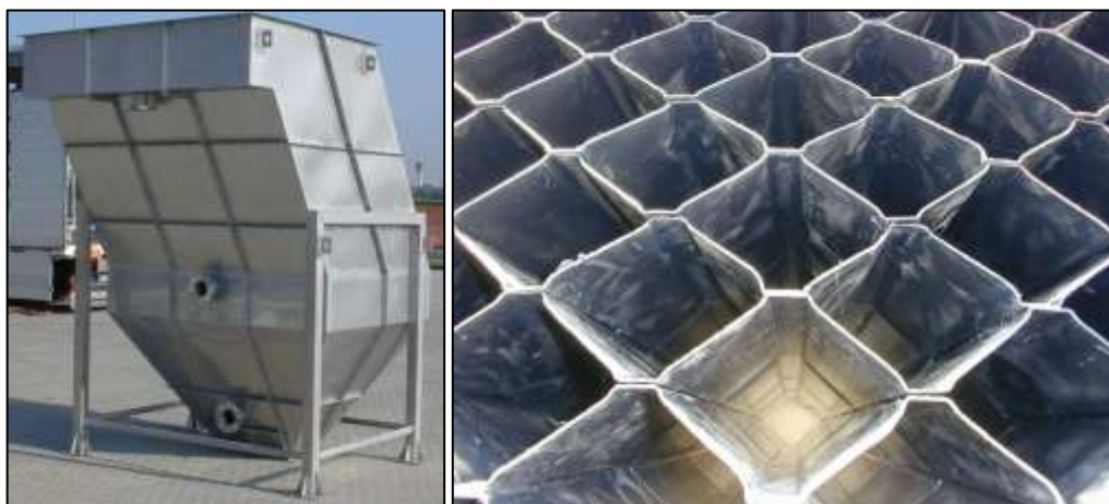
Figura 7 - Decantador lamelar (esquerda) e lamelas do decantador (direita).

Os efluentes mistos, depois de tratados nos dois estágios do reactor biológico, afluirão ao decantador secundário lamelar, para que ocorra a separação entre as fases líquida (efluentes mistos tratados) e sólida (lamas em suspensão resultantes do desprendimento do biofilme). O decantador lamelar a instalar será um equipamento pré-fabricado, executado em aço inox, apoiado. A figura 7 ilustra o equipamento a considerar para esta etapa.