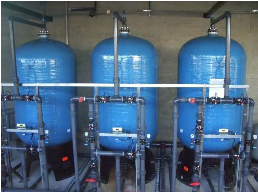
Figura 8- Filtros multimédia.

Assim, serão instalados dois grupos de bombas distintos, 1(+1) bomba de alimentação dos filtros e 1(+1) bombas de lavagem dos filtros de Multimédia (figura 8). Os filtros funcionam automaticamente, controlado por microprocessadores integrados que comunicam com o sistema de supervisão.