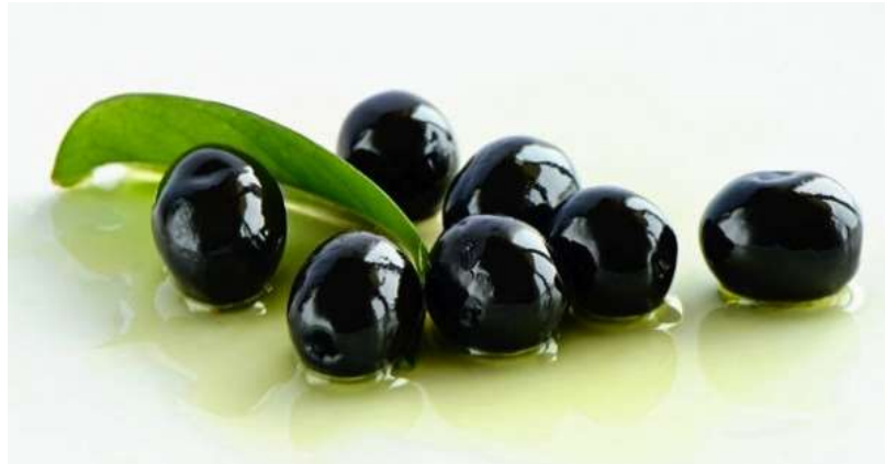
Figura 3 - Azeitona galega oxidada (Mendes, 2017).

Em meados dos anos 60 inicia um processo de oxidação natural da azeitona. Esta é colhida em verde e oxidada, tomando a cor negra conforme verificado na Figura 3.