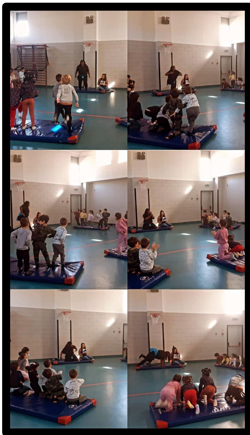
Imagem 3 – Atividade 3: “Do corpo às emoções”