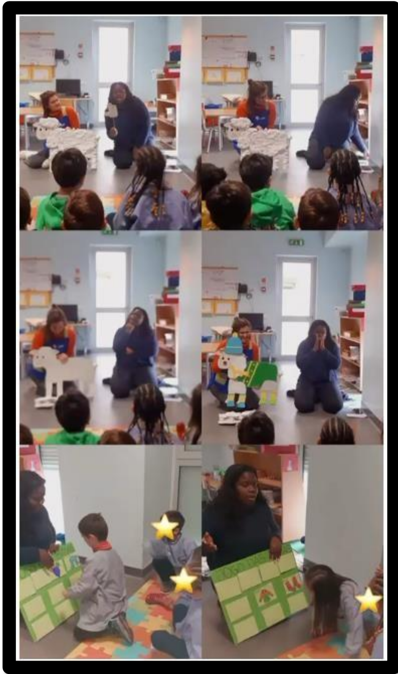
Imagem 1: Atividade 1: "Ovelhinha dá-me lã"