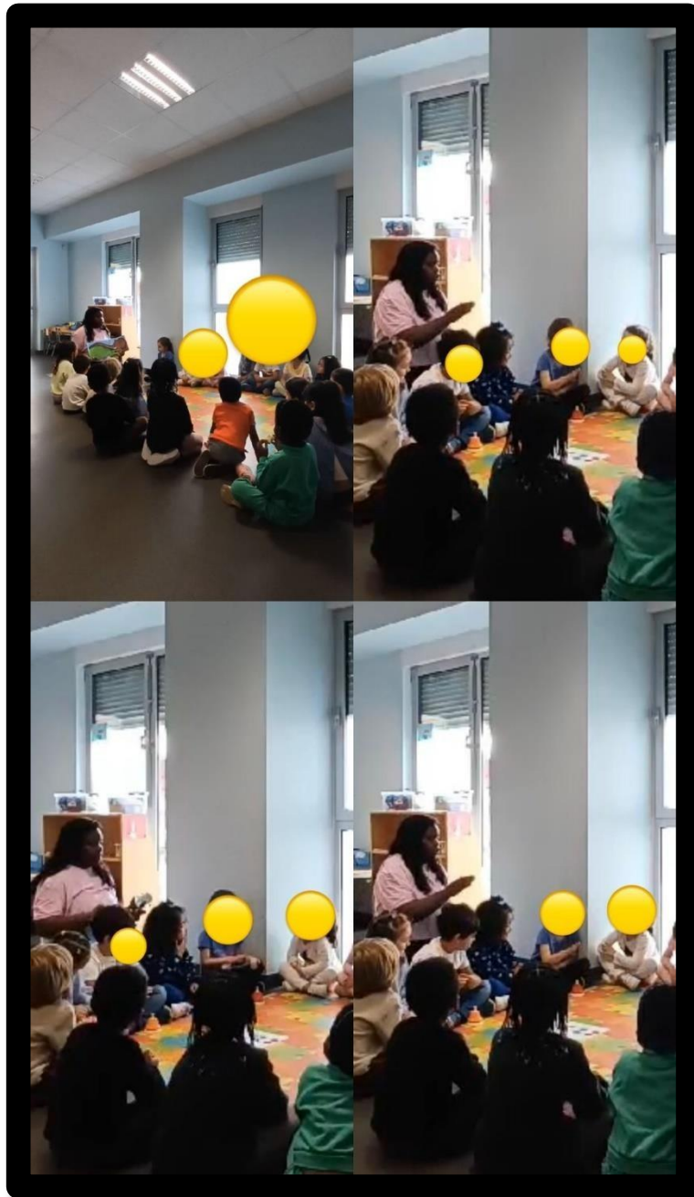
Imagem 4 – Atividade 4: “Toma atenção e guarde este segredo”