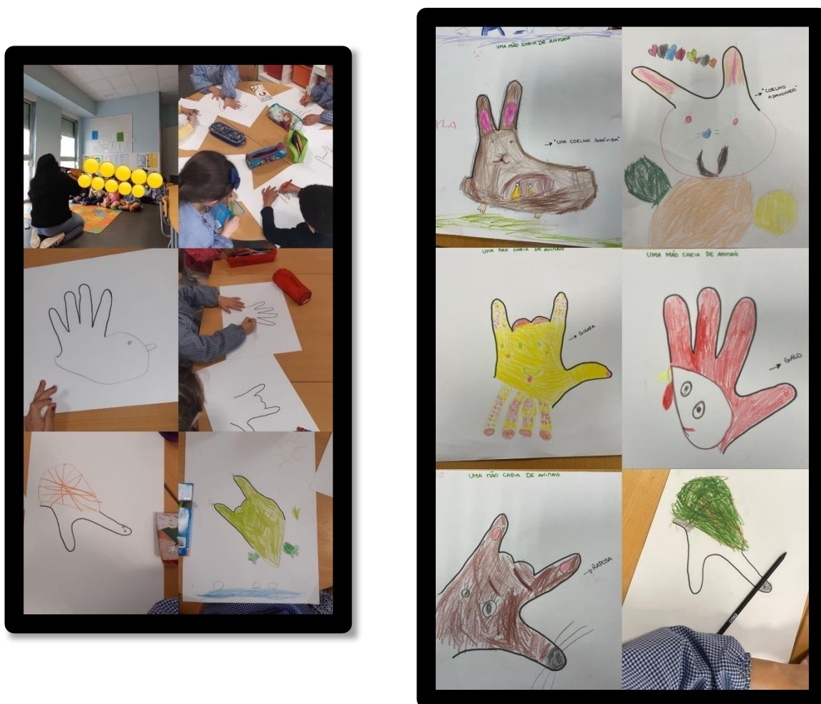
Imagem 2 – Atividade 2: “Uma mão cheia de animais”