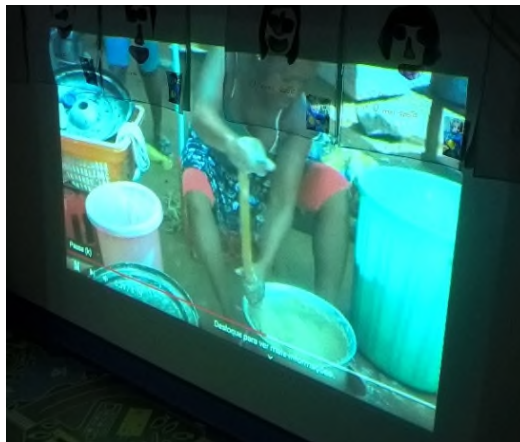
Figura n.º 6

Vídeo relativo a confeção de um prato típico de Angola