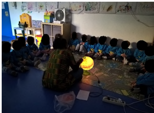
Figura n.º 3