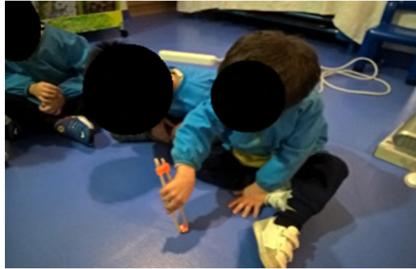
Figura n.º 8

Exploração do elemento da cultura chinesa