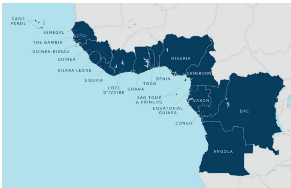
Figura 1 – Região do Golfo da Guiné.

A sua linha costeira estende-se por 6.000 km do Senegal a Angola e inclui os arquipélagos de Cabo Verde e São Tomé e Príncipe, como apresentado na figura 1. O domínio marítimo da região é composto por uma grande riqueza de minerais, depósitos de hidrocarbonetos, e espécies variadas de recursos marinhos e pesqueiros. A bacia marítima reveste-se, ainda, de elevada importância geopolítica e geoeconómica para o transporte de mercadorias entre a região e o resto do mundo (Okafor-Yarwood & Pigeon, 2020).