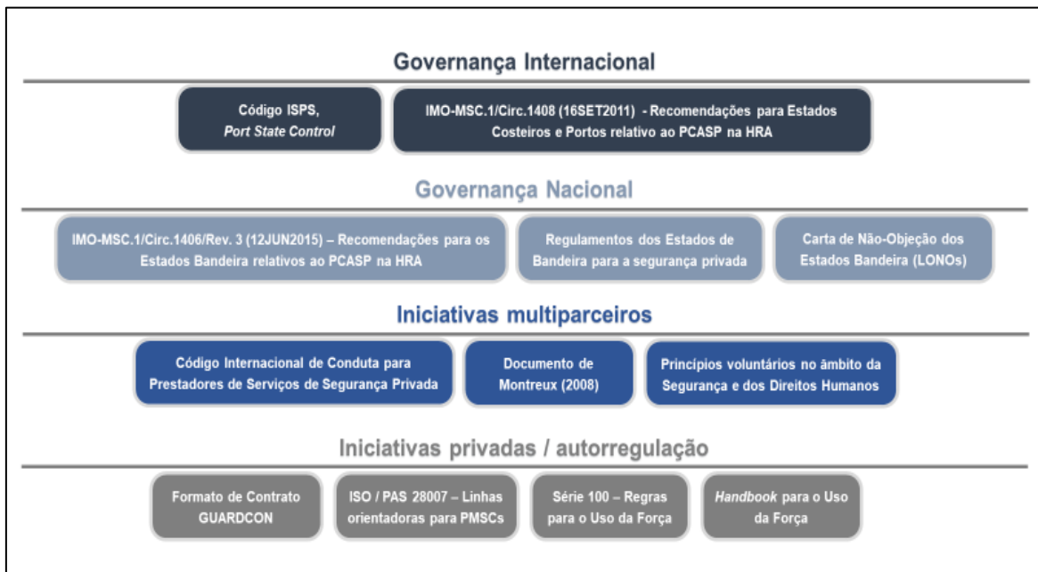
Figura 4 – Normativo para regulação da atividade de segurança marítima privada.