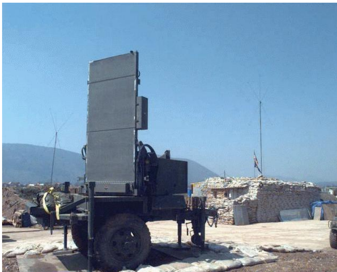
Figura 8: Radar AN/TPQ 36