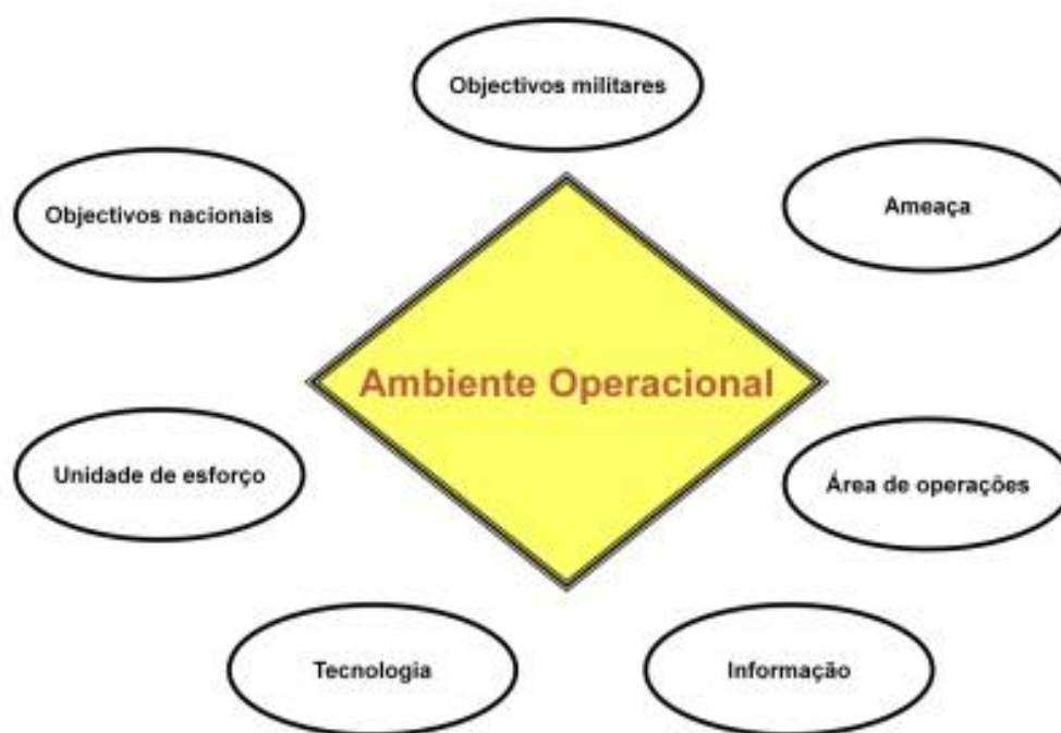
Figura 1: Ambiente Operacional