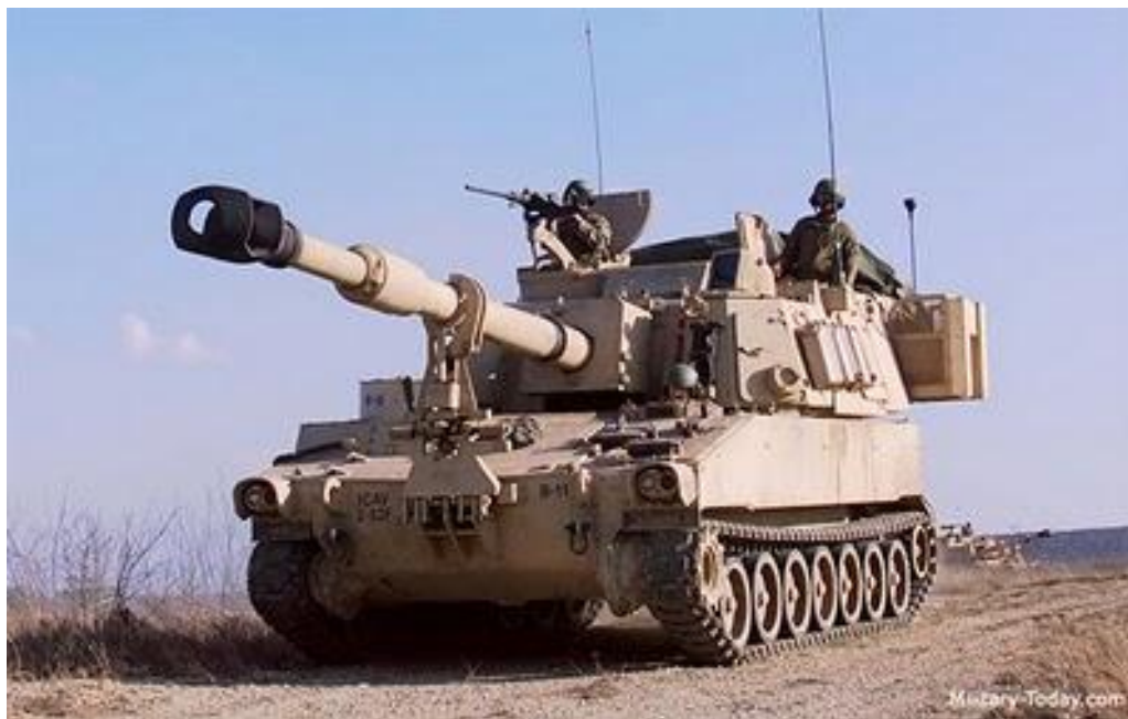
Figura 6: Obus M109 A6 Paladin