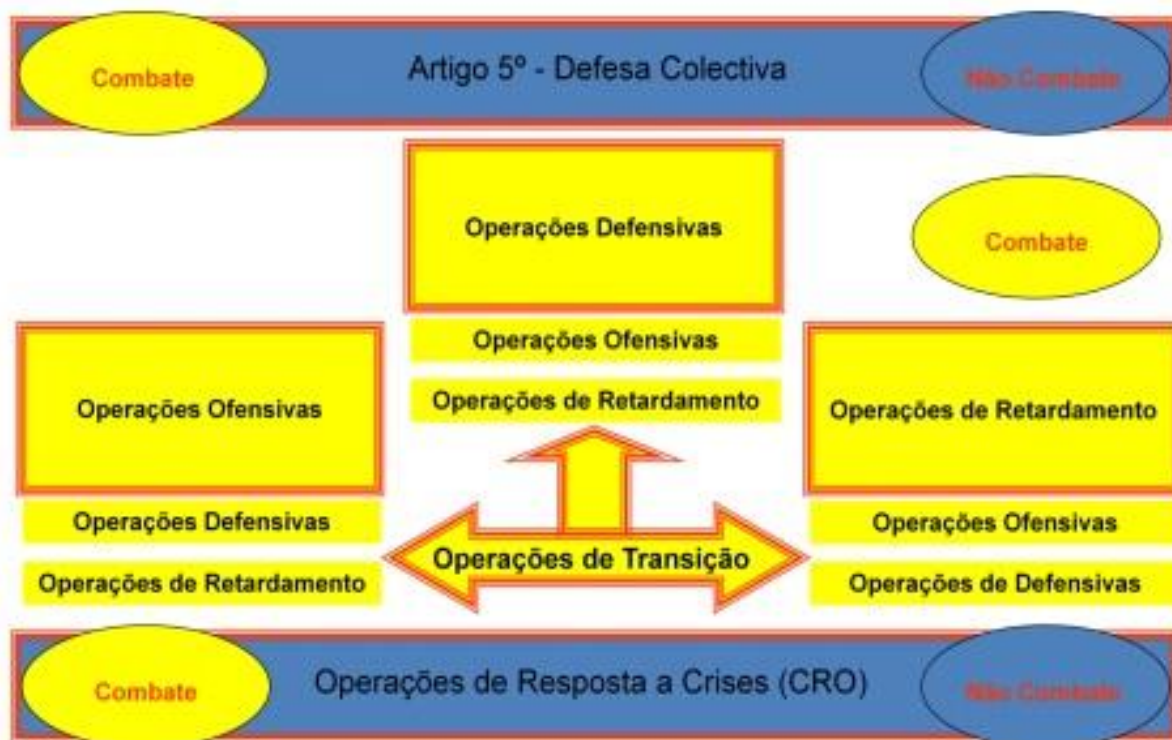
Figura 4: Artigo 5º Defesa Coletiva