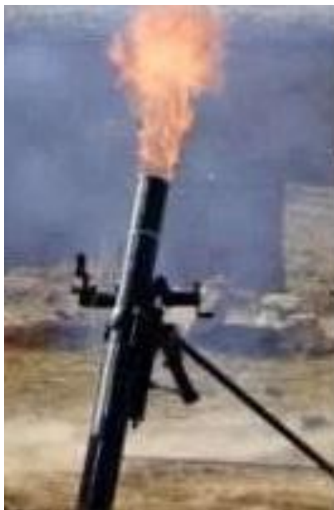
Figura 5: Morteiro M120