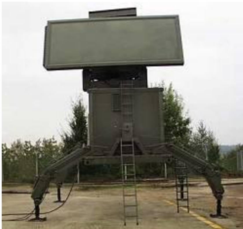
Figura 9: Radar AN/TPQ 37