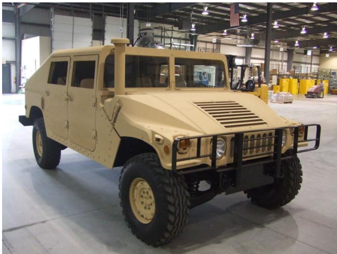
Figura 7: Viatura HMMWV