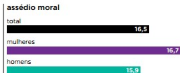
Gráfico 1 - Percentagem de assédio moral por sexo 119

É evidente que as mulheres têm uma taxa de vitimização maior que os homens, contudo, não consideramos a diferença significativa.