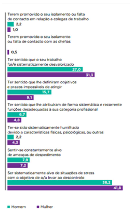
Gráfico 3 - Indicadores de assédio moral (deve considerar-se a primeira barra em cada indicador como referente aos Homens e a segunda referente às Mulheres)

Por fim, apenas as mulheres revelam ser vítimas de assédio moral no trabalho por meio de isolamento em relação às chefias, com uma percentagem de 0,5%.