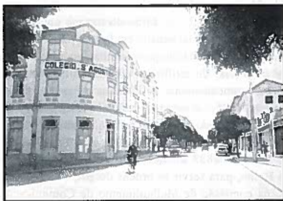
Figura 1- Colégio de Santo Agostinho

A sua instrução preparatória foi-lhe ministrada no antigo colégio de Santo Agostinho, onde passou o "verdor dos annos, tendo dado sempre mostras de assiduidade, bastante progresso e boa morigeração de costumes" 1