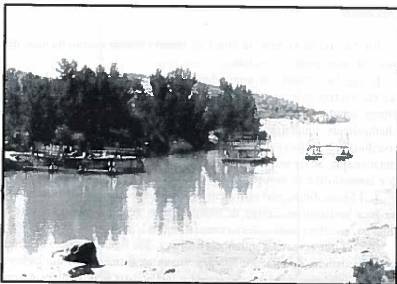
Figura 1 - Lançamento de ponte de cavaletes sobre barcos no Rio Tejo (exercício em 1888)