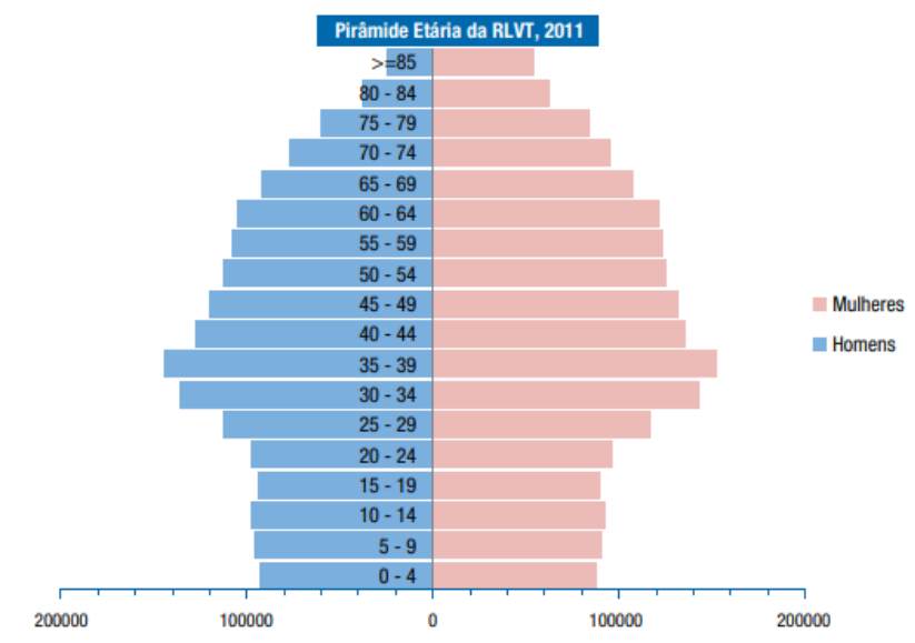
Figura n.º 2 - Pirâmide Etária por sexo e grupo etário da Região de Lisboa e Vale do Tejo

De acordo com o Perfil de Saúde, e Seus Determinantes da Região de Lisboa e Vale do Tejo, elaborado pela ARSLVT (2015), tendo por base os Censos de 2011, constatou-se uma diminuição do crescimento demográfico (nacional), com 2,0% de aumento, comparativamente aos 5,0% na década de 90 do século passado. Porém, verificou-se na RLVT, em 2011, um crescimento demográfico de +5,3% (+183943 efetivos), com acréscimo de indivíduos em quatro das cinco NUTS III da Região. Quanto à análise da evolução da população por sexo na RLVT, verificou-se um aumento do número de habitantes de 2001 para 2011, em ambos os sexos. O maior crescimento da população da Região assinalou-se no sexo feminino (+6,5%, tendo sido de +4,0 no sexo masculino). Considerando as NUTS III da RLVT, o maior crescimento ocorreu no sexo feminino, na Península de Setúbal (+10,8%), e o menor no sexo masculino (+1,9%), na Lezíria do Tejo. Quanto ao crescimento natural na RLVT, em 2011, apurou-se uma taxa de 0,08%, correspondendo a um saldo fisiológico positivo de cerca de 3035 pessoas, superior à taxa nacional (crescimento natural negativo [taxa de -0.06]). A densidade populacional da RLVT, em 2011, era de 309,4 habitantes/km 2 , quase três vezes superior à nacional (114,3 habitantes/ km 2 ).