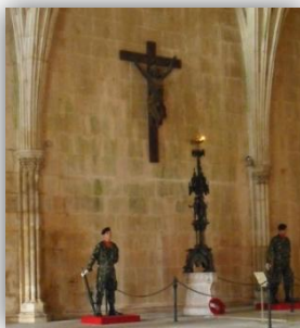
Figura 17: Lampadário Monumental ao Soldado Desconhecido no Mosteiro da Batalha 100

e as atenções que a conservação da riqueza artística lhe merecia. Foi outra forma que encontrou para servir a sua amada Pátria.