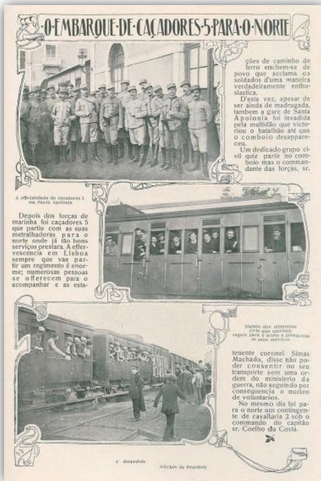
Figura 7: O Batalhão de Caçadores 5 a embarcar par o Norte 32

jovem República. De novo, Simas Machado foi brilhante, compreendeu a complexa missão que lhe foi atribuída e defendeu firmemente os interesses do regime republicano.