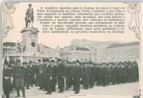
Figura 9: Batalhões de Voluntários formados no Terreiro do Paço 48

início do ano de 1911, surgiram aproximadamente 37 dessas forças. O seu efetivo variava, “podendo ir dos 100 aos 1000 civis armados. Ao longo desse ano os seus efetivos foram crescendo apoiados pelo ministério que os legitimava e os “financiava” 47 .