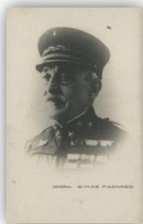
Figura 18: General José Augusto Simas Machado 114

“Fazendo o elogio do homenageado, o orador começou por acentuar que não alia indiferentemente as qualidades de homem de bem às de grande militar, porque nunca se poderá ser um verdadeiro chefe de guerra, digno de levar soldados para a morte pela Pátria, sem se ter um alto sentimento da honra, do dever, do desinteresse pessoal e da simples piedade humana” 113 .