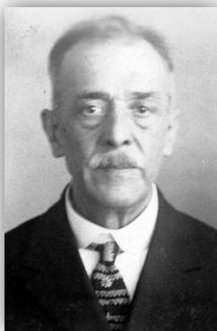
Figura 10: Simas Machado, Presidente da Câmara dos Deputados 53

Entretanto, assolado por um sentimento de desilusão, face ao caminho que a República estava a tomar, seguiu-se um outro importante momento da sua carreira política. Em 1915, já como coronel e depois de passar pelo comando do 3º Grupo de