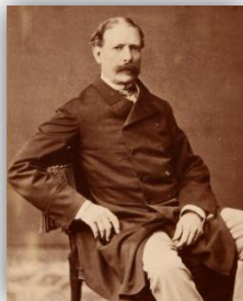
Figura 1: Fontes Pereira de Melo 5

“novo conceito do Portugal ultramarino”, mas também cresceu a cobiça dos principais Estados europeus pelos territórios africanos. Esta particular conjuntura veio garantir legitimidade ao povoamento das designadas terras ultramarinas, através da consagração do princípio da “ocupação efectiva”, tendo em vista a reivindicação dos “direitos históricos de Portugal” 4 .