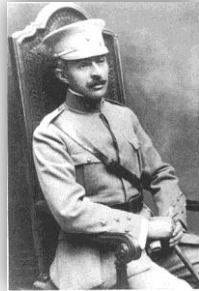
Figura 4: Sidónio Pais 15

de Castro, foi precisamente em finais do ano de 1917, que outro acontecimento irá marcar, profundamente, a vida de Simas Machado: o golpe de Sidónio País. O regime republicano já durava há cerca de sete anos, e ao contrário do que era esperado, e do que tinha sido propagandeado pelos homens do 5 de outubro, “nem a dignidade de Portugal nem a vida da maioria dos portugueses tinham mudado para melhor”. Muitos dos republicanos, chamados os “puros” e onde se incluía Simas Machado, não se reviam num regime que se limitava a administrar “uma rede de interesses semelhante à dos partidos do rotativismo monárquico”. E por isso, a população ambicionava a chegada de um “messias”, alguém que constituísse uma alternativa válida a Afonso Costa, o líder carismático do Partido Democrático, herdeiro do Partido Republicano Português, e o responsável pelo Governo. Esse herói foi Sidónio Pais (figura 4), o homem que viria a liderar uma conspiração que culminou com o golpe de Estado de 5 de dezembro de 1917 e que pôs termo ao “monopólio do poder” que Afonso Costa, entretanto, tinha alcançado. O herói do 5 de dezembro era, acima de tudo, um “patriota indignado” que tinha como sonho “reconciliar todos os portugueses”. Tal como Raul Brandão o caracterizou, “havia nele uma distinção que os outros não tiveram” e que transmitia a confiança necessária para aderirem às suas ideias e às suas convicções 14 .