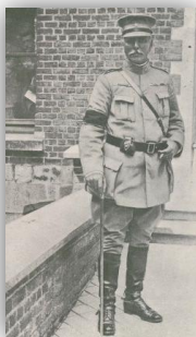
Figura 5: general Gomes da Costa 20

Ao contrário do que acontecera em 1917, desta vez, Simas Machado não irá aderir ao movimento dos revoltosos liderado por Gomes da Costa, e por isso mesmo, sofrerá as respetivas consequências. Mais uma vez, as suas convicções e a sua jura à República, no contexto de um Portugal livre e democrático, determinariam o seu posicionamento.