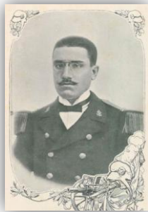
Figura 6: António Machado Santos, “Comandante das Forças Revolucionárias no alto da Avenida” 28

Em outubro de 1911, com 52 anos de idade, Simas Machado era, desde 1910, tenente-coronel, comandava o Batalhão de Caçadores 5, antigo 3º Batalhão de Infantaria n.º 3 aquartelado em Barcelos, e a jovem República preparava-se para o seu primeiro aniversário. Contudo, não eram só os republicanos que se aprontavam para as comemorações. Havia, no seio da sociedade portuguesa daquela época, quem conspirasse contra a República. Nomeadamente, aqueles que acreditavam que o 5 de outubro de 1910, mais do que uma revolução popular, tinha sido “um golpe político-militar com o apoio e a adesão dos sectores progressistas da classe média de Lisboa e Porto e de parte do Lumpem urbano”. Era convicção desse movimento que “a legitimidade ancestral dos Bragança não fora substituída pela legitimidade popular, mas pela legitimidade revolucionária da força, que a vitória transformara em mandato constituinte”. Entre eles, estava Paiva Couceiro, o capitão artilheiro, herói de África, que tinha sido derrotado pelos soldados e militantes republicanos da Rotunda liderados por Machado Santos 27 (figura 6).