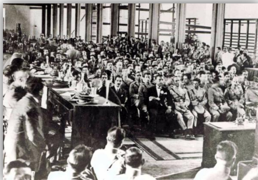
Figura 18: Julgamento dos Revoltosos de 18 de Abril de 1925 108

Nos finais de 1925, foi nomeado comandante da 1ª Divisão Militar, em Lisboa, cargo que irá ocupar até data da Revolução Nacional de 28 de maio de 1926. A seu pedido, é exonerado do cargo passados alguns dias 109 . Simas Machado não irá aderir ao movimento que instituiu a ditadura militar e que, de imediato, gerou a suspensão da Constituição de 1911, a dissolução do Parlamento e o estabelecimento da Censura. Esta postura, que era coerente com o que vinha defendendo desde 1910, afastou-o de Gomes da Costa, o homem que tinha estado ao seu lado em França e na defesa a Sidónio Pais, e terá sido essa a circunstância determinou o epílogo da sua carreira. Pensamos que desiludido mas, as suas convicções e a sua jura à República, no contexto de um Portugal livre e democrático, não lhe permitiram outra decisão para além daquela que tomou.