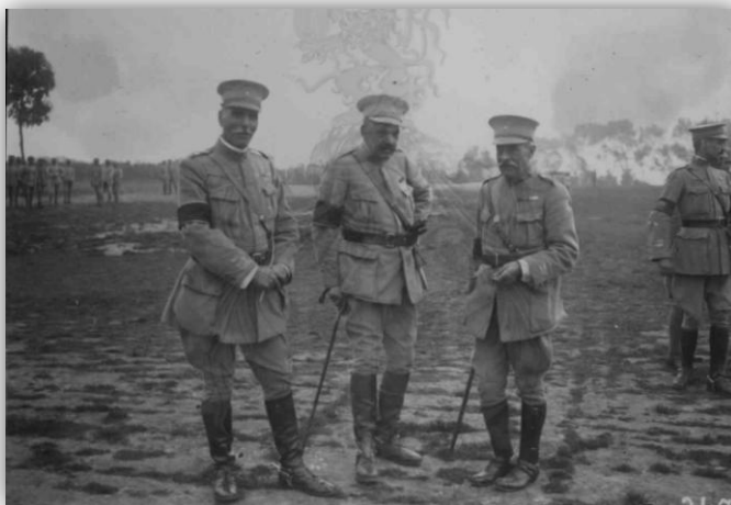
Figura 12: Os três generais do CEP: Gomas da Costa, Fernando Tamagnini e Simas Machado 62

O seu passado político e a sua proximidade a António José de Almeida do Partido Evolucionista, pelo qual foi eleito deputado, muito contribuiu para a sua convocação como um dos três generais do CEP (figura 12).