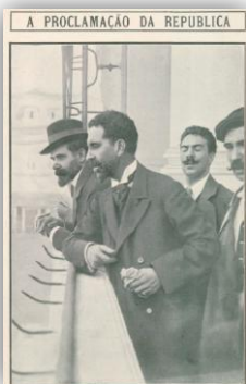
Figura 2: José Relvas a fazer a proclamação da República das Janelas da Câmara Municipal de Lisboa em 5 de Outubro de 1910 9

Mas mais do que isso, para além deste estado de espírito, este ultimato foi responsável por uma “nova etapa na popularização do ideal da República”, ao qual Simas Machado não se iria alhear. A inoperância do Governo, e designadamente do Rei, foi interpretado pelo povo como um “acto de traição nacional nascida da corrupção: era o rei e a sua camarilha que estavam feitos com os ingleses”. Foi desta forma, que o Partido Republicano começou a ganhar o balanço necessário para desenvolver um movimento de conspiração contra o regime que iria culminar, numa primeira instância, com o assassinato do rei D. Carlos em 1908 e, posteriormente, com a queda da monarquia e a consequente proclamação da República a 5 outubro de 1910 (figura 2) 8 .