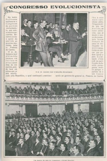
Figura 11: Congresso Evolucionista, no topo pode-se ver António José de Almeida a discursar 57