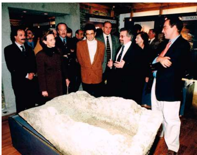
FIG. 6 – INAUGURAÇÃO DO MUSEU DE SÍTIO DE ERVAMOIRA PELO MINISTRO DA CULTURA A 1 DE NOVEMBRO DE 1997; FOTOGRAFIA DO AHARP.

A institucionalização do PAVC, com todas as contradições que possa ter tido, foi um momento alto da Arqueologia portuguesa. Mas não precisava de ter cometido as injustiças que cometeu contra alguns daqueles que contribuíram para o desenrolar do processo, enquanto que alguns outros com responsabilidades na área da Cultura, que até alinharam com os seus detratores, passaram incólumes a uma situação de esquecimento confortável. Ao longo destes anos é indubitável que a instituição produziu um muito bom trabalho no que diz respeito à Arte Rupestre do Côa, da Pré-história nacional, peninsular e mundial, nos aspetos da prospeção, interpretação e musealização, que já serviram de paradigma para outras manifestações noutras latitudes. (RODRIGUES; LIMA & SANTOS 2011, artigos de vários autores). Mas a restante arqueologia, da proto-história à industrial, foi deixada a outras entidades, como foi o caso de Ervamoira, até porque é propriedade de uma entidade privada, não tendo os nossos trabalhos recebido qualquer apoio do programa PROCÔA, entretanto implementado, nem sequer para publicar os textos entretanto produzidos, que têm vindo a ser disponibilizados em várias revistas nacionais e estrangeiras, mas dispersos.