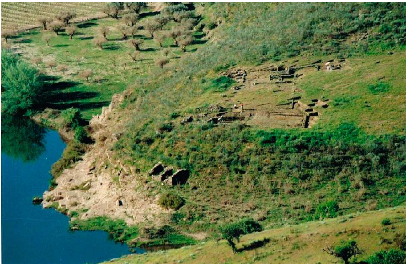
FIG. 7 – A ESTAÇÃO ARQUEOLÓGICA AINDA EM FASE DE INTERVENÇÃO, 1996; FOTOGRAFIA DE PAULO MAGALHÃES.

A primeira área a ser intervencionada foi o local no alto da colina da estação onde apareceu o sarcófago de pedra, partido e deslocado, mas que, curiosamente, tinha sido colocado sobre uma sepultura aberta e talhada no xisto, com rebaixamento lateral em toda a bordadura e que em tempos esteve coberta por placas de xisto, que o peso do sarcófago partiu, mas que não tinha qualquer espólio. Seria uma zona de necrópole para os poucos habitantes do local (GUIMARÃES & PEIXOTO, 1988; GUIMARÃES, 2000 b).