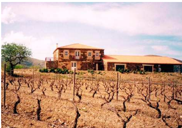
FIG. 8 – VISTA EXTERIOR DO MUSEU DE SÍTIO DE ERVAMOIRA EM 1997; FOTOGRAFIA DE J. A. G. G..

terão feito parte de um telheiro aberto para recolha de animais. Na sua periferia nascente existiu um denso núcleo de negrilhos anões, mas com vestígios de outros de maior porte, talvez o que restava a justificar a denominação setecentista de Nossa Senhora dos Carvalhais. Na extremidade sul da plataforma, restava parte de uma parede da capela e restos das restantes, muito derruídas.