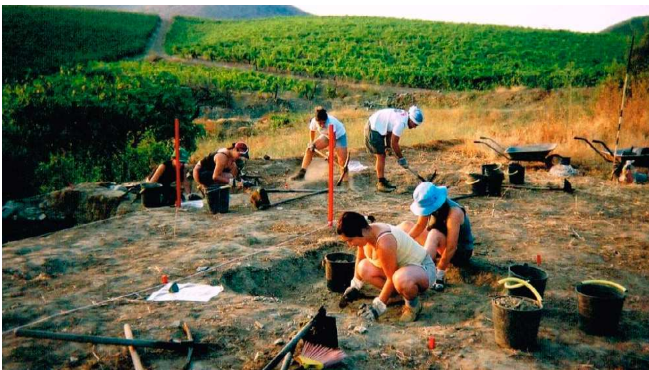
FIG. 9 – ESCAVAÇÕES EM ERVAMOIRA B, 2002; FOTOGRAFIA DE J. A. G. G..

Depois deste último o testemunho numismático desaparece e só volta no final do século XIX, quer em Ervamoira B, quer na área de implantação da Casa da Quinta, prosseguindo já pelo século XX com alguns exemplares (GUIMARÃES & GUIMARÃES, 2005).