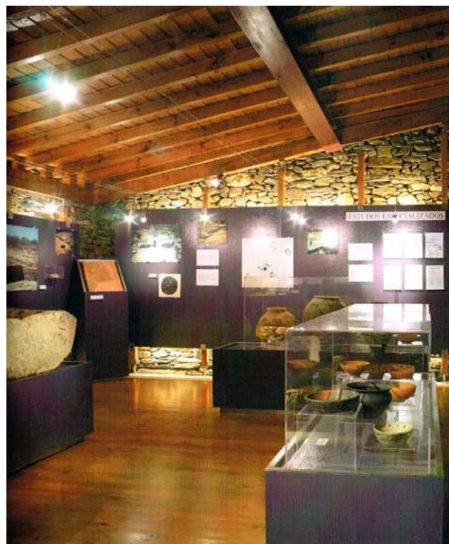
FIG. 11 – SALA DA ARQUEOLOGIA DO MUSEU DE SÍTIO DE ERVAMOIRA; FOTOGRAFIA DO AHARP:

sobre a presença romana aqui avance para a produção de uma grande síntese, para a qual Ervamoira terá dado o seu contributo.