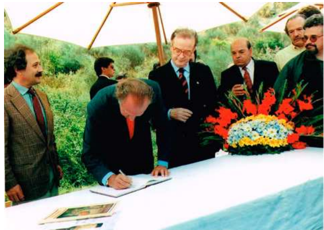
FIG. 5 – APRESENTAÇÃO DO PROJETO DO MUSEU DE SÍTIO DE ERVAMOIRA AO PRESIDENTE DA REPÚBLICA PORTUGUESA E AO REI DE ESPANHA NO VALE DO CÔA A 6 DE JUNHO DE 1997; FOTOGRAFIA DO AHARP.

Para nós a estação arqueológica da Quinta da Ervamoira, e os trabalhos a que ia dando origem, só faziam sentido se articulados com o conhecimento da região e a sua complementaridade em franca colaboração com todos os seus agentes culturais e, em primeiro lugar, com os arqueólogos por motivos óbvios. Os trabalhos interdisciplinares que ali promovemos foram sempre disponibilizados a todos os que os procuraram. Creio que também por todos estes motivos, foi classificada como monumento nacional, com os restantes sítios arqueológicos já então conhecidos no Vale do Côa, através de despacho do Ministro da Cultura de 13 de agosto de 1996.