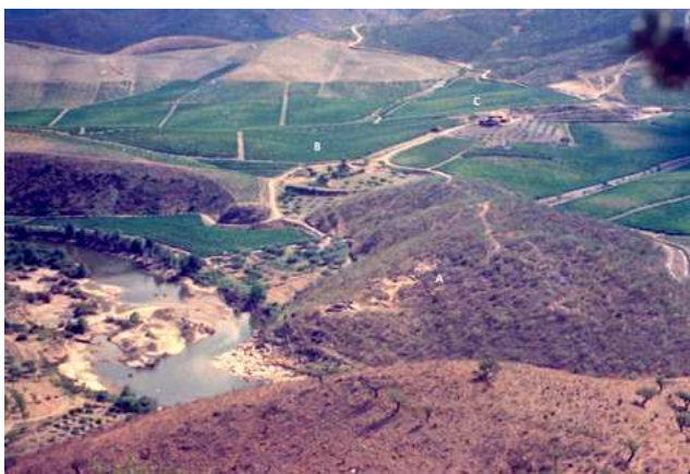
FIG. 3 – QUINTA DA ERVAMOIRA: ESTAÇÃO ROMANA E MEDIEVAL (A); ÁREA DA ANTIGA CAPELA (B); CASADA QUINTA (C)