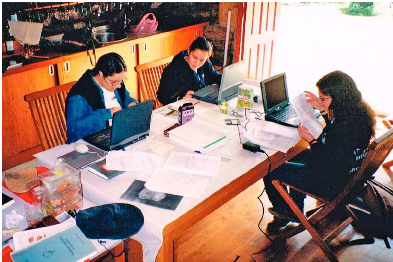
FIG. 10 – TRATAMENTO INFORMÁTICO DO ESPÓLIO DE ERVAMOIRA, 2002: FOTOGRAFIA DE J. A. G. G..

Neste universo ceramológico estão por estudar as cerâmicas pré-romanas, as sigillata 147 , e a cerâmica da Alta Idade Média, de Ervamoira A (estação arqueológica romana e medieval), bem assim como a cerâmica tradicional da região e as faianças de Ervamoira B (área da capela).