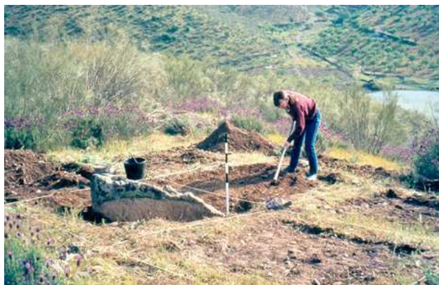
FIG. 2 – INÍCIO DA INTERVENÇÃO ARQUEOLÓGICA EM ERVAMOIRA, ABRIL DE 1985.

anual no verão até 2004, complementada desde 1997, com as Semanas de Estudos Especializados realizadas nas férias da primavera, também organizadas pelo GHAVNG com a colaboração da Universidade Portucalense Infante D. Henrique (UPT), onde exercíamos a docência, em horário pós-laboral desde 1991, e do Departamento de Biologia da Faculdade de Ciências da Universidade do Porto (FCUP); (GUIMARÃES & PEIXOTO, 1988; idem, idem , 1994: 235-262; GUIMARÃES, 2004: 141-151) 137 .