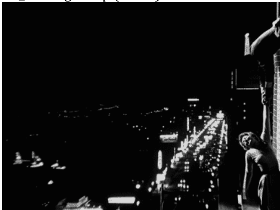
19_Witness To Murder (1954)