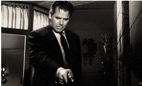
21_The Big Heat (1953)