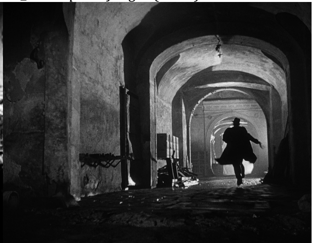
12_The Third Man (1949)