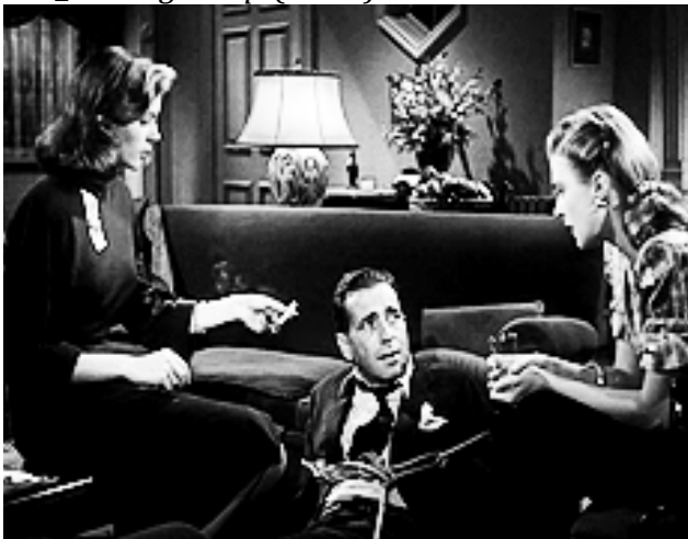
11_The Big Sleep (1946)