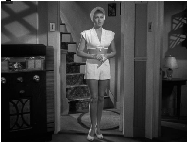
3 The Postman Always Rings Twice (1946)