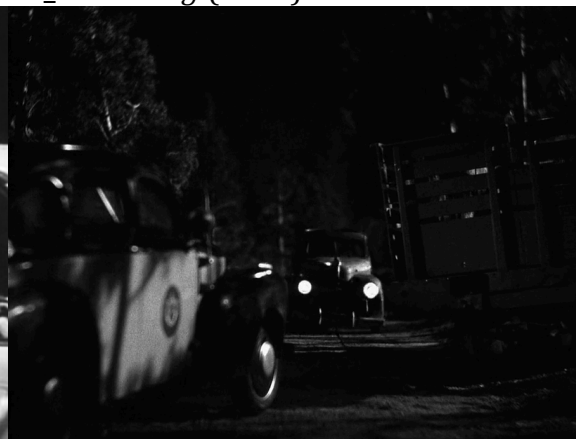
26_Out of the Past (1947)