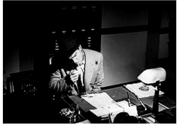
2 Double Indemnity (1944)