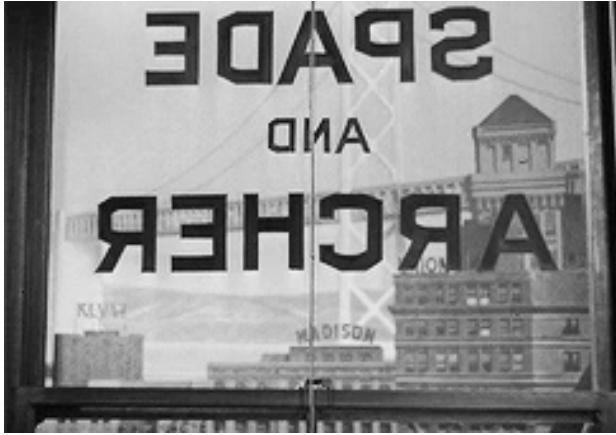
1 The Maltese Falcon (1941)