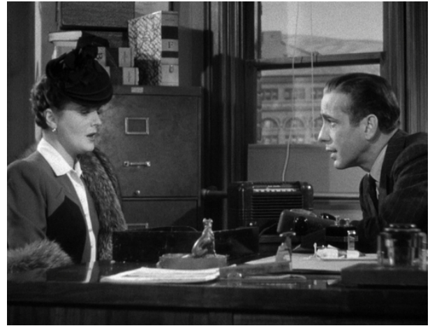
4 The Maltese Falcon (1941)