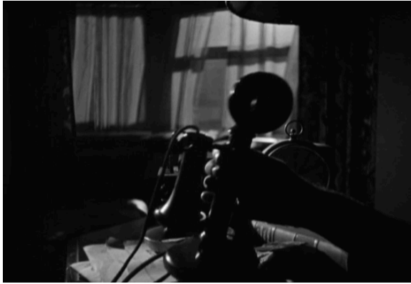
13_The Maltese Falcon (1941)