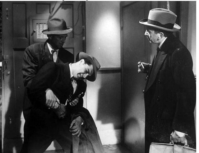
10_The Asphalt Jungle (1950)