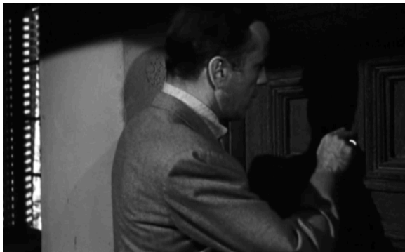
15_In a Lonely Place (1950)