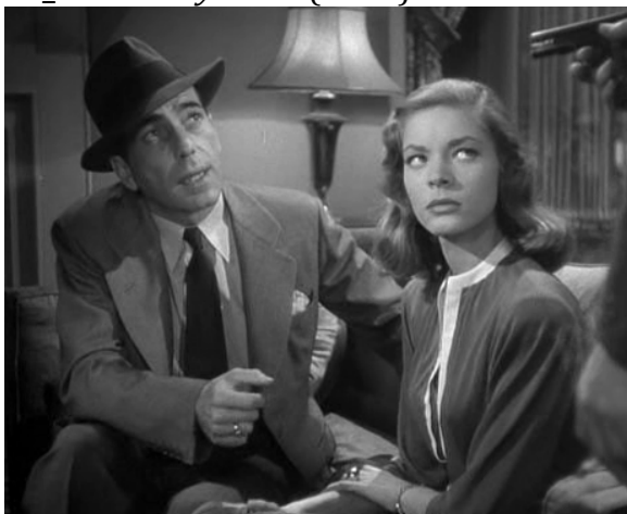
17_The Big Sleep (1946)