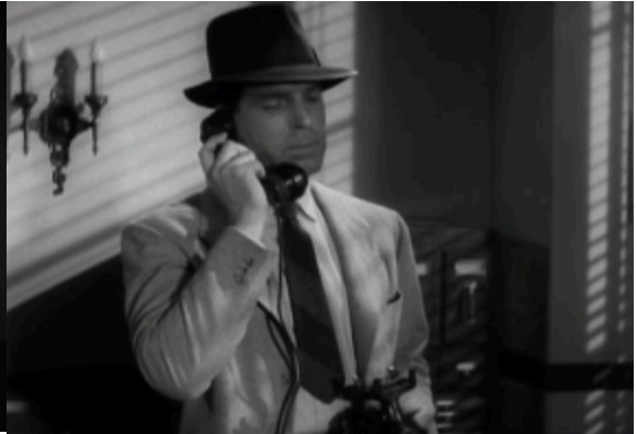
14_Double Indemnity (1944)