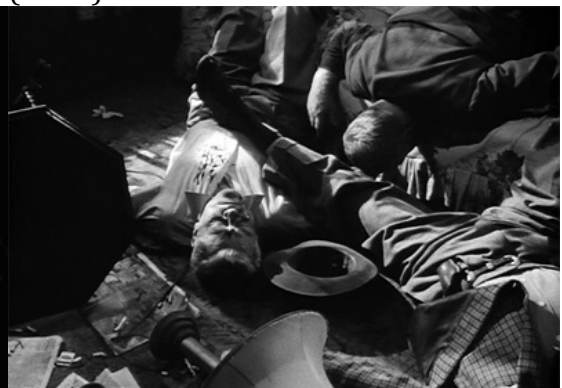
24_The Killing (1956)