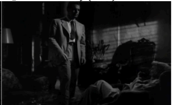
16_Double Indemnity (1944)