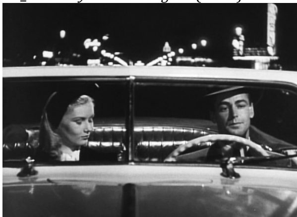
25_The Blue Dahlia (1946)