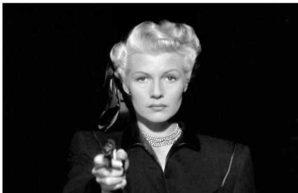
23_The Lady From Shanghai (1947)