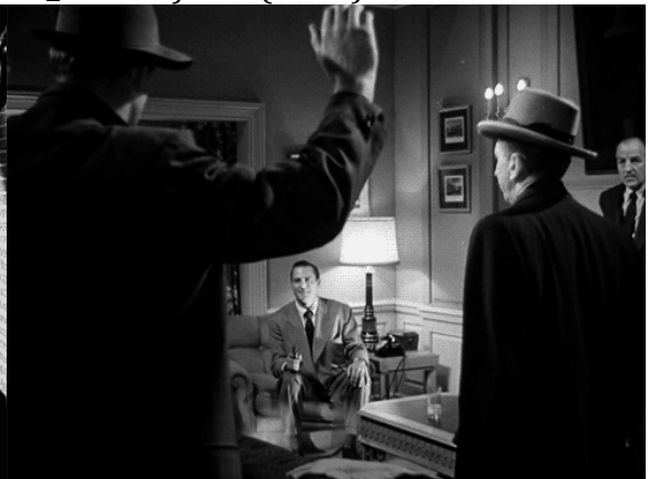
20_The Asphalt Jungle (1950)