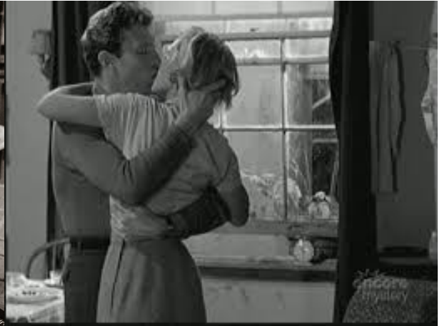
8_Killer's Kiss (1955)