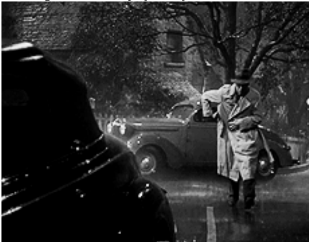
9_The Big Sleep (1946)