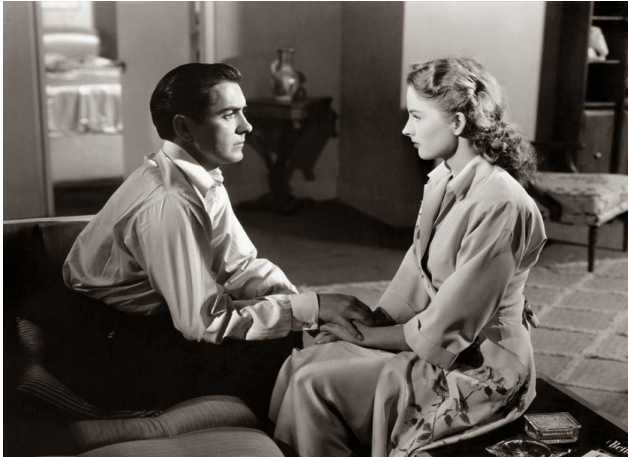
7_Nightmare Alley (1947)