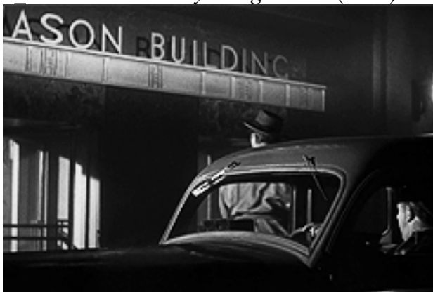
5 Out of the Past (1947)