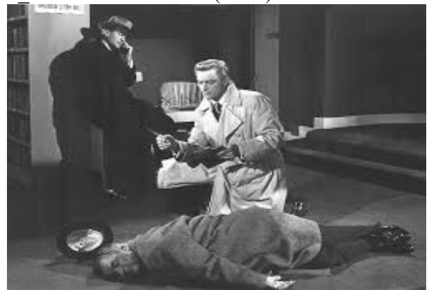
6 Quiet Please: Murder (1942)