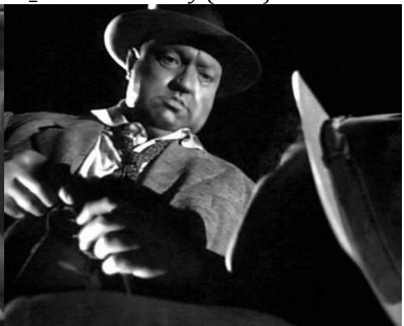
18_Touch of Evil (1958)