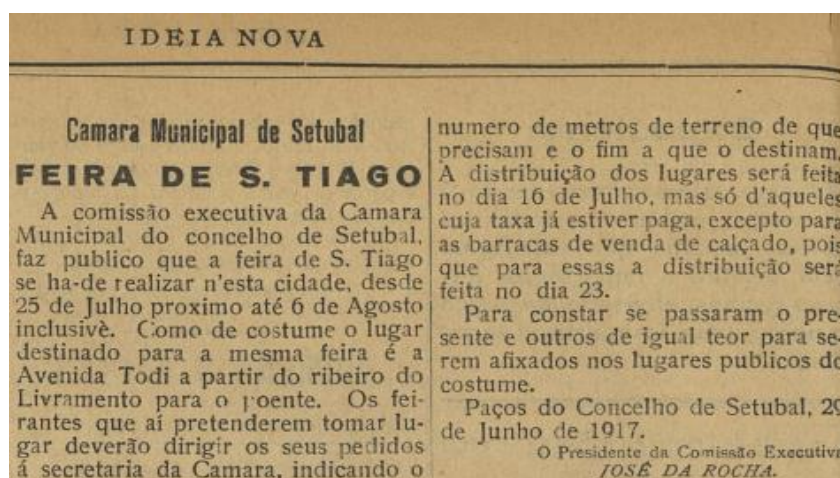
Figura 1: «Ideia Nova», 30/06/1917 (BMS)

As ferramentas específicas da investigação histórica permitem enfrentar e enquadrar as memórias. “Se para os setubalenses a sua cidade está, naturalmente, no centro das suas vidas” (Rito, 2020, p.9), a memória comum sobre a Feira de Sant’Iago é parte essencial da comunidade. Ainda assim, a recolha de memórias sem o enquadramento necessário de outras fontes, não serve de muito para fazer História. A imprensa local, como “instrumento comunicacional de partilha de informação [e parte importante na] (...) construção de uma moderna identidade urbana” (Soromenho-Marques, 2020, p.16) funciona como outro repositório e testemunha de acontecimentos, momentos e perceções que transformaram Setúbal, a região sadina e o país. É deste modo que, da articulação entre a História local e a e a memória coletiva a Feira de Sant’Iago tem a potencialidade de referente para o conhecimento do passado local em articulação com diferentes momentos histórico-políticos nacionais.