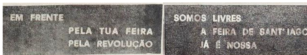
Figura 3: O Setubalense, 28/07/1974 (BMS)