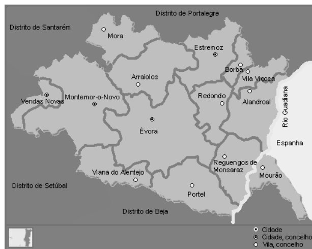
Figura 2- Distrito de Évora e respetivos concelhos