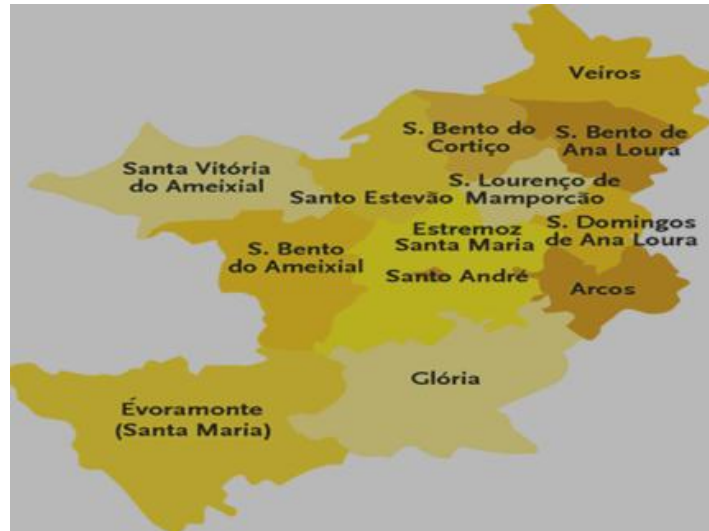
Figura 3- Freguesias do concelho de Estremoz

O concelho é constituído por treze freguesias (Fig 3): Santo André, Santa Maria, Arcos, São Domingos de Analoura, Glória, Évoramonte, São Bento do Ameixial, Santa Vitória do Ameixial, São Lourenço de Mamporcão, São Bento do Cortiço, São Bento de Analoura, Santo Estêvão e Veiros.