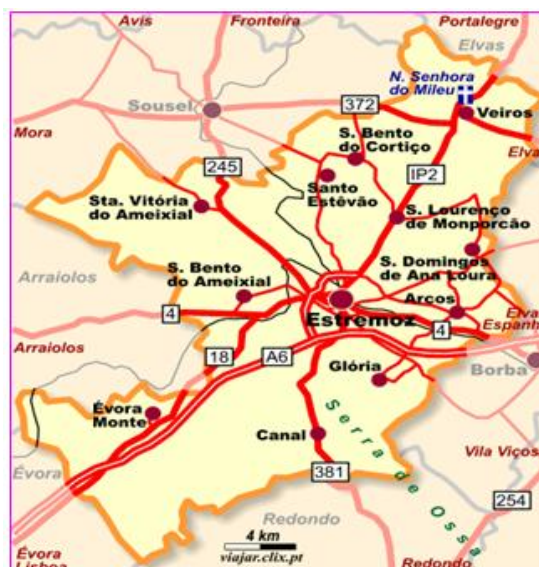
Figura 4- Concelho de Estremoz

Como podemos verificar na fig. 4, no concelho de Estremoz a grande maioria das freguesias rurais não têm ligação viária entre elas. A rede viária entre a sede do concelho e as freguesias encontra-se em bom estado de conservação, não acontecendo o mesmo em alguns caminhos rurais e algumas das poucas ligações existentes entre as freguesias rurais.