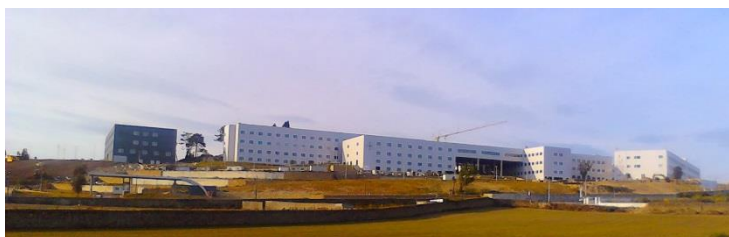
Figura 33 - Hospitais Senhor do Bonfim

Também se realizaram e acompanharam atividades junto das marcas representadas para assegurar a instalação do maior hospital privado do país em Vila do Conde chamado Hospitais Senhor do Bonfim (Figura 33).