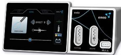
Figura 29 - Eletrobistúri Endo

O topo de gama é o modelo SPECTRUM (Figura 30).