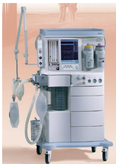
Figura 16 -Sistema de anestesia Leon (retirado de catálogo da Heinen & Lowenstein)

Outra grande diferença entre os dois modelos é a presença do sensor ótico no fole do sistema de impulsão, permitindo uma gama de valores mais abrangente no que diz respeito ao volume corrente que o equipamento é capaz de realizar.