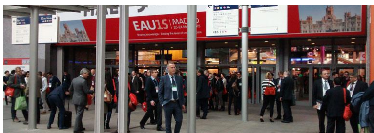
Figura 35 - Congresso Europeu de Urologia

No final do mês de março, nos dias 20, 21, 22, 23 e 24 decorreu o Congresso Europeu de Urologia (Figura 35) organizado pela Associação Europeia de Urologia em Madrid onde a Medicinália Cormédica marcou presença com três elementos do DE.