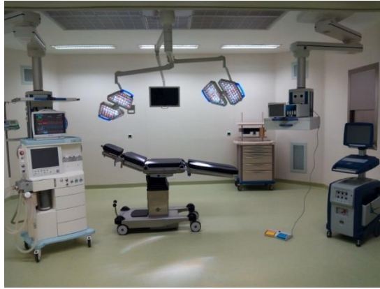
Figura 5 - Sala operatória

Os trabalhos relativos à gestão deste projeto ainda se encontram em aberto, uma vez que, por motivos alheios à Medicinália Cormédica, ainda não foi possível a abertura ao público de todos os serviços, nomeadamente o próprio bloco operatório.