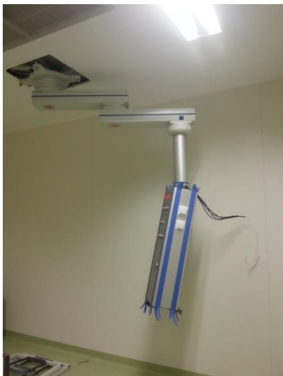
Figura 3 - Pendente de Anestesia

De realçar ainda que a atividade de gestor de projeto envolveu ainda a coordenação de trabalhos de uma empresa externa, que consistiu na instalação física dos equipamentos estruturais (Figura 3 e Figura 4). Esta atividade decorreu durante o mês de Novembro de 2014.