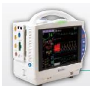
Figura 24 - Monitor BSM 6000

A gama inclui as variantes BSM 6300, 6500 e 6700 respetivamente 10.4, 12 ou 15 polegadas de ecrã.