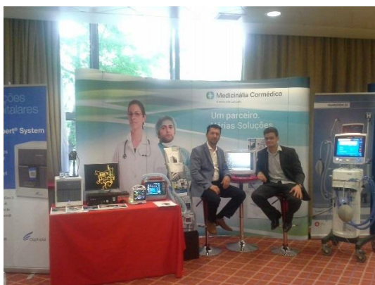
Figura 37 - Stand no Congresso Nacional de Medicina Intensiva

Para finalizar este trabalho e toda esta logística organizou-se também a participação no congresso da sociedade portuguesa de cuidados intensivos (Figura 37) em Lisboa nos dias 10, 11 e 12 de maio. A Medicinália Cormédica esteve presente com expositor e equipamento de cuidados intensivos, isto é, ventilador de transporte de cuidados intensivos (T1), ventilador topo de gama da Hamilton (S1) e dois monitores de sinais vitais, um de cabeceira (BSM 3762) e um monitor de transporte (PT 1700).