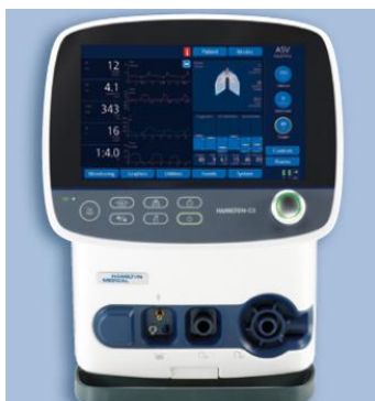
Figura 7 - Ventilador C3 (retirado de catálogo Hamilton)

A característica transversal a todos estes modelos é a existência de uma turbina de alta performance, ou seja, ausência de necessidade de ar respirável pressurizado. A diferenciação existente entre o C3 (Figura 7), C2 (Figura 8) e C1 (Figura 9) prende-se pelo facto do tamanho do display e dos modos ventilatórios incluídos em cada um dos modelos serem diferentes.