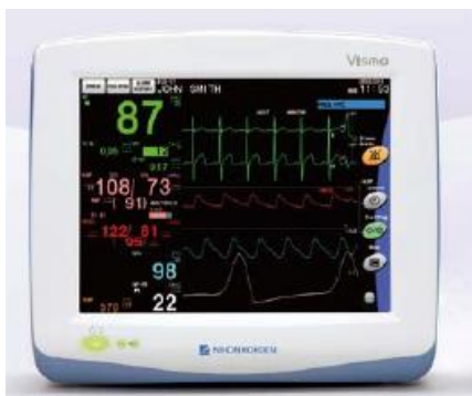
Figura 20 - Monitor PVM (retirado do catálogo da Nihon Kohden)

Isto é, o que noutras marcas só é possível com módulos e software adicional, é possível fazer na NK apenas com o cabo do sensor correspondente ao parâmetro a ler.