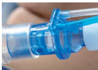
Figura 14 - Sensor de Fluxo Proximal (retirado de catálogo Hamilton)

Esta técnica tem a vantagem de não necessitar de compensação devido a fugas e compliance das traqueias. Esta compensação é feita naturalmente pelo facto desta ser realizada após o sensor. Assim, pode-se afirmar que os valores medidos pelo sensor de fluxo proximal da Hamilton são mais fidedignos que qualquer outra medição com cálculos e respetivas compensações feitos pelas outras marcas.