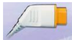
Figura 21 - Multi connector (retirado do catálogo da Nihon Kohden)

O monitor reconhece o smartCable e identifica automaticamente qual o parâmetro a ser analisado. Assim, a solução é sempre mais acessível para o cliente.