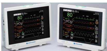
Figura 19 - Linha SVM (retirado do catálogo da Nihon Kohden)

A linha SVM (Figura 19), é um modelo low-cost que a Nihon Kohden criou para poder ser uma gama a considerar em concursos menos exigentes tecnicamente e mais exigentes em preço.