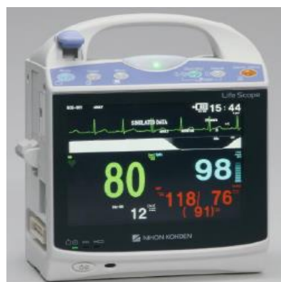
Figura 26 - Monitor PT 1700 (retirado do catálogo da Nihon Kohden)

A solução com memória interna guarda toda a informação recolhida mesmo quando o módulo não está conectado a nenhum monitor.