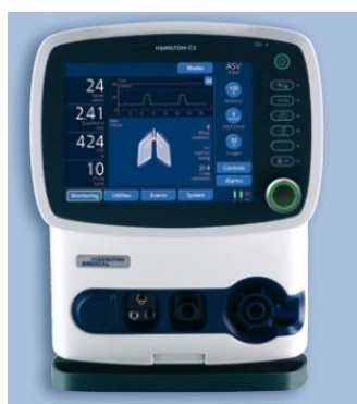
Figura 8 - Ventilador C2 (retirado de catálogo Hamilton)