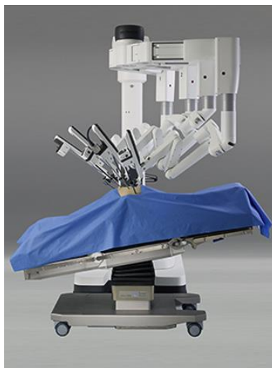
Figura 31 - Mesa Trumpf com sistema DaVinci (retirado do catálogo da Trumpf)

Por outro lado, o portefólio correspondente aos pendentes de teto é o mais antigo da Trumpf, que integram a marca Kreuzer. Neste caso os fatores de diferenciação, para além da qualidade Trumpf, são, mais uma vez a inovação tecnológica, disponibilizando os primeiros sistemas modulares do mercado.