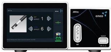
Figura 28 - Eletrobistúri Artro (retirado do catálogo da EMED)

O portefólio da EMED inclui os modelos dedicados a procedimentos endoscópicos específicos, que são o ENDO (Figura 29) e o ARTRO (Figura 28) para tratamentos gástricos e artroscópicos, respetivamente.