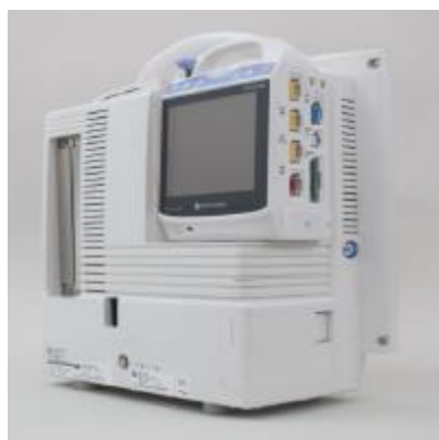
Figura 25 - Encaixe do monitor BSM 6000 para o PT1700 (retirado do catálogo da Nihon Kohden)

No sentido da prevista constante monitorização do paciente em transporte a NK desenvolveu duas soluções distintas.