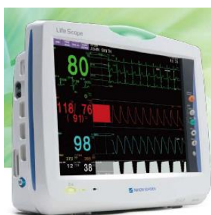
Figura 23 - Linha BSM 3000 (retirado do catálogo da Nihon Kohden)

Estes diferem no tamanho do ecrã, 12 polegadas e 15 polegadas, respetivamente, bem como no número de multiconectores presentes em cada um dos modelos, sendo dois e no outro três, respetivamente.