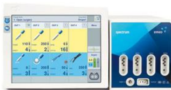
Figura 30 - Eletrobistúri Spectrum

Outra grande inovação é o tipo de regulação da potência, que passa a ser automaticamente gerida pelo aparelho. Desta forma, o corte ou a coagulação é sempre otimizada.