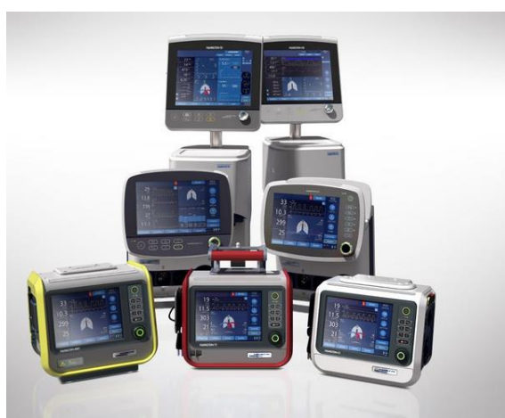
Figura 6 - Portefólio da Hamilton

Esta marca é sediada na Suíça e tem uma história na ventilação desde o ano de 1982. A Hamilton tem no seu portefólio sete modelos de ventiladores (Figura 6). Estes sete modelos estão divididos em duas plataformas, sendo a principal diferença entre elas a respetiva mobilidade, a presença ou não de ar comprimido e funcionalidades específicas de cada modelo.