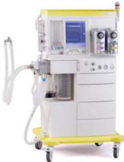
Figura 18 - Sistema de anestesia Leon MRI (retirado de catálogo da Heinen & Lowenstein)

O Leon MRI, tal como o nome indica, tem na sua construção as adaptações necessárias para ser compatível com a ressonância magnética. A nível de funcionamento e modos ventilatórios é em todo semelhante aos outros dois modelos.