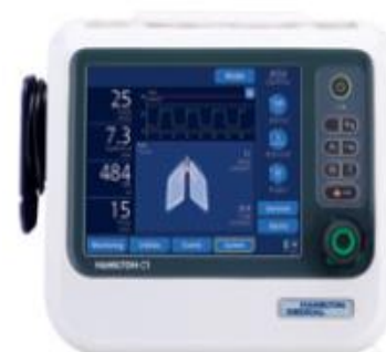
Figura 9 - Ventilador C1 (retirado de catálogo Hamilton)

Seguidamente irá ser feita uma descrição mais exaustiva do C1, pois destes três modelos é aquele que mais se adequa ao mercado português.