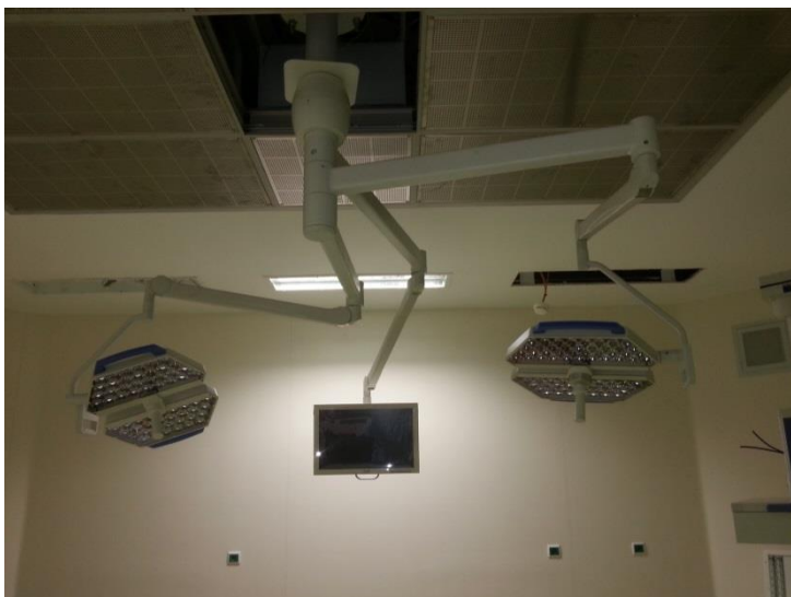
Figura 4 - Candeeiro Cirúrgico

Num projeto desta dimensão não é possível cumprir na íntegra os prazos de entrega obrigando ao reajuste do plano de montagem e teste de uma forma quase contínua. Para colmatar os atrasos verificados houve reagendamentos e reajustes de todas as recolhas, entregas e montagens com o objetivo de manter a conclusão do projeto no prazo estipulado.