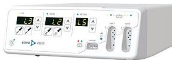
Figura 27 - Eletrobistúri ES 120

A EMED tem um portefólio de sete equipamentos diferentes. Começando pela unidade mais simples, o ES120 (Figura 27) atinge o máximo de 120W de potência orientado para todos os procedimentos de pequena cirurgia.