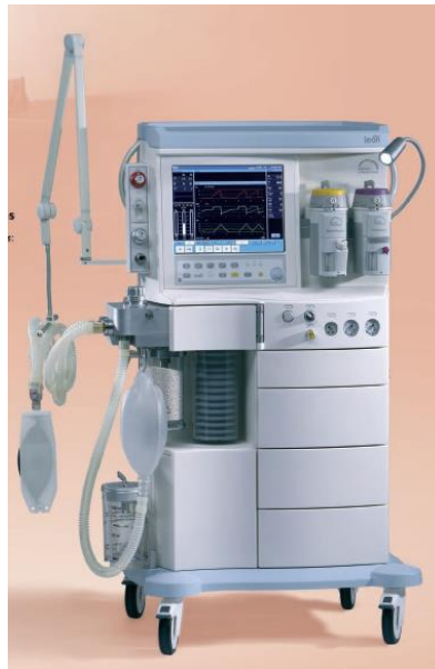
Figura 17 - Sistema de anestesia Leon Plus

O Leon MRI, tal como o nome indica, tem na sua construção as adaptações necessárias para ser compatível com a ressonância magnética. A nível de funcionamento e modos ventilatórios é em todo semelhante aos outros dois modelos.