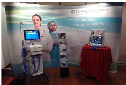
Figura 36 - Stand na reunião anual de cuidados intensivos pediátricos

No dia 16 de abril a Medicinália marcou presença na reunião anual de cuidados intensivos pediátricos (Figura 36) realizados no Centro Hospitalar do Porto, através de um stand de divulgação de equipamento de monitorização e ventilação, nomeadamente o ventilador S1 da Hamilton e monitor Nihon Kohden BSM 3762.