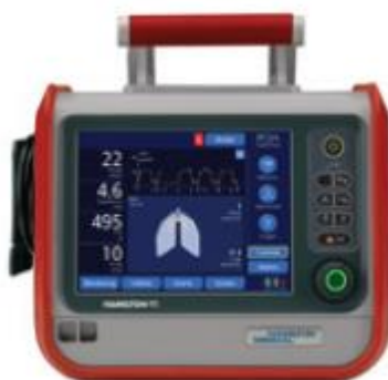
Figura 10 - Ventilador T1 (retirado de catálogo Hamilton)

A principal mais-valia do T1 é o facto de, apesar de ser de transporte, possuir as funcionalidades indispensáveis aos ventiladores de cuidados intensivos. Também é de referir que não existe concorrência para este ventilador, o que por um lado facilita a sua venda, mas por outro provoca que os principais concorrentes não admitam com facilidade a sua associação a ventilador de cuidados intensivos. Por outro lado o mercado nacional ainda não está modulado, ou seja não existem concursos ao ponto de conjugar a compra de um ventilador de transporte e de cuidados intensivos sendo comum a separação das duas áreas de ventilação.