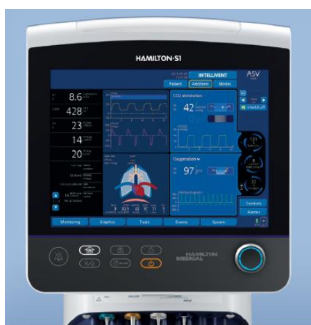
Figura 12 - Ventilador S1 (retirado de catálogo Hamilton)

O S1 é uma evolução do G5 com a inclusão de um modo ventilatório chamado Intellivent , único modo ventilatório existente no mercado completamente autónomo e que se ajusta ao paciente mediante as necessidades ventilatórias do mesmo. Isto é, através da leitura de parâmetros fisiológicos e ventilação do paciente, o equipamento adapta-se às necessidades diretamente permitindo um desmame mais rápido e fisiológico, transitando de modos ventilatórios e de parâmetros autonomamente.