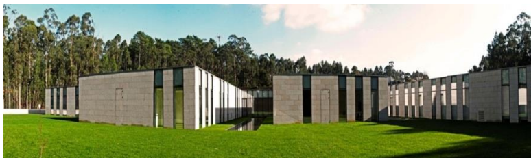
Figura 2- Instalações da Lenitudes Medical Center & Research

A Lenitudes Medical Center & Research tem uma área de investigação muito forte, tendo sido protocolado um acordo com a Universidade de Aveiro para integrar alunos em diferentes áreas. Na Lenitudes Medical Center & Research o investimento toda a tecnologia presente, é justificado com o mercado interno, complementando com uma forte parcela de turismo com saúde.