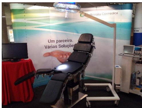
Figura 34 - Stand no congresso nacional de cirurgia

O primeiro congresso foi na Figueira da Foz (Figura 34), o congresso nacional de cirurgia nos dias 5, 6 e 7 de março de 2015. A participação foi com equipamento cirúrgico, eletrobistúri, candeeiro e mesa operatória.