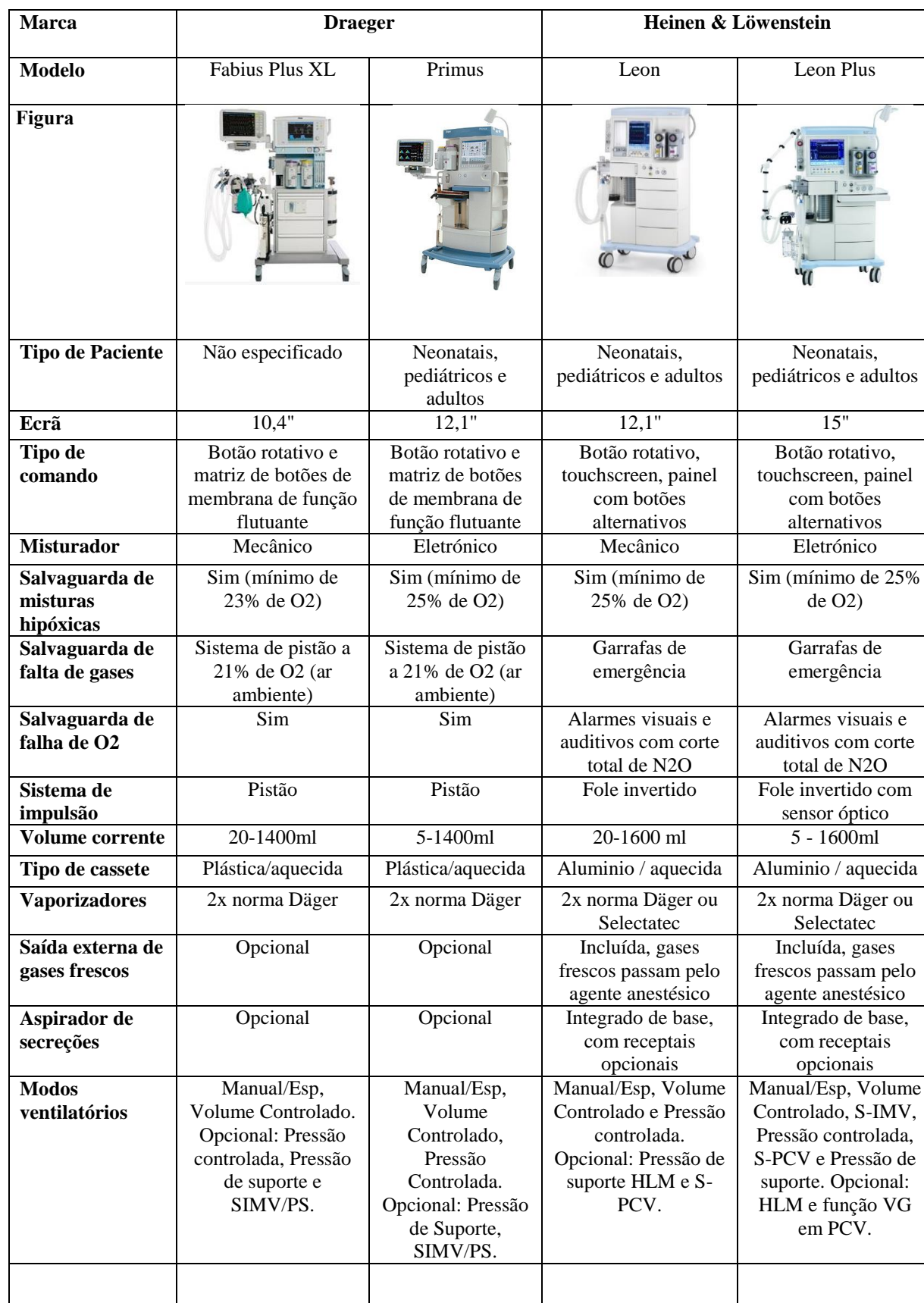
Tabela 2 - Tabela comparativa entre sistemas de anestesia Heinen e Draeger