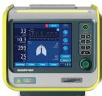
Figura 11 - Ventilador MR1 (retirado de catálogo Hamilton)

Por último, dentro desta plataforma existe ainda o modelo MR1 (Figura 11). Este partilha exatamente o mesmo funcionamento de um C1 ou de um T1 adicionando ainda compatibilidade com utilização em ressonância magnética.