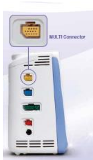
Figura 22 - Tecnologia SmartCable (retirado do catálogo da Nihon Kohden)

As entradas “ multiconnector ” são multi-parâmetros, “ plug-and-play ” e transversais à gama.