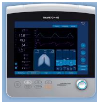
Figura 13 – Ventilador G5 (retirado de catálogo Hamilton)

De referir ainda que todos os modelos apresentados e que fazem parte do portefólio da Hamilton têm em comum três características que os distinguem de todos os outros existentes no mercado. Estas três características são: