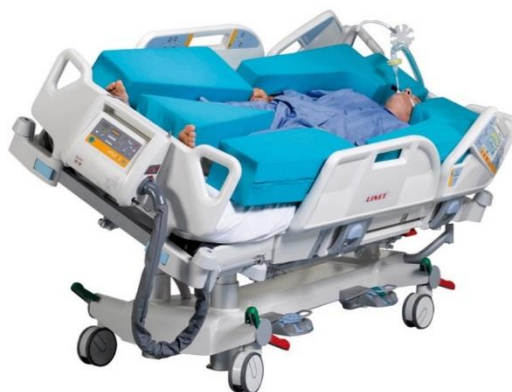
Figura 32 - Cama Multicare

A Linet diferencia-se pela robustez e tecnologia utilizadas. Como por exemplo a solução Multicare (Figura 32) da UCI é a única cama capaz de lateralizar automaticamente, transferir dados para a rede informática.