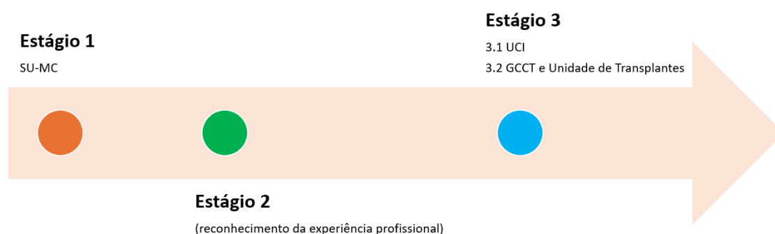
Figura 2: diferentes contextos clínicos do ciclo formativo

O percurso de desenvolvimento de competências decorreu em contextos distintos, complementares entre si e fundamentais para a consolidação da prática especializada em EMC-PSC (figura 2). A diversidade destes cenários clínicos permitiu integrar diferentes realidades assistenciais, organizacionais e relacionais, favorecendo uma compreensão holística da complexidade inerente ao cuidado da pessoa em situação crítica.