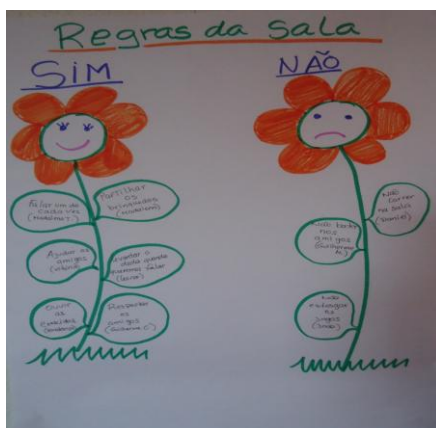
Figura 4: Regras da sala realizadas pelo grupo

Nesta atividade a área que se pretendeu trabalhar foi a Área da Formação Pessoal e Social, onde todos os meninos puderam participar, dando a vez aos colegas, respeitando as ideias de cada um. De seguida, a fotografia das nossas regras, que todos tentam cumprir.