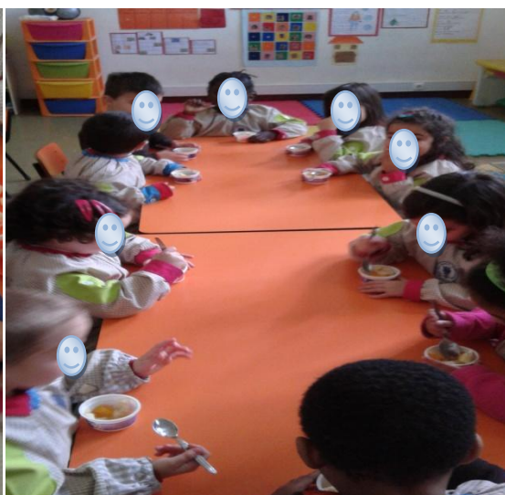
Figura 2: As Crianças deliciam-se com a salada de frutas