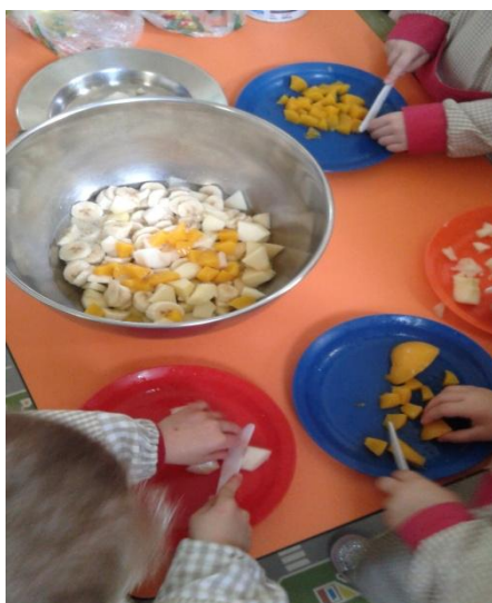
Figura 1: As Crianças ajudam a cortar a fruta para a salada

De seguida podemos observar algumas fotografias desta atividade.