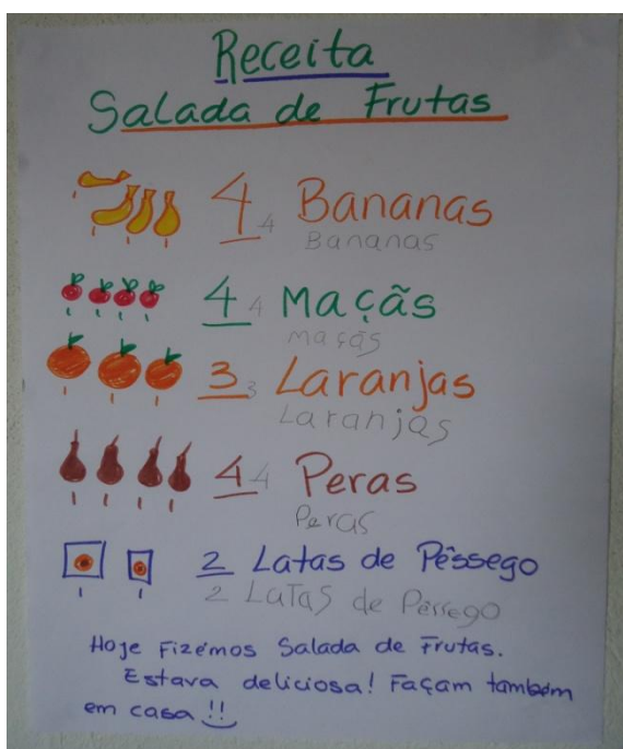
Figura 3: As crianças ajudam a escrever a receita