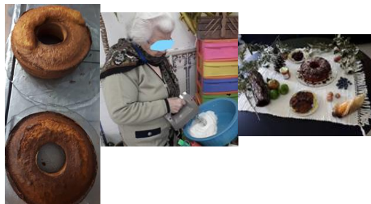
Imagem 16, 17 e 18 – os bolos tradicionais; Confeção dos bolos tradicionais; Decoração da mesa.