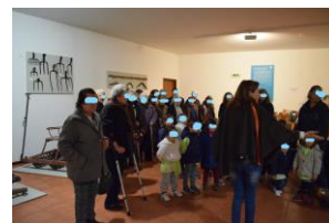
Imagens 32, 33 e 34 – Fotos da chegada ao museu e visita ao seu interior.