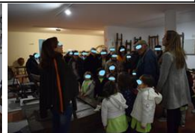
Imagens 35, 36 e 37 – Visita ao interior do museu Dr. Louzã Henriques.