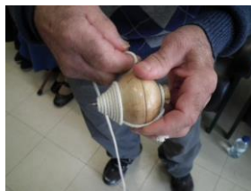
Imagem 19- idoso explica como enrolar o cordel no pião