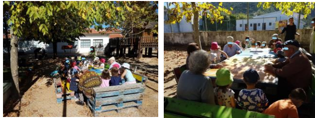
Imagem 7 e 8 – Fotos no JI onde idosos e crianças falaram sobre a história “Os meus avós são especiais” e a disposição em que ficaram na mesa do espaço exterior do JI