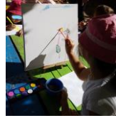
Imagem 11 e 12 – crianças e idosos demonstram os seus trabalhos. De um lado uma criança faz mais um elemento na tela, do outro um idoso o mostra o desenho que fez do seu neto a jogar ao berlinde.