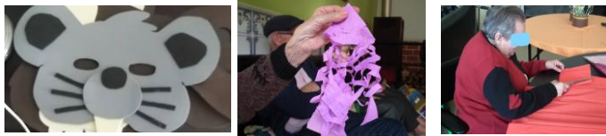
Imagem 26, 27 e 28 – preparação de elementos do cenário para a dramatização “A história da Carochinha e do João Ratão”