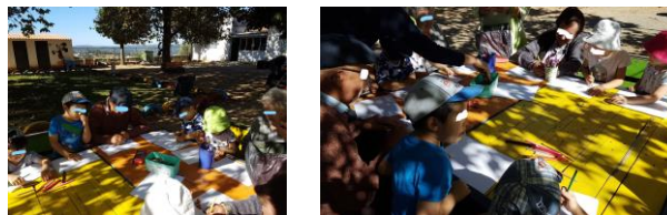
Imagem 9 e 10 – atividade de pintura no exterior do JI. Crianças e idosos desenharam e pintaram as atividades que mais gostam de fazer com os avós (crianças) e netos (idosos).