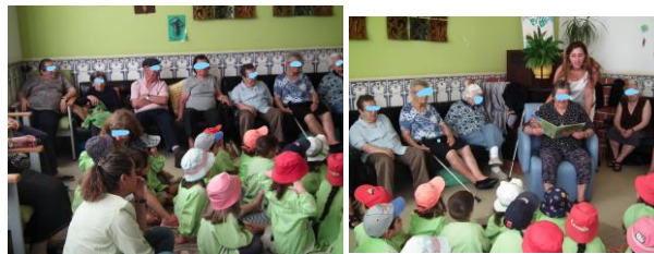
Imagem 5 e 6 – Conto da história “Os meus avós são especiais”

Imagem 3 e 4 - Chegada das crianças ao CD para assistirem ao conto da história “Os meus avós são Especiais”. O Sr. J. cantava as “pombinhas da Catrina” acompanhado com a sua pandeireta. Foi assim que as crianças foram recebidas.