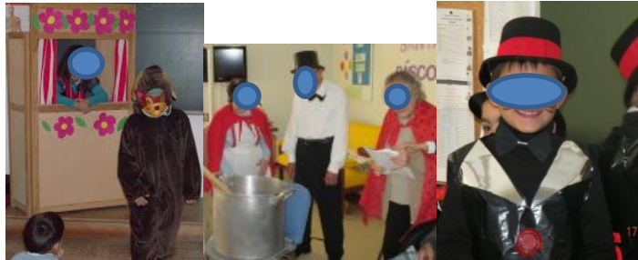
Imagens 29, 30 e 31 - O Teatro “A Carochinha e o João Ratão”.