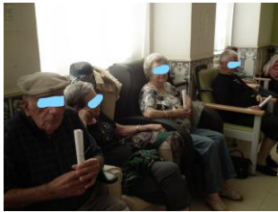
Imagem 15 - Cada participante levou para casa o desenho feito pelas crianças na atividade de pintura.

Imagem 13 e 14 – Telas pintadas pelas crianças e idosos. Cada valência, CD e JI, ofereceram para expor nas salas a recordação das pinturas.