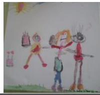
Imagem 13 e 14 – Telas pintadas pelas crianças e idosos. Cada valência, CD e JI, ofereceram para expor nas salas a recordação das pinturas.