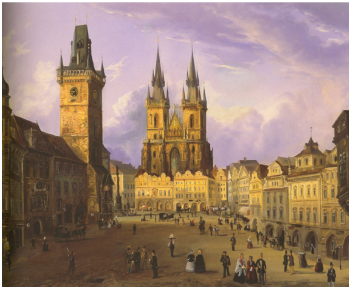
Praga em 1853 | Pintura de Ferdinand Leprieu