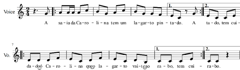
Imagen 4 - Transcripción propia. A saia da Carolina - 2