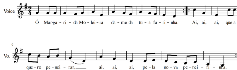
Imagen 5 - Transcripción propia. Margarida Moleira - 1