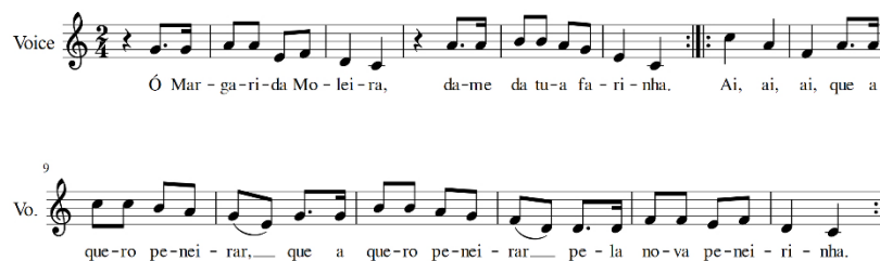
Imagen 6 - Transcripción propia. Margarida Moleira - 2