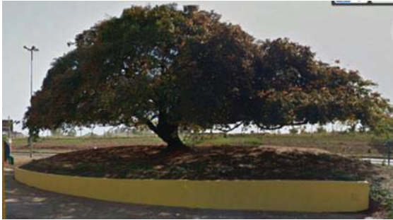
Figura 10: Muro de delimitação da árvore. 8

Não há proposta de uso como um assento útil; o tamanho, cor ou acabamento não lhe confere design; não há tratamento do solo, apenas terra sem vegetação envolta da árvore signo;