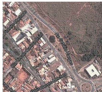
Figura 2: Mapa Físico Real 3D - Avenida Getúlio Vargas - Praça Da Copaíba. 4