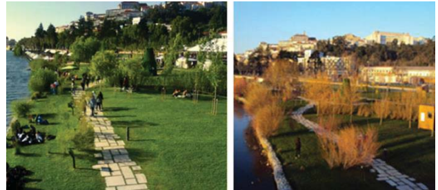
Figura 14: Parque verde do Mondego (Parque do Urso) aspectos na primavera (dir.); aspecto no outono (esq.). Fontes: Aime Reis- www.clarian.com (2013); Fonte: Xenia -Print Screen (2005)