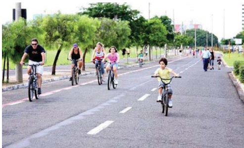
Figura 6: Av. Getúlio Vargas copaíba ao fundo, com a interdição de automóveis para recreação de domingo.

Sendo assim, em dias pré-determinados, a Praça é utilizada em conjunto com uma das pistas da Avenida. A iniciativa da Secretaria de Cultura em liberar a via expressa da Av. Getúlio Vargas, em uma das mãos, para o lazer e a utilização de pedestres, crianças, bicicletas e animais aos fins de semana favorece em todos os aspectos a Praça da Copaíba, aumenta a interação e converte a área da Praça numa estrutura de uso para o lazer, já que a mesma se situa no canteiro central da Avenida.