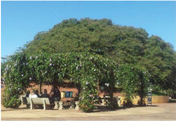
Figura 5: Pergolado no entorno da copaíba, com vegetação repleta e consolidada.

6. Projetos Culturais: a Secretaria de Cultura tem promovido e possibilitado a utilização da praça integrada ao espaço da avenida (com a interdição de carros em uma das pistas) durante fins de semana, feriados e datas determinadas conforme [12].