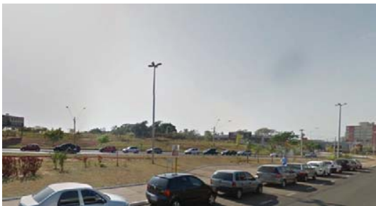
Figura 11: Postes de Iluminação da Praça. 9

9. Iluminação: a iluminação da árvore é inadequada, de fraco design, possuindo excesso de mecanismos aparentes (antifurto), grades e cadeados que causam ruído visual e prejudicam o efeito noturno do local;