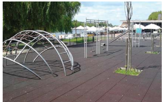
Figura 15: Parque verde do Mondego (Parque do Urso). 12