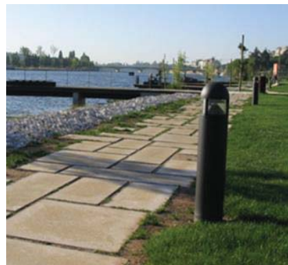
Figura 16: iluminação do percurso do Parque do Mondego por balizadores com proteção antifurto e design adequado. 13