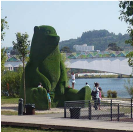
Figura 13: Urso do Parque verde do Mondego. Fonte: DZP 'Coimbricidades' (2005) 11