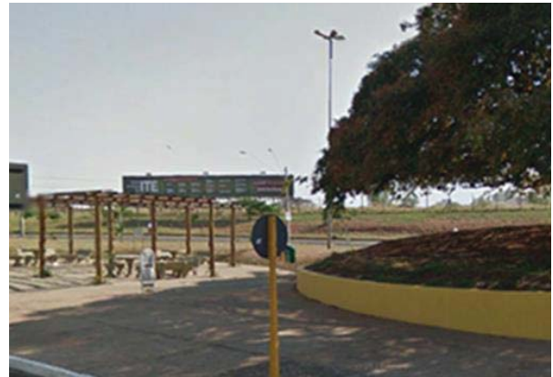
Figura 4: Pergolado no entorno da Copaíba, sem vegetação. 7