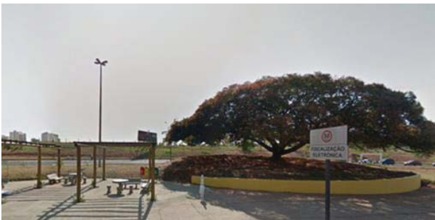
Figura 3: Foto detalhe da Copaíba, Av. Getúlio Vargas, número 3708. Bauru, SP. 6