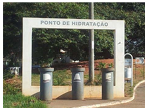
Figura 9: Ponto de hidratação DAE, com lixeira próxima.

O Departamento de Água e Esgotos de Bauru – DAE –, conforme [12], disponibilizou um “ponto de hidratação”. No entanto, o design dos bebedouros não é adequado ao perfil do local. O formato dos tubos de drenagem dos bebedouros remonta a uma concepção que coloca em causa a higiene. Há uma associação negativa de soluções nos sistemas de água e esgoto.