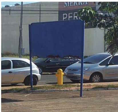
Figura 8: Placas e sinalização da Praça deterioradas.

6. Sinalização: a sinalização de trânsito e de segurança é excessiva e mal distribuída, com ergonomia e estética insatisfatória; a placa da academia, como citado, está mal localizada e apagada, além de estar deteriorada, gerando risco aos usuários; não há sinalização de percurso porque não há percurso definido e demarcado que possa ser identificado;