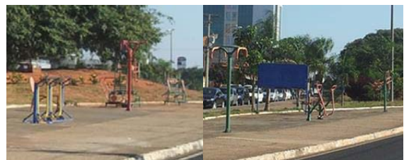
Figura 7: (a) Academia ao ar livre estação 1- (b) Academia ar livre estação 2; aparelhos sem padrão de cor.

4. Lazer: os aparelhos de ginástica da academia ao ar livre apresentam-se em duas estações distintas, próximas à avenida, oferecendo risco;