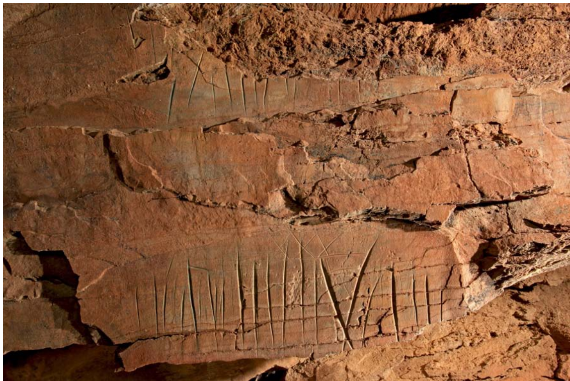
Fig.5. Conjunto de grabados lineales profundamente abrasionados en una roca del Arroyo de las Almas.