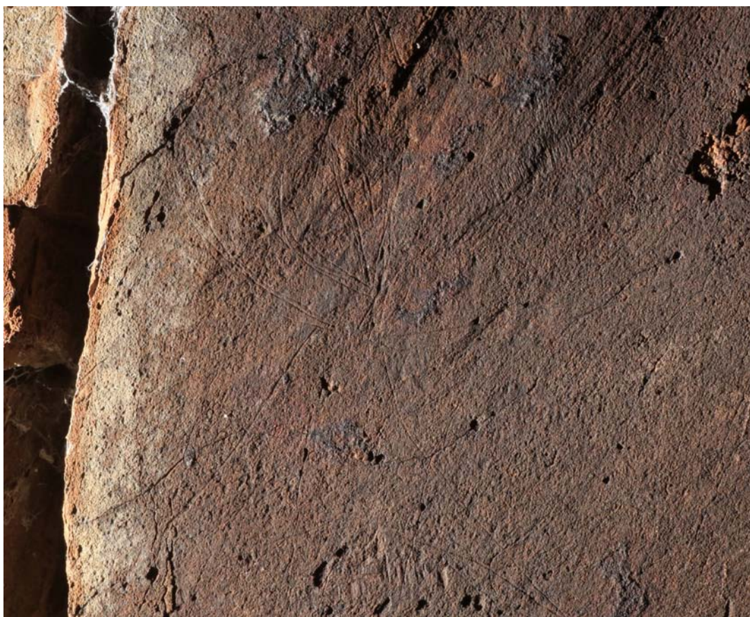
Fig. 7. Otra roca en el Arroyo de las Almas. Detalle de la cabeza y de las astas de un ciervo paleolítico. (de Hoyos 2013: 934)