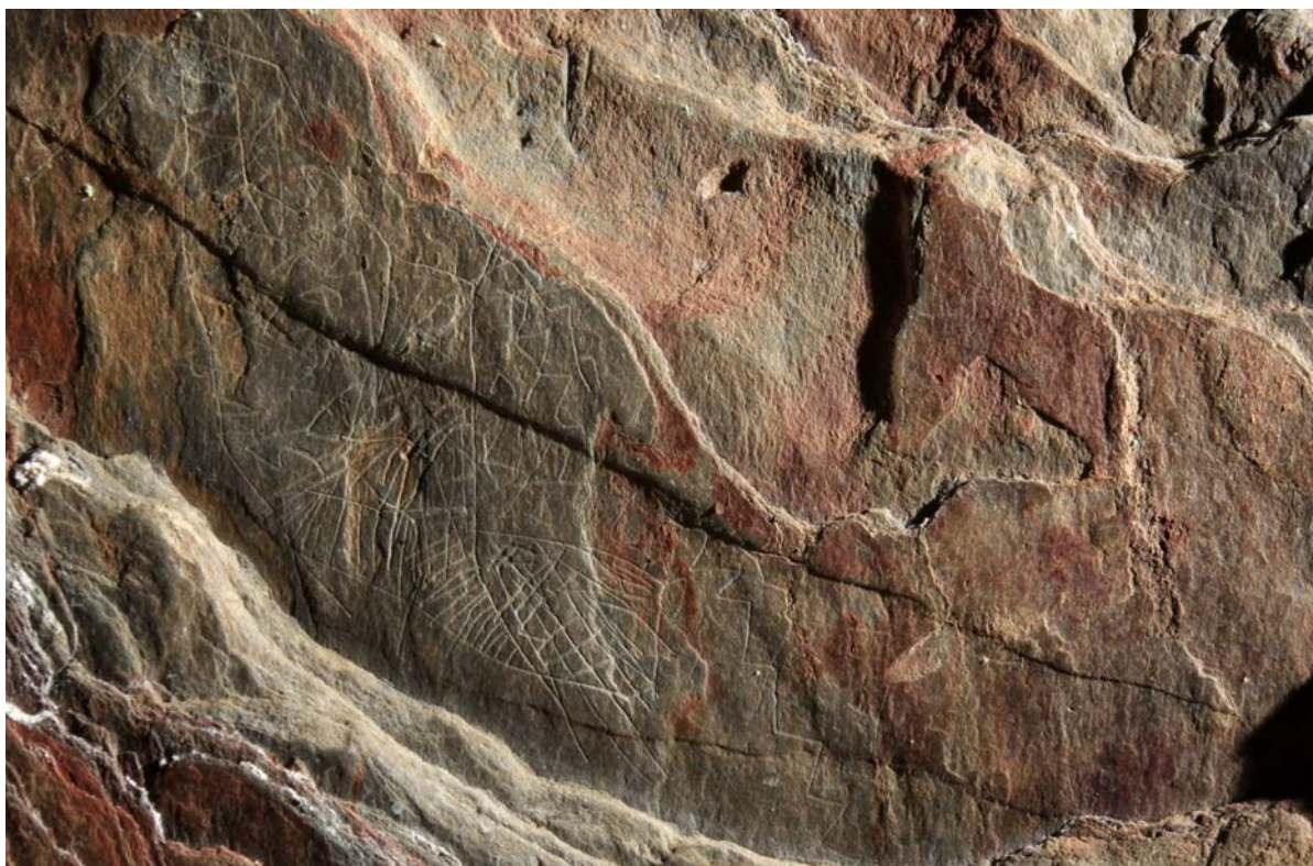
Fig.2. Detalle de algunos de los motivos abstractos grabados en uno de los paneles del abrigo de La Rivera de Sexmiro.

En una pared lateral del abrigo, y distribuidos en varios y pequeños paneles, concurren diversos motivos abstractos grabados, hechos con finas incisiones, habiéndose detectado una única inscripción, la letra "A", escrita en cursiva. En un primer análisis, parece existir una robusta analogía con el