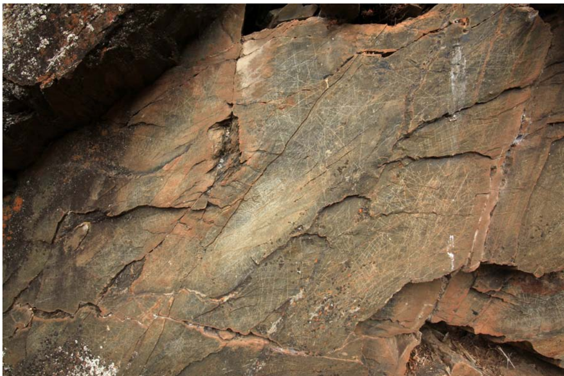
Fig.3– Denso conjunto de motivos grabados de cronología histórica en una roca del Arroyo de las Almas. Es difícil distinguirlos en la imagen, sin embargo el panel posee motivos zoomorfos, antropomorfos y abstractos.

afirmar que es ya, sin duda, un sitio con arte rupestre muy importante en el contexto peninsular. Por ahora, sólo hemos realizado incursiones exploratorias, encontrándonos algo más de media docena de rocas grabadas en al menos tres lugares diferentes en torno al arroyo. Todas cuentan con grabados finamente incisos, conservando una de ellas numerosos trazos lineales profundamente. La cronología de los distintos motivos ya identificados es inusualmente amplia, desde el Paleolítico Superior a la Edad Media, Moderna, Contemporánea y Actual, a través de la Edad del Hierro y probablemente la Prehistoria Reciente. Por el momento, carecemos de un inventario y ordenación numérica de las rocas conocidas. En parte, porque la futura exploración más intensa, que llevaremos a cabo, nos proporcionará más descubrimientos teniendo en cuenta lo ya revelado, y los muchos afloramientos