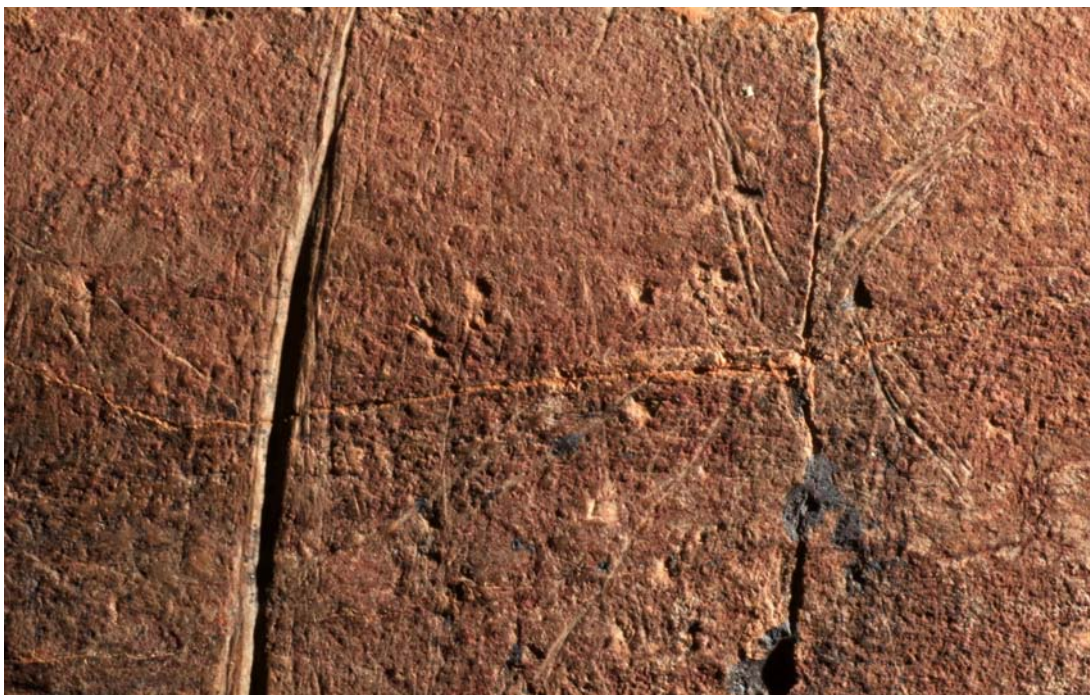
Fig. 6. En la misma roca de los grabados anteriores. Detalle de la cabeza de una posible cabra paleolítica.