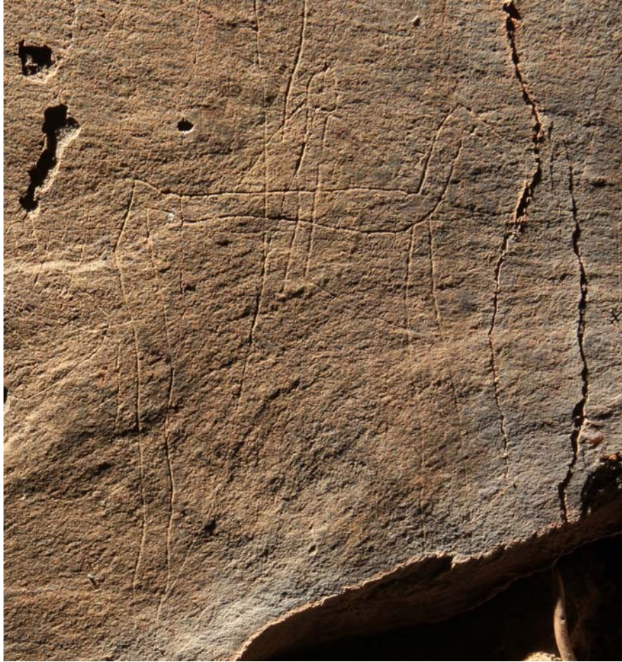
Fig.4. – Un jinete de la Edad del Hierro, asociado a numerosos motivos, en una de las rocas del sitio del Arroyo de las Almas.