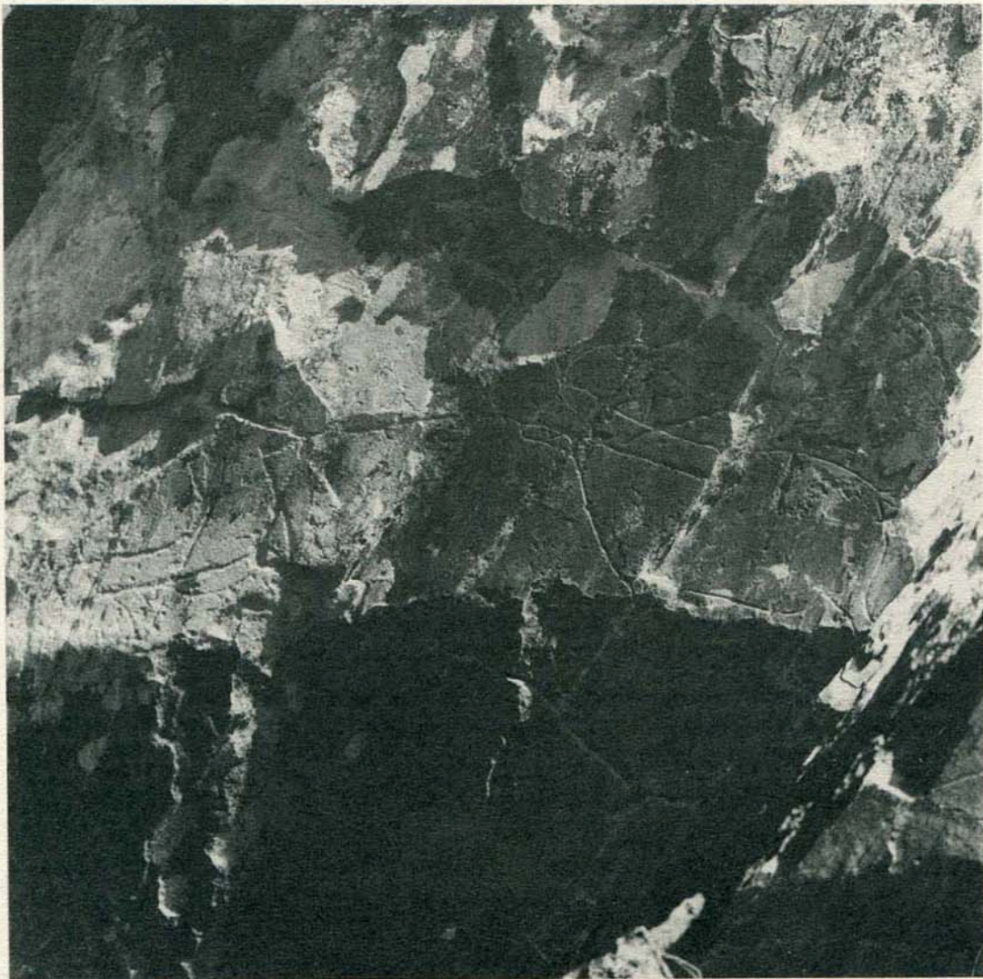
Figuras de animais, entre os quais um cabrito montês, gravados em xisto, no sítio da Penascosa.