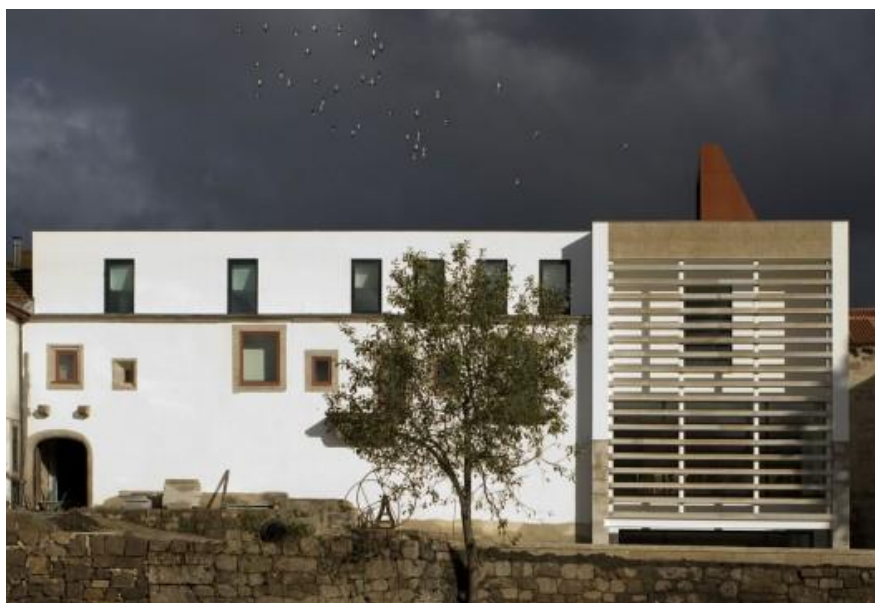
Figura 3 – Conservatório Regional de Música de Vila Real.

O Meio (M) para a concretização deste trabalho insere-se no Conservatório Superior de Música de Gaia por meio de um protocolo de Estágio Supervisionado no Conservatório Regional de Música de Vila Real no enquadramento do Mestrado em Ensino de Música – Especialidade Canto.