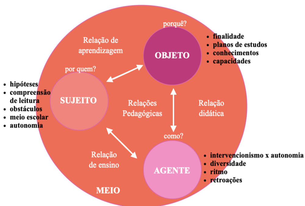
Figura 2 - Modelo de Relação Pedagógica (RP) Fonte - Legendre (2005)

O modelo de Relação Pedagógica é um modelo preconizado pelo investigador canadiano Renald Legendre (1993; 2005). Este investigador escolheu este modelo porque no seu entender, é um modelo que contém todas as dimensões necessárias para o desenvolvimento de estudos científicos de Investigação - Ação, possíveis de serem aplicados a situações pedagógicas concretas, no campo das ciências da educação.