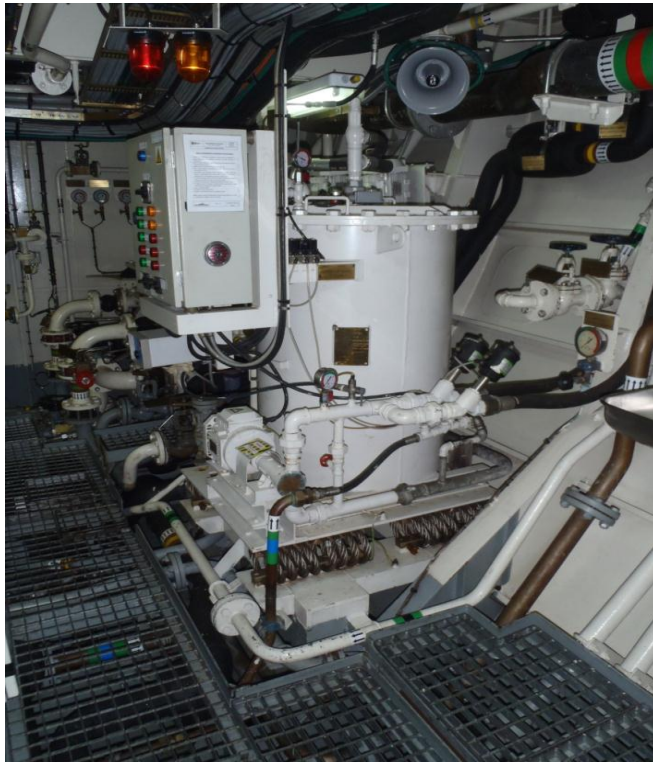
Figura 3 - Separador de águas oleosas