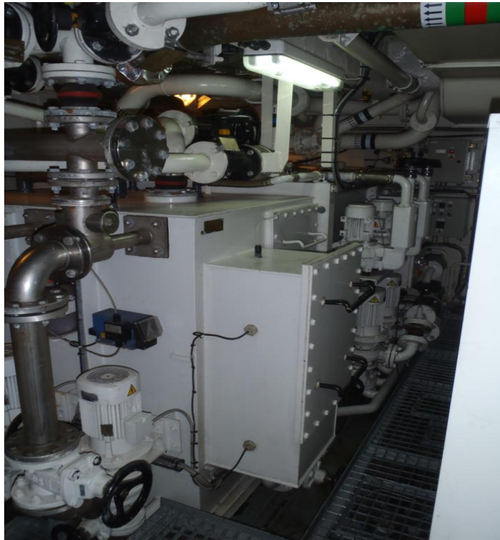
Figura 4 - Estação de tratamento de águas residuais