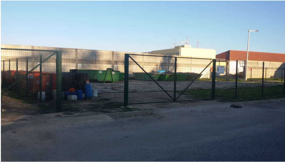
Figura 7 - Ilha ecológica