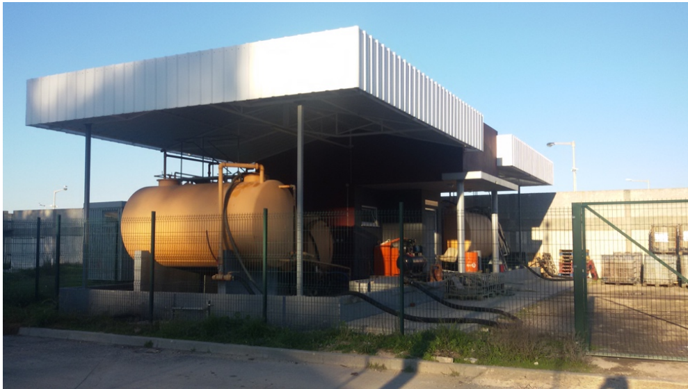
Figura 6 - Estação de Tratamento de Águas Oleosas

No que concerne às águas residuais, a BNL não dispõe de um sistema de esgoto fixo que permita a ligação dos navios, quando atracados, ao coletor municipal. No caso da CLBDias, dado disporem a bordo capacidade de bombagem desse mesmo efluente, existe uma ligação dedicada nos cais nº1, 2, 3 e 8 que permite a realização dessa drenagem. Nos outros cais o despejo é efetuado na baía do Alfeite ( ibid ).