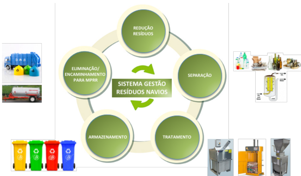
Figura 5 - Sistema de Gestão de Resíduos nos Navios