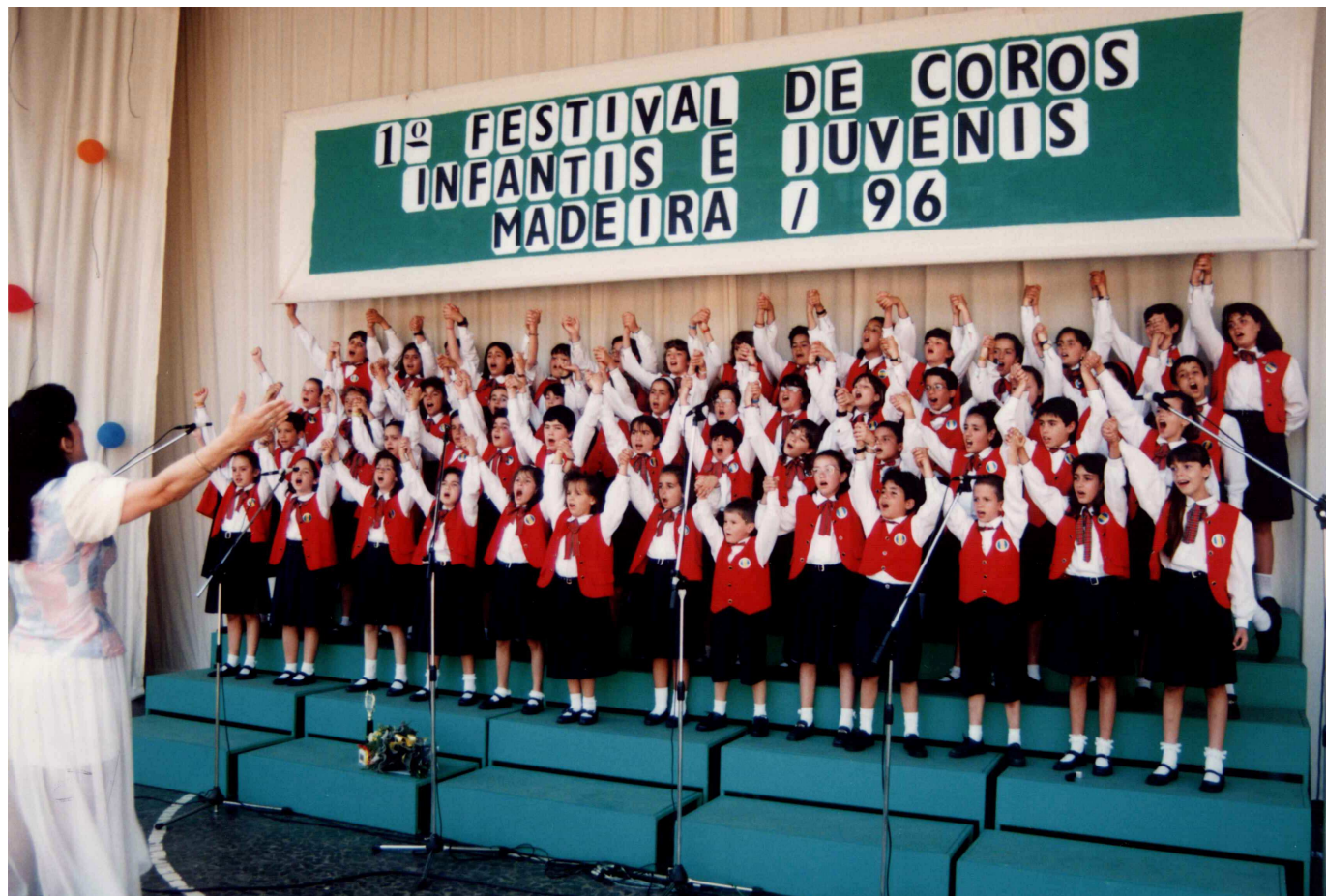
Figura 10 - Foto do 1º Encontro de Coros Infantis e Juvenis da Madeira