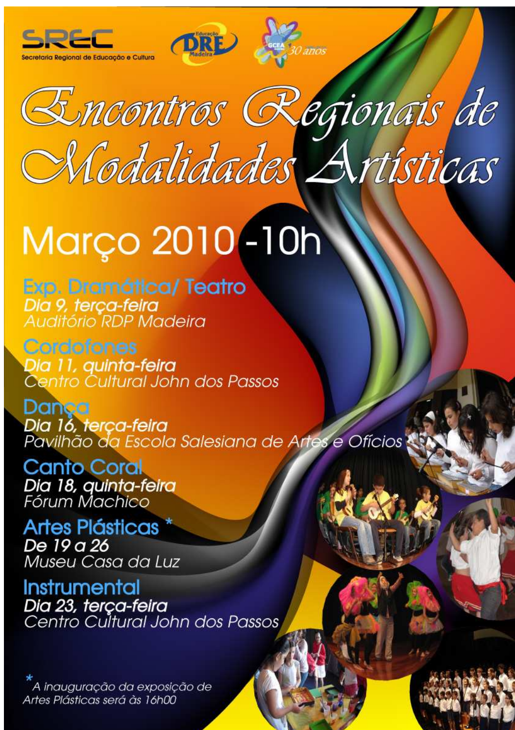
Figura 12 (doc.3) – Cartaz da 6ª edição do Encontro Regional da Modalidade Artística de Canto Coral/2010