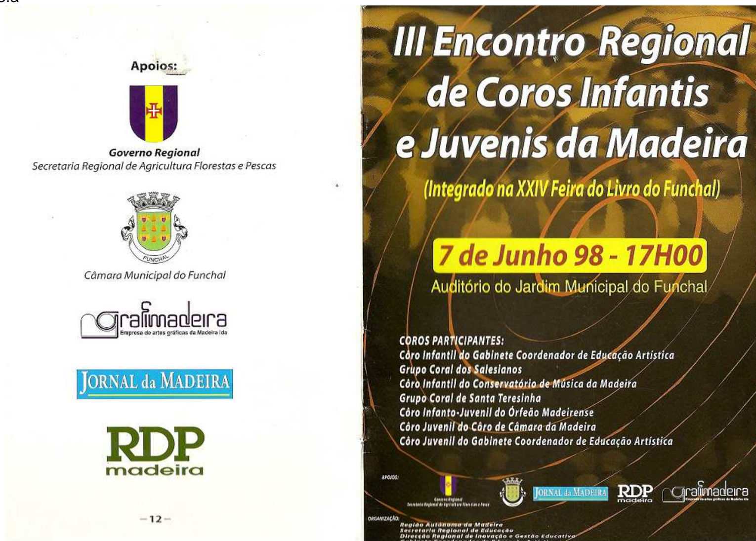
Figura 11 (doc.1) – Panfleto e programa do IIIº Encontro Regional de Coros Infantis e Juvenis da Madeira (1998)