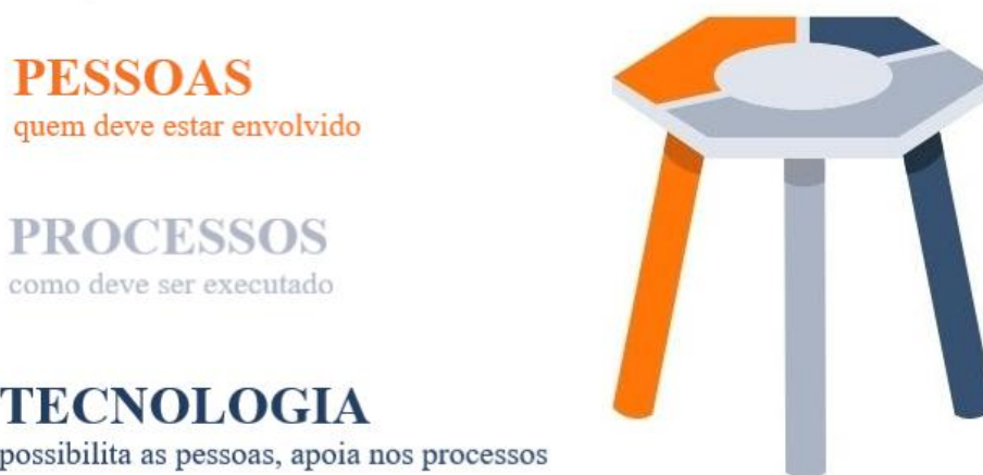
Figura 1 – Pessoas, processos e tecnologia

A abordagem entendida como mais adequada para analisar este conceito emergente, com a devida contextualização nacional, foi a perspectiva organizacional assente em três pilares fundamentais: pessoas, processos e tecnologia (J. N. Vicente, entrevista por email, dezembro de 2021). Com base nessa premissa, a análise efetuada foi, por um lado, apoiada na análise de documentação disponível (fonte aberta), essencialmente com a visão dos EUA e, por outro lado, refletindo a perspectiva de especialistas na temática, dentro das FFAA.