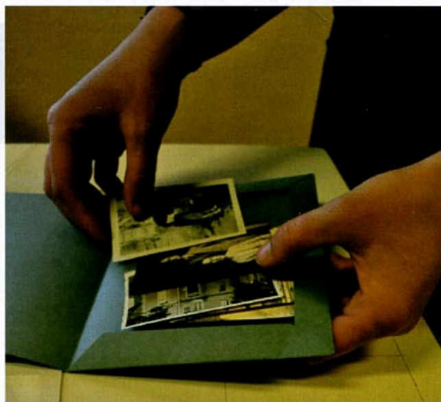
Figura 2 – Sessão de acondicionamento de fotografias antigas.