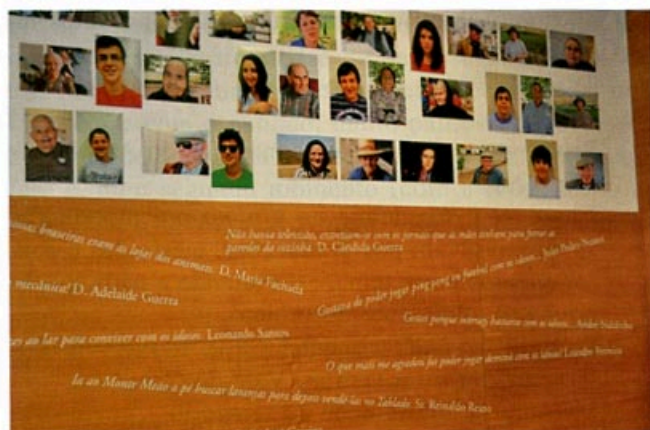
Figura 3 – Exposição do projecto-piloto no Centro Cultural de Vila Nova de Foz Coa (2011)