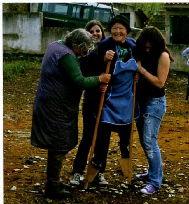
Figura 4 – Tarde de jogos tradicionais no Orgal.