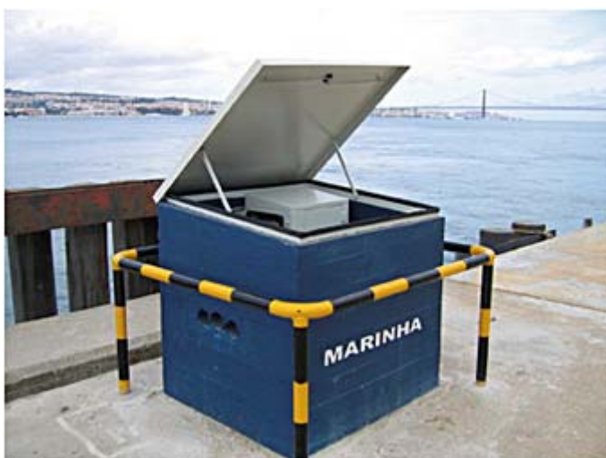
Um PAC tipo da segunda geração (Portinho da Costa).

A configuração dos equipamentos de bordo está feita de forma a não ser necessária qualquer acção da equipa de administração da RCM: o navio liga-se a qualquer um dos PAC's e, automaticamente, fica com acesso à RCM.