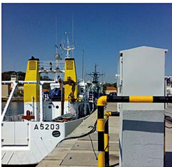
PAC "shelter" da primeira geração.

Assim, numa primeira fase, na sequência da criação da infra-estrutura de fibra óptica em edificação na área da BNL (Estação Naval), foram construídos 37 PAC's, dotando todos os cais com Pontos de Acesso e permitindo que, finalmente, os navios atracados na BNL tenham, através da MAN Alfeite, acesso aos mesmos serviços de rede disponíveis para as unidades em terra.