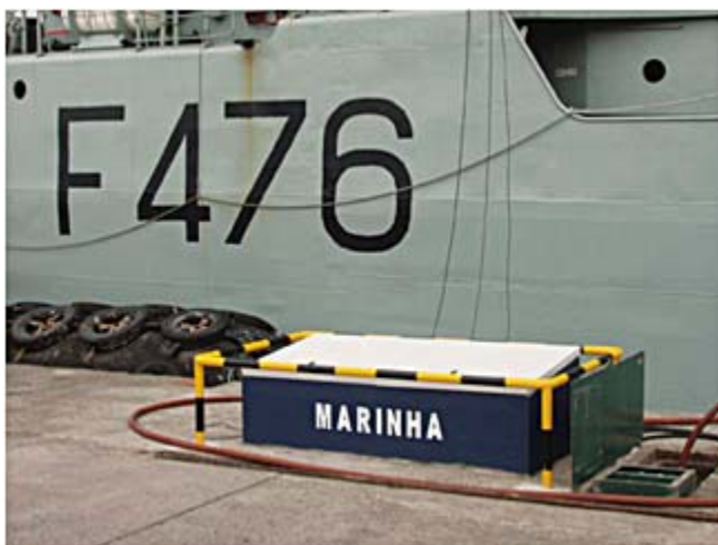
A corveta NRP "Jacinto Cândido" em comissão na ZMA atracada em Ponta Delgada e ligada ao IN-PORT.

Em operações navais a ligação de sistemas de comando e controlo entre navios e entre estes e os seus Comandos Operacionais é assegurada através de sistemas de radiocomunicações.