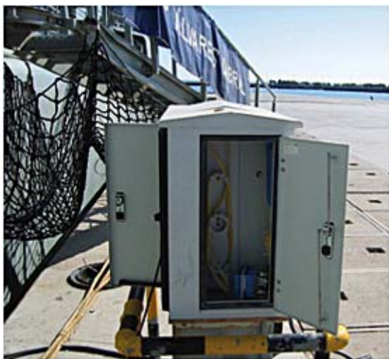
Pormenor de um PAC da BNL onde se podem ver os 2 compartimentos: um onde o navio liga o umbilical e o outro a área técnica.

Esta declaração foi notada em Dezembro desse ano pelo Comité de Infra-estruturas da NATO com o grau de “minimal warning” o que era uma indicação de boas perspectivas para a participação daquela organização.