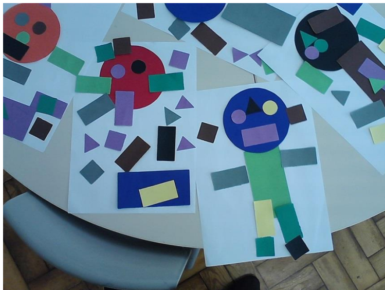
Figura 3- 3ª atividade

perceptíveis, inclusive algumas crianças já acrescentavam pormenores do dia a dia, como a relva, por exemplo. É possível perceber este resultado pela imagem que se encontra em baixo e nas imagens que se encontram em anexo. (ANEXO I). Colocou-se em anexo também os relatórios diários destas duas sessões de intervenção. (ANEXO J).