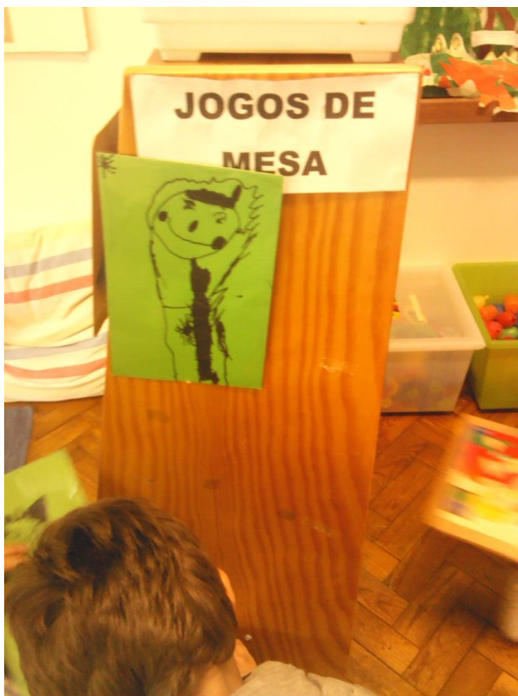
Figura 1- 1ª atividade

trabalhar outras áreas, como a Expressão Plástica, Matemática e Conhecimento do Mundo. Esta dinâmica foi trabalhada pelo menos uma vez por semana até ao final do estágio, onde se observou uma grande evolução no grupo. Inicialmente foi um pouco confuso para todos, e foi muito necessário o acompanhamento do adulto, aos poucos o grupo entrou na dinâmica e já realizavam as tarefas a que se tinham comprometido de forma autónoma, sem precisarem da ajuda do adulto. Houve algumas exceções, da parte de três crianças, que ainda precisavam do adulto. Esta atividade encontra-se descrita mais pormenorizadamente em anexo. (ANEXO F).