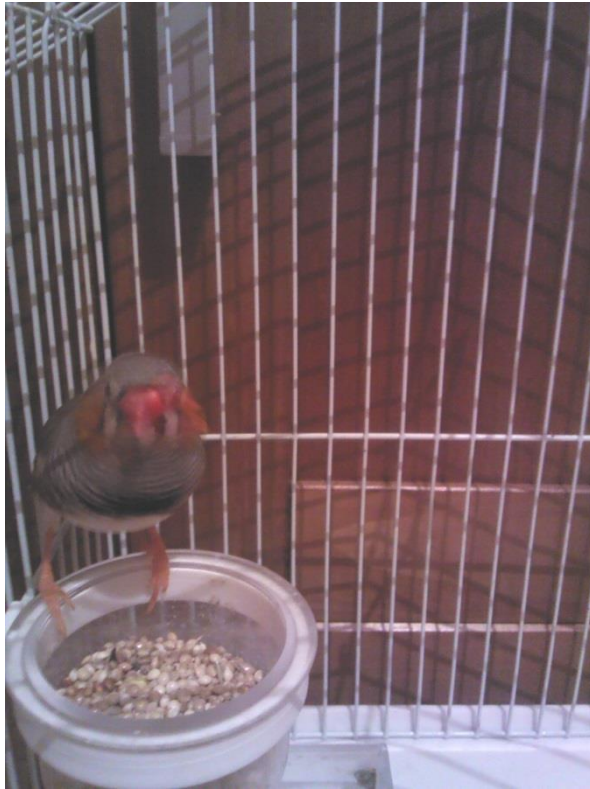
Figura 2- 2ª atividade