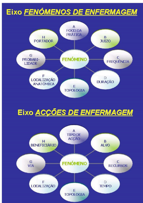
Fig. 1 - eixos da CIPE β2

Este modelo consiste num único eixo, constituído como o próprio nome indica por sete categorias de eixos ramificáveis (fig. 2)