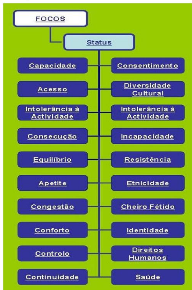
Fig. 3 - categoria de status

O eixo JUÍZO mantém-se da \beta 2 para a 1.0, aparecendo configurado com poucos termos e sem os anteriores graus reduzido, moderado, elevado e muito elevado. Servem para representar a opinião clínica ou o estado em que se encontra um determinado foco da prática de enfermagem e os seus termos encontram-se categorizados em dois níveis: 1) os termos que traduzem juízos positivos ou negativos (do tipo melhorado ou comprometido) e 2) os juízos que expressam o estado do foco da prática, como elevado ou diminuído, dependente ou independente. A possibilidade de um determinado foco da prática se manifestar associado à expressão "risco de" – anteriormente ligado ao eixo da probabilidade da versão \beta 2 , - surge agora como um termo do eixo do juízo da 1.0, associado à noção de potencialidade da categoria estado.