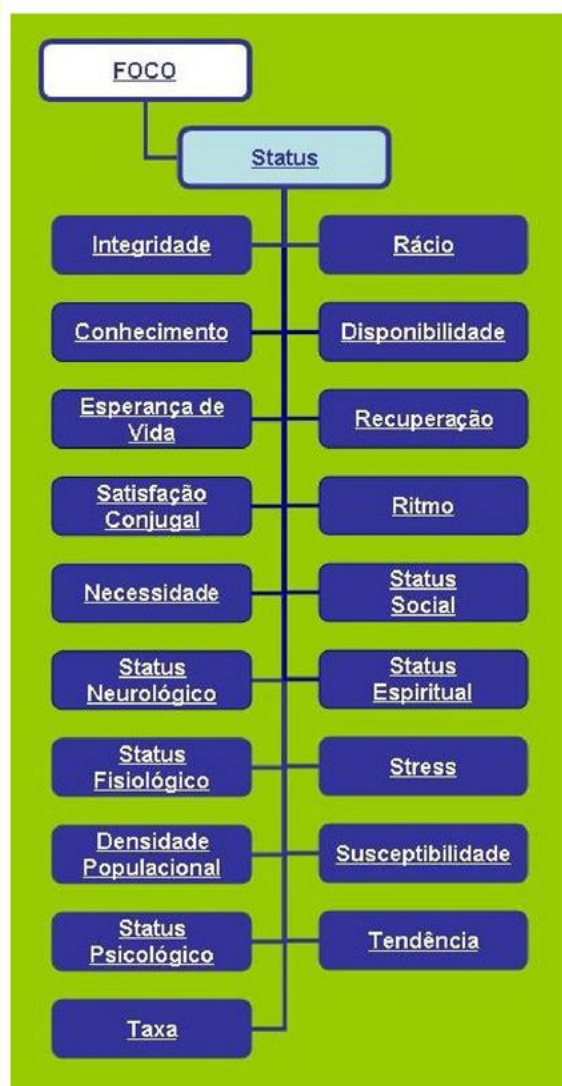
Fig. 4 - Categorias de Status

A forma de implementar uma determinada intervenção de enfermagem pode ser descrita recorrendo ao eixo RECURSOS, que na CIPE 1.0 integra seis categorias: 1) os artefactos ou dispositivos e instrumentos de diversa natureza (como são exemplo o resguardo, a prótese ocular, a roupa da cama, o campo cirúrgico, compressas, ligaduras, pente, grades da cama, brinquedo, humidificador, agulha, dreno, catéter, protocolo e regime medicamentoso); 2) os recursos humanos ou prestadores de cuidados , como enfermeiro, médico ou cirurgião; 3) os serviços do tipo serviço de planeamento familiar ou serviço de fisioterapia; 4) os materiais ou produtos utilizados na prestação de cuidados, como creme, medicamento ou solução; 5) as técnicas realizadas, como por exemplo a técnica de