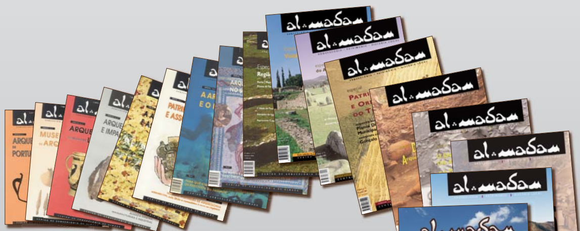
IIª Série (1992-...)