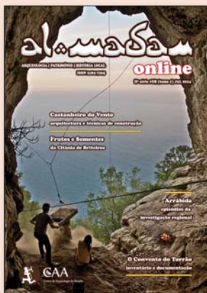
Capa | Jorge Raposo

Registo da escavação da Lapa da Cova, na Serra do Risco, em Sesimbra. Fotografia © Ricardo Soares.