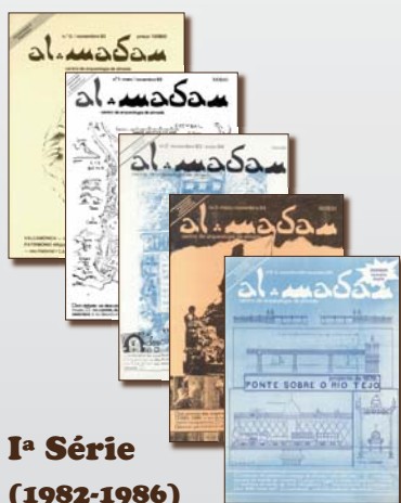
Iª Série (1982-1986)

toda a informação sobre as edições em papel à distância de alguns toques