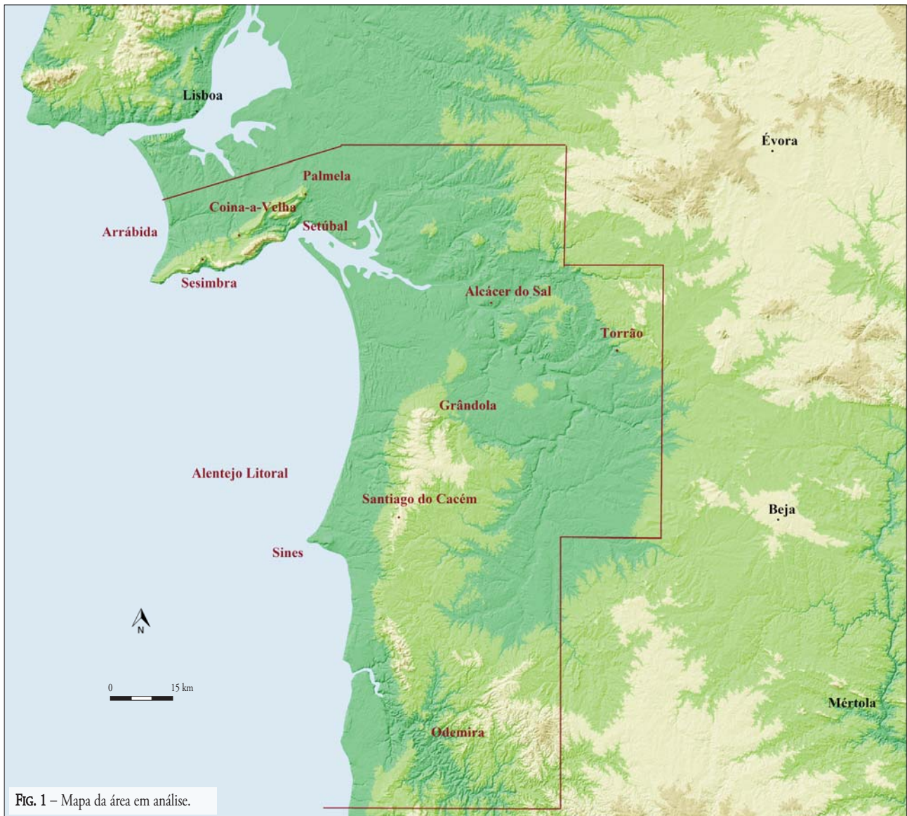
FIG. 1 – Mapa da área em análise.

– O horizonte cronológico analisado vai centrar-se no Período Islâmico. Contudo, sempre que justificado, serão indicados estudos alusivos às fases de fronteira, nomeadamente os referentes à etapa anterior à conquista Islâmica 3 , ou à inserção definitiva deste território no Reino de Portugal, no decurso do século XIII;