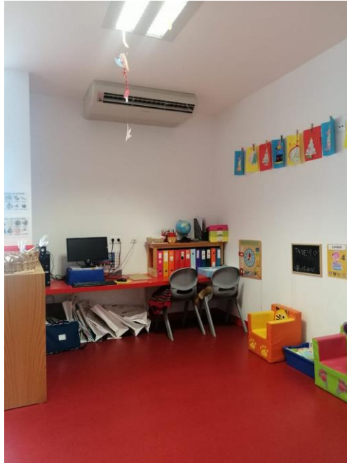
Figura 17 Área do computador e da biblioteca