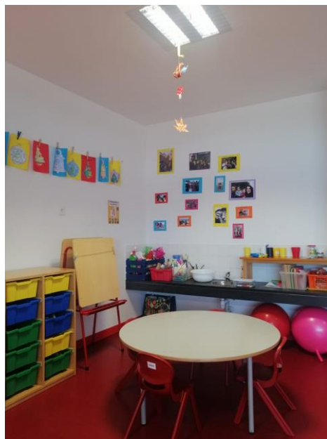
Figura 16 - Área da pintura