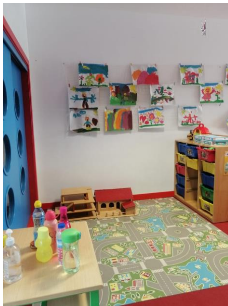
Figura 18 Área da garagem