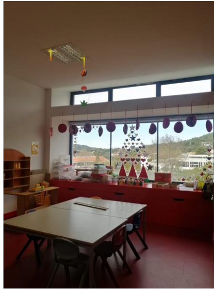
Figura 15- Área da cozinha e dos trabalhos manuais