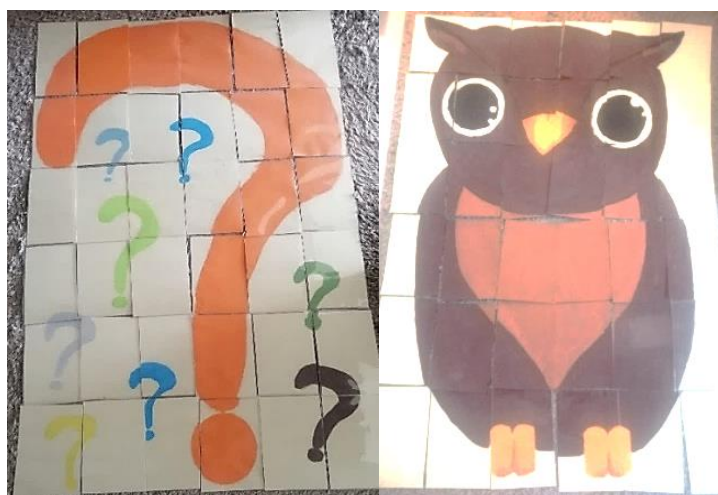
Puzzle ponto de interrogação e do mocho

Definimos como objetivos para esta atividade os seguintes: estimular a capacidade de escuta; estimular a construção do pensamento crítico; promover a interação entre o adulto e as crianças; alargar o vocabulário das crianças e apoiar as crianças nas suas opiniões;