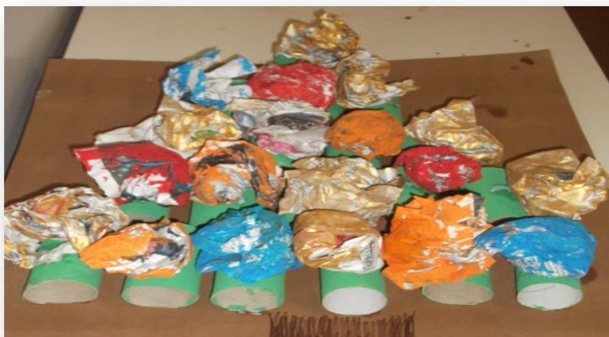
Figura 4 - Árvore de Natal realizada com material reciclável

Uma outra atividade relevante que fora realizada em contexto do 1ºCEB foi a concretização de uma Árvore de Natal produzida com materiais recicláveis: jornal e rolos de papel higiénico. A atividade consistiu em cada criança pintar um rolo de papel higiénico e realizar, com uma folha de jornal, uma bola e pintá-la com uma cor a seu gosto. No final formou-se a árvore e colocou-se em exposição para que toda a comunidade da escola pudesse observar o trabalho produzido pela turma (Anexo 6 – Planificação - dia 15 de dezembro).