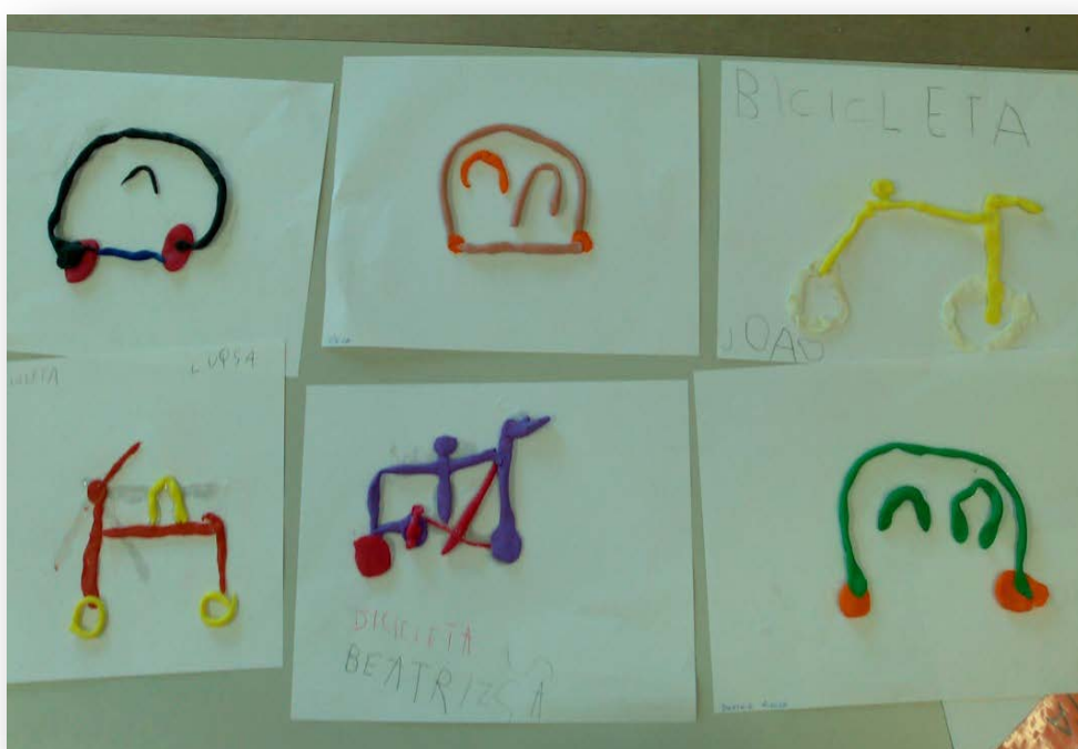
Figura 1 - Trabalhos realizados com plasticina - Meios de Transporte

Inicialmente abordámos o tema dialogando sobre os meios de transporte conhecidos pelas crianças e depois, para complementação e consolidação de conhecimentos, as crianças realizaram, com plasticina, um meio de transporte à sua escolha. O resultado foi o seguinte: