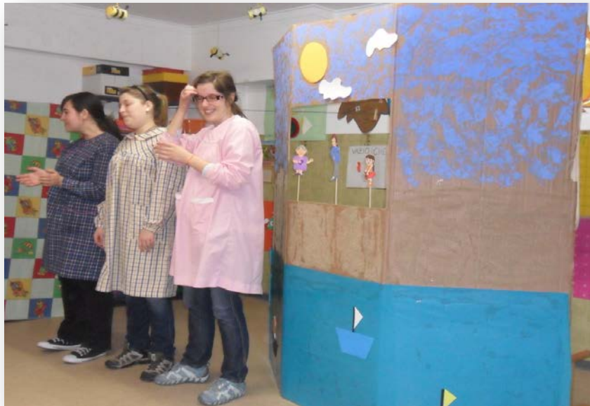
Figura 2 - Cenário e personagens do teatro sobre o Dia da Mãe