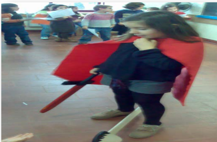
Figura 3- Dramatização sobre a Lenda de S. Martinho

de crianças foi a dramatização da Lenda de S. Martinho. A atividade consistiu em reunir um número de crianças para ler a Lenda, um número de crianças para incorporarem as personagens e crianças para fazerem de sol e de chuva. Notei um forte entusiasmo sentido pelas crianças, que depressa se mostraram disponíveis para concretizar qualquer papel (Anexo 5 – Planificação - dia 11 de novembro).