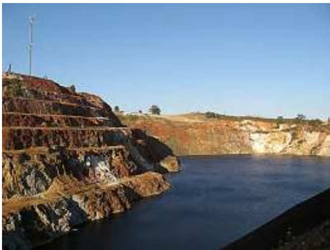
Figura 3. Exploração a céu aberto da Mina de São Domingos.

Os produtos desse comércio eram variadíssimos, desde alimentos de primeira necessidade até manufacturas de luxo. Das grandes e férteis planícies em volta de Beja e Serpa, chegava o cereal e, das minas de São Domingos e Aljustrel (a antiga Vipasca) metais da Faixa Piritosa ibérica (ouro, prata e cobre). No sentido inverso, vários produtos afluíam a Mértola, tanto das regiões vizinhas como do tráfego mediterrâneo. O foral outorgado pela Ordem de Santiago a Mértola em 1254 refere especificamente pão, vinho, madeira, carvão, alhos, cebolas, juncos, cortiça, madeira trabalhada e cerâmica (VEIGA, 1983). Porém, a chegada de cerâmica de luxo está documentada desde época pré-romana (ARRUDA, BARROS & LOPES, 1998).