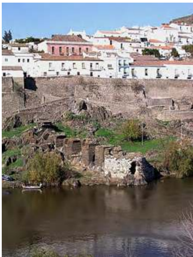
Figura 5. Torre do Rio.

Junto do troço norte da muralha da Vila Velha, localizou-se uma necrópole de incineração do século I d.C.. Nela, as cinzas dos defuntos eram depositadas em pequenas fossas, em alguns casos dentro de urnas funerárias de cerâmica ou vidro (LOPES, 2009). A partir do século III d.C. os rituais da morte mudaram e a inumação dos corpos substituiu a cremação. Estas práticas foram reformuladas com o triunfo do Cristianismo que deixara em Mértola