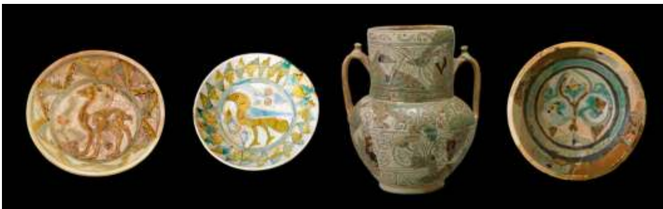
Figura 7. Conjunto de cerâmicas importadas do século XII.

lajeados, em tijoleira, ou também em argamassa pigmentada com óxido de ferro.