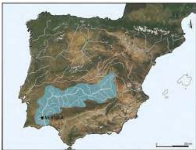
Figura 1. Bacia do Guadiana e localização de Mértola.

Uma confluência de factores faz do esporão rochoso onde se situa Mértola um local privilegiado de povoamento. A abundância de água, as condições defensivas, as facilidades de acesso e comunicação por via fluvial e a proximidade de recursos minerais proporcionaram-lhe uma posição incontornável. Assim, foi ambicionada por diferentes poderes políticos e frequentada por mercadores e viajantes das mais variadas proveniências.