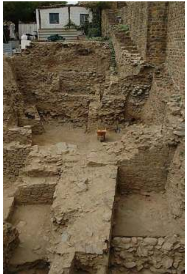
Figura 4. Sobreposição de muralhas nas escavações da Biblioteca Municipal de Mértola.

cumeadas dos montes vizinhos num perímetro aproximado de 4 km (HOURCADE, LOPES & LABARTHE, 2003). Até 1979 conservava-se uma das portas deste grande recinto localizada no Cerro do Furadouro. Desta época, conserva-se uma lápide gravada com a chamada “escrita do sudoeste”, um alfabeto local, numa língua pré-romana, que podemos datar, grosso modo, entre os séculos VII e V a.C. (FARIA, 1994). Nas escavações foram também encontrados objectos de influência grega e cartaginesa (BARROS, 2008), certamente fruto do comércio propiciado pela navegação fluvial, pois não há provas de uma presença política ou militar helénica ou púnica.