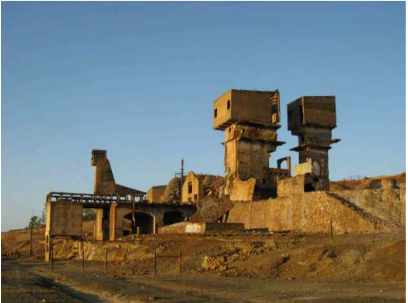
Figura 9. Ruínas das instalações da Mina de São Domingos.

do século XX, e foi abandonada em 1966 ficando apenas uma paisagem desolada de crateras e ruínas (Figura 9), fruto da exploração do minério a céu aberto e de instalações fabris a degradar-se (CUSTÓDIO, 1999).