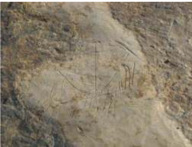
Figura 6. Barco gravado numa laje do Arrabalde Ribeirinho de Mértola.

Durante o califado, a cidade adquiriu um notável desenvolvimento que trouxe ao seu porto mercadorias de outros territórios do al-Andalus, especialmente da capital, Córdoba, e da cidade palatina criada pelo califa Abd al-Rahman III, Madinat al-Zahra. Por volta do ano 1020, Ibn Tayfur proclamou um reino de taifa independente em Mértola que não durou muito, sendo absorvido pela taifa sevilhana de Almutadid em 1044. Pouco mais tarde, o rei de Sevilha, al-Mutamid, nomeia o seu filho, al-Radique, como governador de Mértola até a chegada dos almorávidas na década de 80 do século XI (GÓMEZ, 2014).