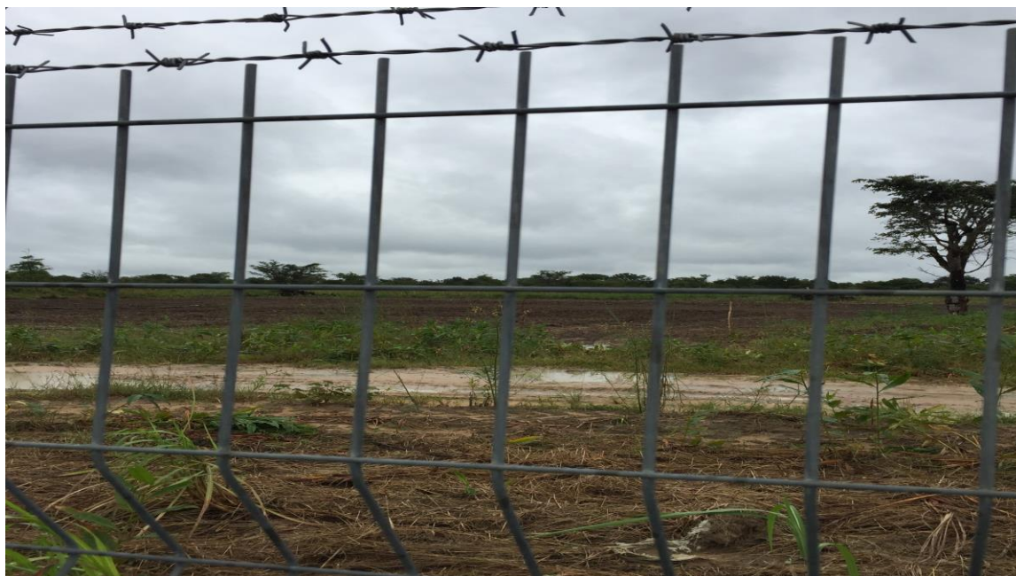
Figura nº 5. Terreno de aulas práticas de agricultura - Sacassanje. Foto tirada dia 15.03.2016, 12h00:44'.

No centro de Sacassanje nota-se como espaços exteriores, um átrio e um estacionamento, logo logo ao portão de acesso ao centro. O recinto é bastante enorme, cercado de uma vedação de arame de aço. À sua volta há um terreno que serve para aulas de prática de agricultura, como se pode ver na figura nº 5. Uma pocilga com criação de suíno anexo ao lado um espaço com criação de patos.