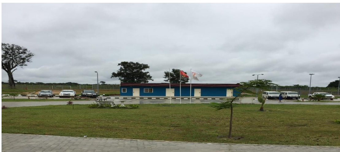
Figura 4: Bloco Administrativo Centro de Sacassanje - foto tirada no dia 15.03.2016

O Centro de Formação Integral Cidadela Jovens de Sucesso SACASSANGE Funciona em sistema de internato para os formadores, formandos e professores.