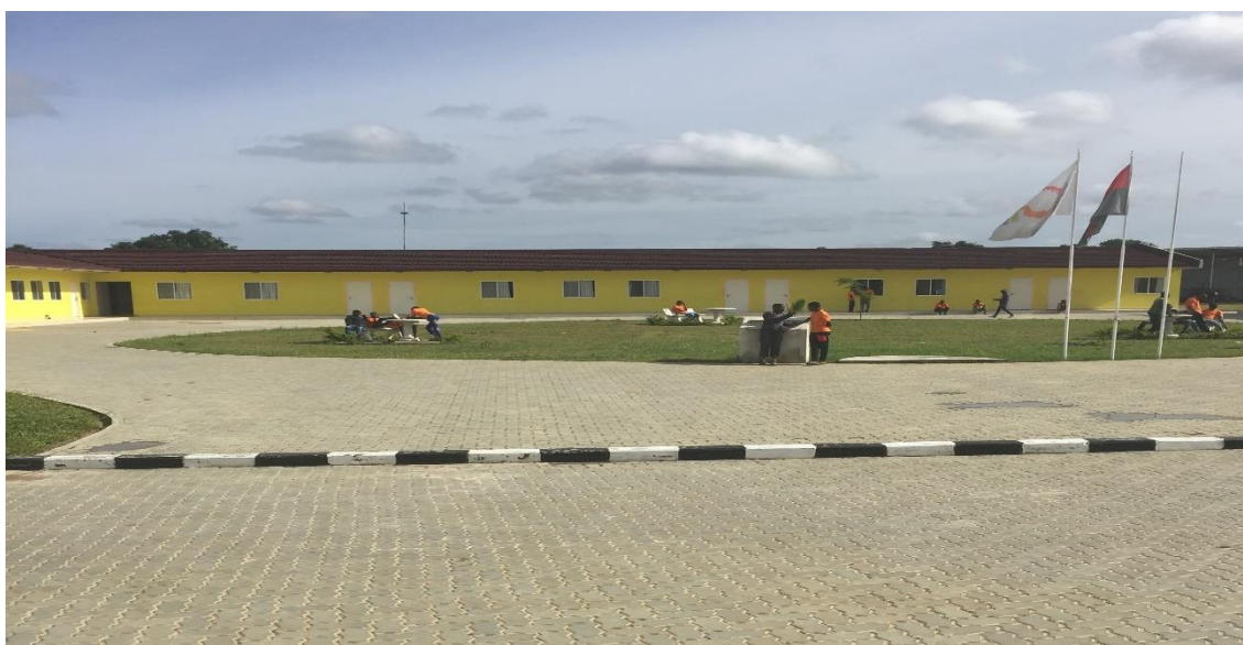
Figura 9: Bloco de Salas de Aula – Centro de Sacassanje.

A escola é entendida como lugar de mediação cultural privilegiada de educação em que se pode dar uma resposta sistemática às necessidades da idade evolutiva; uma instituição determinante na formação da personalidade, porque transmite uma concepção do mundo, do homem e da história; uma das formas mais importante da promoção humana e de prevenção da marginalização.