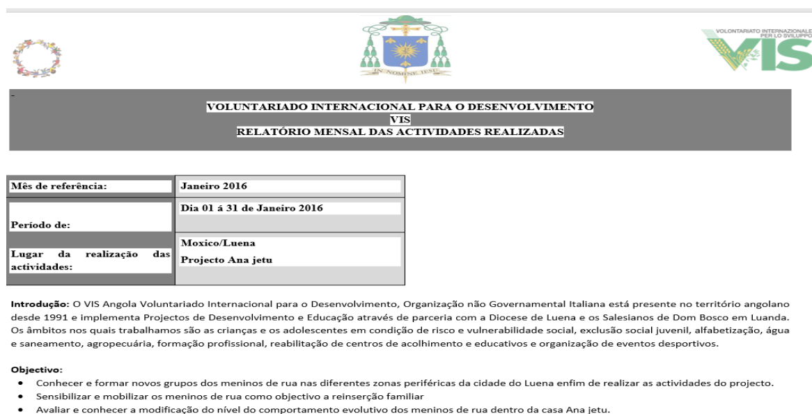
Figura nº 10: Objectivos do Centro Ana-Jetu – Lopes