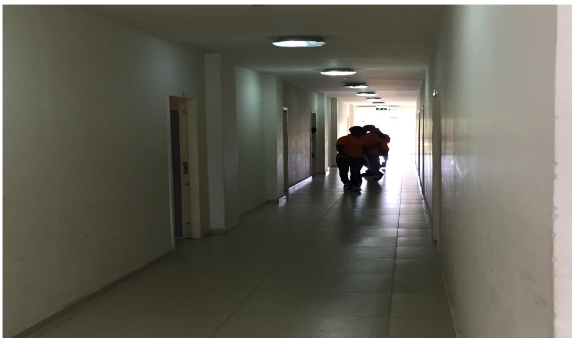
Figura nº 7: Corredor de dormitórios do Centro de Sacassanje.

Os dois blocos de dormitórios são idênticos no que diz respeito ao modo dos equipamentos colocados nos quartos. Uma sala de televisão para bloco do dormitório, um quarto à entrada do corredor para o “pai do lar”, que impõe o mecanismo de controlo na zona de dormir. Portanto, os dois blocos do dormitório para rapazes apresentam um conforto físico com características que proporcionam comodidade aos residentes, como se vê na figura nº 7 - um corredor de um dos dois blocos de dormir.