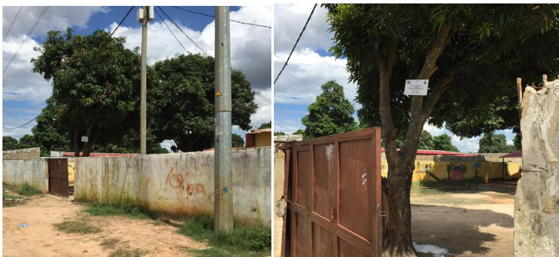
Figura nº 1: Portão do Centro de Acolhimento de Crianças, Ana-Jetu.

Os espaços observados no centro de acolhimento Ana-Jetu, em Luena, são de condições degradantes. Aparentemente desconfortáveis à vista é o espaço do dormitório e dos balneários. No dormitório falta de tudo um pouco: camas e colchões degradadas, lençóis desadequados, ausência de armários para guardar roupa pessoal e outros haveres, etc.. Portanto, todos estes pormenores passam por justificar a técnica de observação.