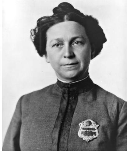
Figura 4 – Alice Stebbins Wells. 1910.

Com o sucesso da polícia norte-americana, foi possível observar um aumento das mulheres-polícia no país, onde, de acordo com Adelaide Cabete, em 1926, mais de 150 cidades eram vigiadas por uma polícia com mulheres. A imagem da mulher-polícia apresentada por Adelaide Cabete não era a de uma agente de segurança ou manutenção de ordem pública, pelo que, para desmistificar as suas intenções com a tese da existência de uma polícia feminina, clarificou que as funções ideais de uma mulher-polícia, pela sua sensibilidade feminina, seriam a de vigiar, assistir e proteger crianças e mulheres em qualquer circunstância, defendendo que não deveria estar armada nem efetuar patrulhas, mas apenas vigiar jardins públicos, cais, estações de caminho de ferro, hotéis, cafés cantantes, salas de baile, teatros, animatógrafos e locais de reunião social (Urbano, 2020). Ou seja, a razão pela qual deveria existir uma polícia feminina seria, segundo Adelaide Cabete, a função fundamentalmente educativa, preventiva e de educação moral, distinguindo-se claramente da polícia masculina.