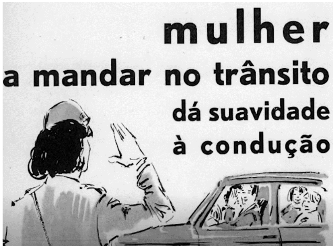
Figura 7 – Imagem da revista Polícia Portuguesa de 1972.