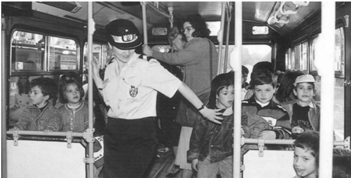
Figura 5 – Mulher-polícia em 1980 a exercer funções de vigilância de crianças em transportes públicos coletivos.

Oficialmente, o recrutamento de guardas femininas só foi permitido em 1945 com o decreto-lei n.º 34882, de 4 de setembro, o qual aprovava o quadro único do pessoal do Comando Geral da PSP, mediante despacho do Ministério do Interior, onde as mulheres tinham o posto de guardas de 2.ª classe, com funções de serviço especial de vigilância de mulheres e crianças, assim como outros serviços assistenciais, que, indiretamente, não lhes dava a possibilidade de progressão na carreira.