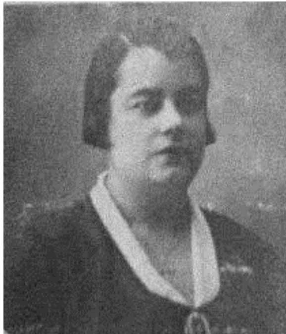
Figura 2 – Emília Conceição Pereira . A Primeira mulher-polícia portuguesa.

Conceição Pereira 7 (Urbano, 2020) para desempenharem funções restritas de vigilância de mulheres e crianças, serviços assistenciais, revista de cidadãs suspeitas e apoio na gestão operacional (PSP, 2018), trajando à civil (Borges, 2008; Pinheiro, 2013). Este passo foi pioneiro a nível nacional, porém, ainda com muitas restrições que se prolongaram pelo Estado Novo (Urbano, 2020).