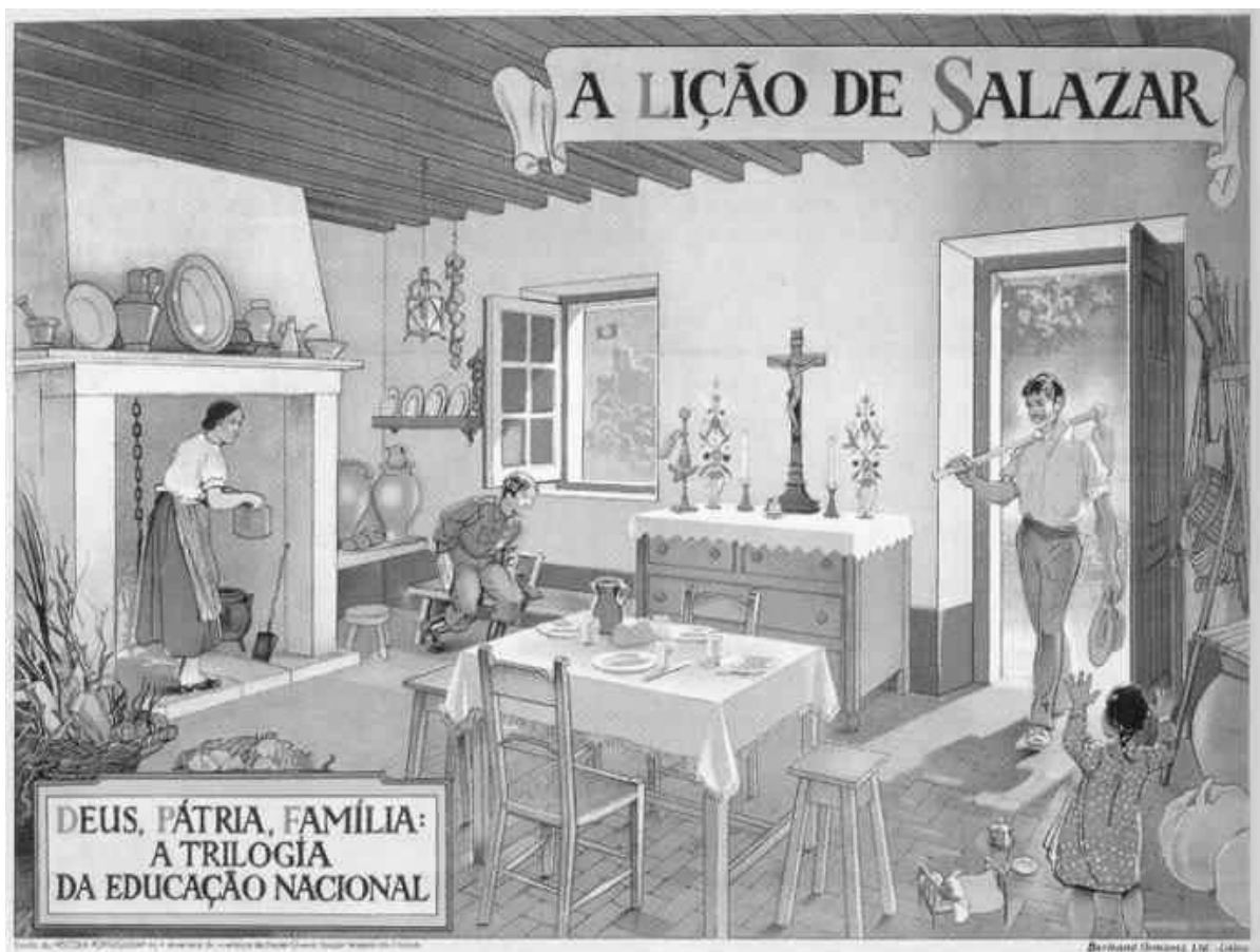
Figura 1 – A Lição de Salazar.