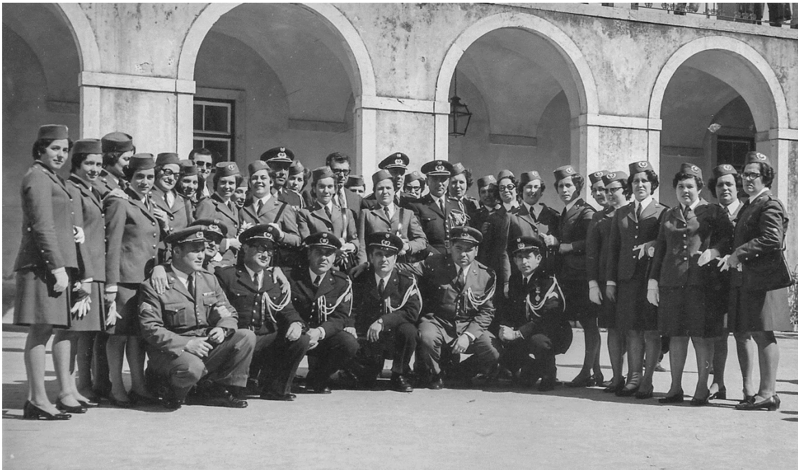
Figura 6 – Primeiro Curso de mulheres em 1972.

portuguesa, mais de 21 anos de idade e menos de 35 anos à data do alistamento, possuísem a habilitação mínima do exame do 2.º grau de instrução primária, tivessem uma altura mínima de 1,55m, estivessem isentas de culpa de Registo Criminal e um comportamento moral e civil irrepreensível, tendo de prestar provas práticas em igualdade com os homens (Borges, 2008). Este recrutamento de mulheres na PSP prendeu-se com uma necessidade de preencher postos com tarefas específicas numa instituição e profissão tradicionalmente masculina (Pinheiro, 2013), ocupando serviços mais administrativos, os quais, à partida, não seriam executados por homens (Durão, 2017), libertando os colegas do sexo masculino para funções policiais. Era necessário colmatar algumas carências ao nível de meios humanos, resultantes da partida de homens para o Ultramar (Durão, 2017).