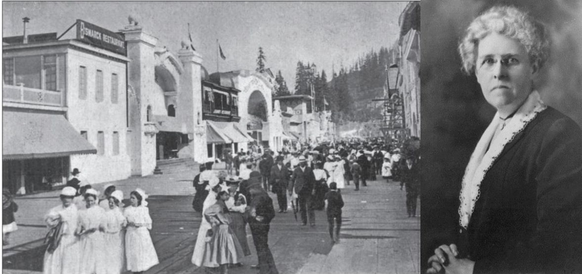
Figura 3 – Exposição Comemorativa do Centenário da Expedição Lewis & Clark em 1905 (Esq); Lola Baldwin, considerada a primeira mulher polícia americana (dir).

Estas tinham a função de vigiar a Feira, proteger e impedir a exploração sexual de mulheres, oferecendo habitação e um emprego para afastar mulheres jovens da prostituição e da prática de crimes (Prince & Schaffer. 2017).