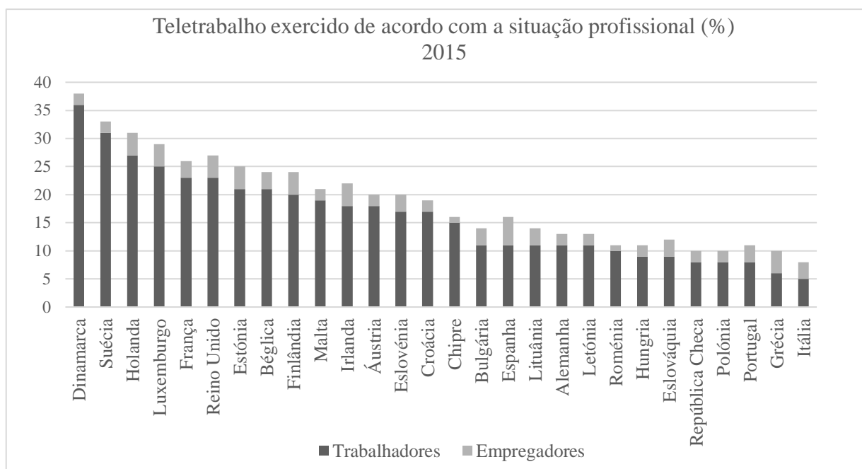
Gráfico 2 - Teletrabalho exercido de acordo com a situação profissional (Trabalhadores e Empregadores) na UE e no Reino Unido (%), 2015

Elaboração própria; Fonte: European Working Conditions Survey, Eurofound