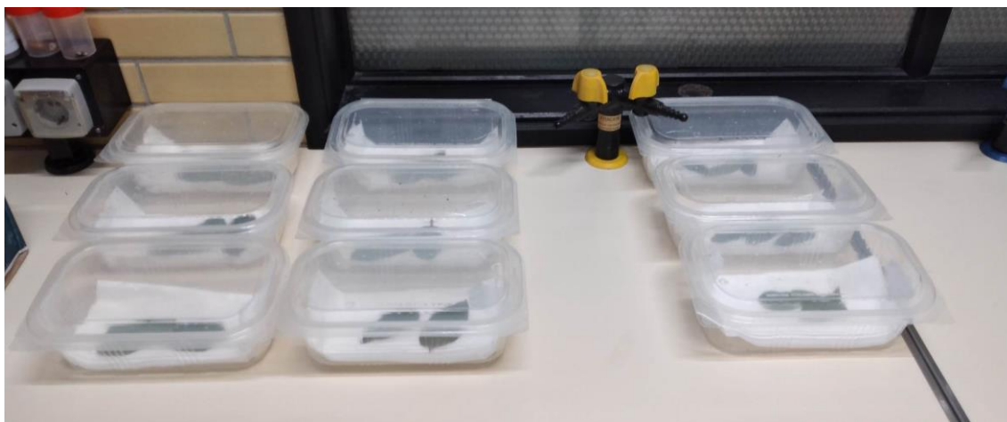
Imagem 4 - Ensaio com caixas de plástico com larvas de Trachymela sloanei e as folhas frescas de cada um dos clones usados.

avaliar a sua taxa de sobrevivência até ao momento em que morreram as 15 larvas, que estavam a ser alimentadas pelo mesmo clone, altura em que se dava como terminado o ensaio e se iniciava um novo, conduzido em iguais circunstâncias.