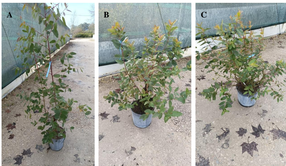
Imagem 3 - Clones híbridos usados nos ensaios: A – MEI; B – BARÃO; C – H551.01

Consistem em plantas com função de pés-mãe, usadas para recolha de raminhos com os quais se fazem estacas para enraizamento e obtenção de outras novas plantas, cópias do pé-mãe inicial (propagação vegetativa). São, portanto, clones e neste caso clones híbridos com a seguinte constituição genética (Tabela 1):