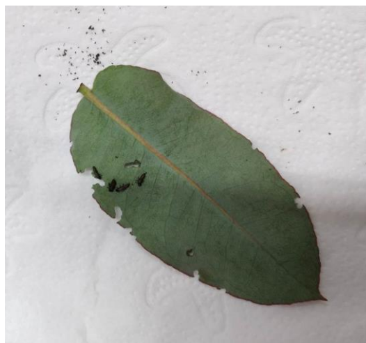
Imagem 2 - Danos causados por Trachymela sloanei , no híbrido Eucalyptus urophylla x Eucalyptus maiden (BARÃO) - cortes irregulares nas bordas da folha.

Este insecto desfolhador pode remover a maior parte da superfície de uma folha, deixando apenas a veia central, podendo ocasionalmente alimentar-se de um rebento (MILLAR, et al. , 2009).