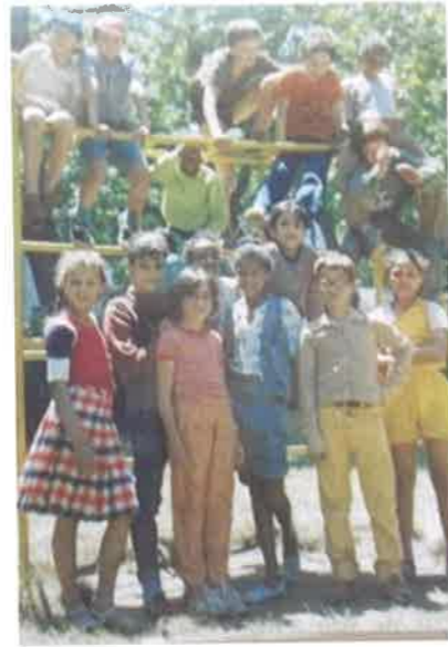
Fig. 5 | Grupo de crianças do Centro experimental de Ação Educativa da CEFEP