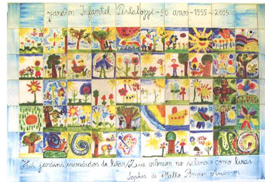
Fig. 1 | Jardim Infantil Pestalozzi – 50 anos-1955-2005 [azulejo]