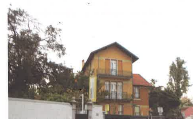
Fig. 3 | Edifício do Jardim Infantil Pestalozzi