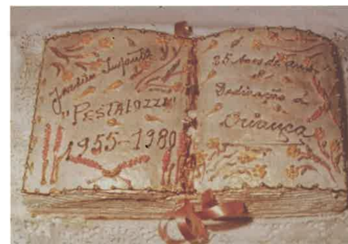
Fig. 8 | Jardim Infantil Pestalozzi – 1955-1980. 25 Anos de amor e dedicação à criança