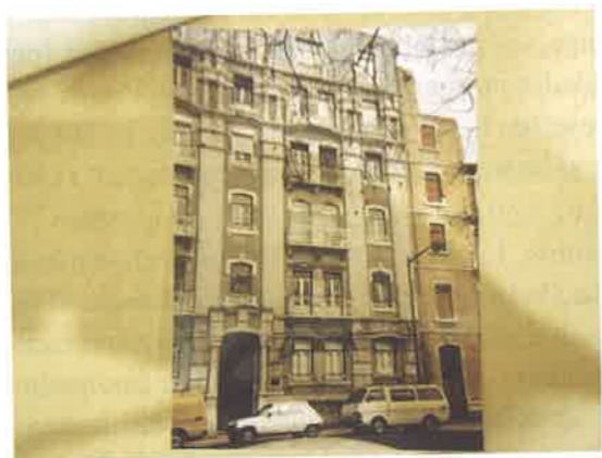
Fig. 4 | Sede da cooperativa CEFEPÉ