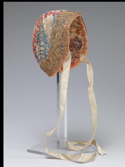
Dåpslue de seda e linho com fitas de seda, 1700.

https://www.nasjonal museet.no/en/collection/object/OK-08584