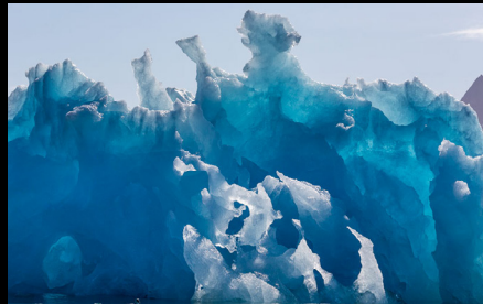
Glaciar Monacobreen, Spitsbergen, Svalbard, Noruega.

https://www.swisseduc.ch/glaciers/svalbard/monacobreen/index-en.html