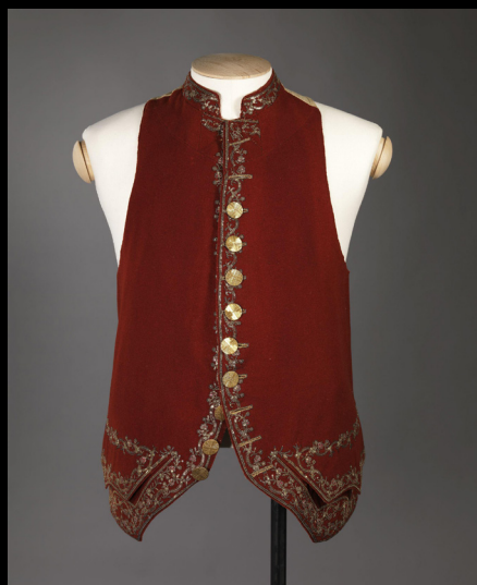
Casaco de lã bordado com fio metálico, 1770-1790.

https://www.nasjonal museet.no/en/collection/object/OK-dep-00145