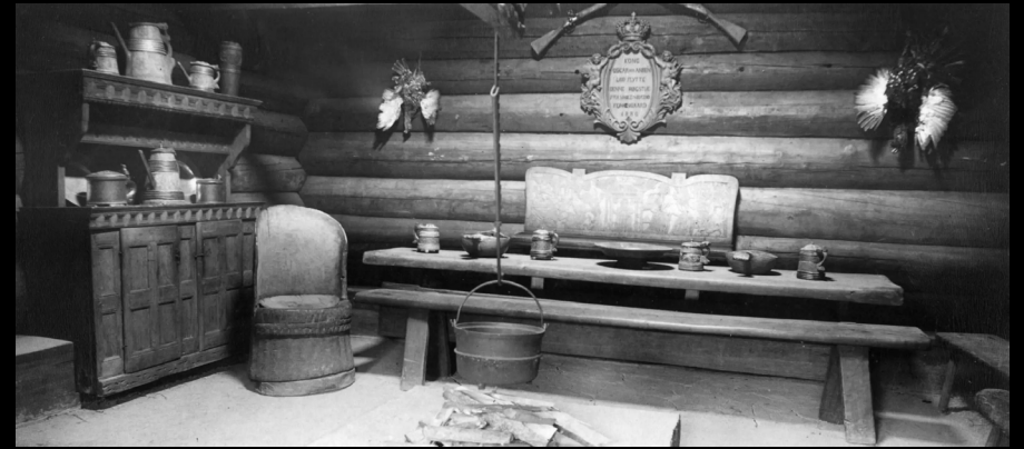
Casa de fazenda, Kjelleberg, Valle, Norway 1650-1700. https://norskfolkemuseum.no/en/kjelleberg .