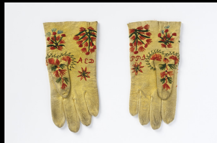
Luvas de pele de carneiro bordadas à mão com fio de seda e lantejoulas, 1800-1880. https://www.nasjonalmuseet.no/en/collection/object/OK-01482