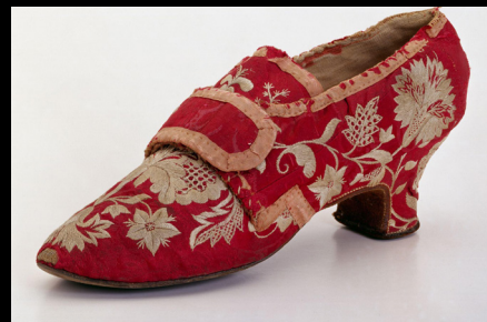
Sapato de seda e linho costurado à mão, 1770. https://www.nasjonalmuseet.no/en/collection/object/OK-04268