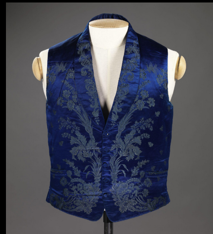
Colete de seda tecido de máquina, 1840 -1860.

https://www.nasjonal museet.no/en/collection/object/OK-03677