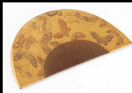
Pente de madeira com baixo-relevo de meados de séc. 18. https://www.nasjonalmuseet.no/en/collection/object/OK-05298