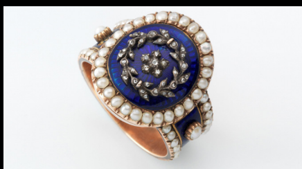
Anel de ouro com esmalte espelhado, pérolas e diamantes facetados. https://www.nasjonalmuseet.no/en/collection/object/OK-07960