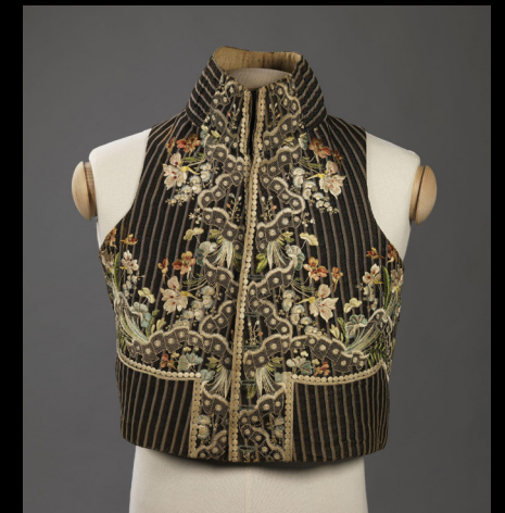
Colete de seda e linho bordado, 1760-1780.

https://www.nasjonal museet.no/en/collection/object/OK-11625