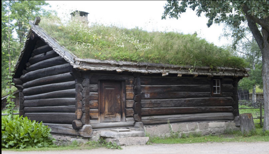
Casa de fazenda, Hallingdal, Norway 1750. https://norskfolkemuseum.no/en/hallingdal .