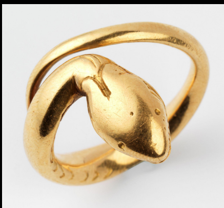
Anel de ouro forjado e gravado, 1830. https://www.nasjonalmuseet.no/en/collection/object/OK-1978-0400