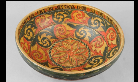
Recipientes para beber noruegueses, https://talknorway.no/kjenge-wooden-drinking-bowl-norway/ https://talknorway.no/rosemaling-a-journey-through-rose-painting-history-norway/