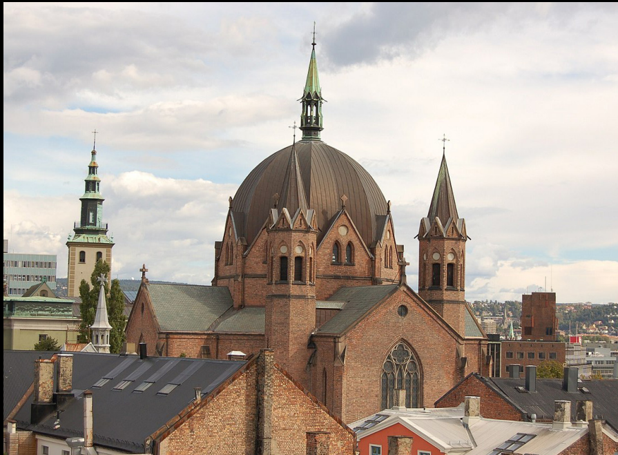
Trefoldighetskirken , Oslo.

https://www.lifeinnorway.net/akershus-fortress-oslo/