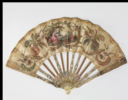
Leque de marfim esculpido com madrepérola, tecido de seda pintado com lantejolas, 1770. https://www.nasjonalmuseet.no/en/collection/object/OK-15361