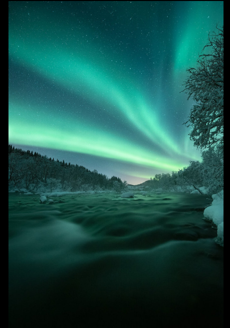
Aurora, Noruega.