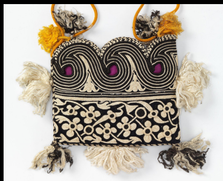
Bolsa em lã com cordões de algodão, 1880. https://www.nasjonalmuseet.no/en/collection/object/OK-08248