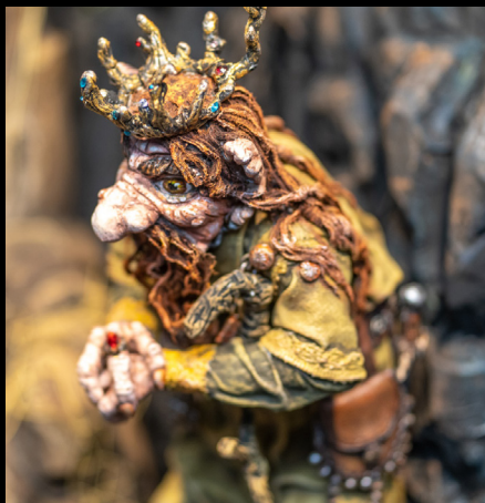
Escultura de "Rei Troll". https://trollmuseum.no/museum/fairy-tales/