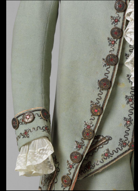
Conjunto costurado à mão em lã e seda, 1783.

https://www.nasjonal museet.no/en/collection/object/OK-03675