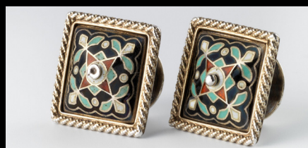
Brincos de prata, 1845-1855. https://www.nasjonalmuseet.no/en/collection/object/OK-10211