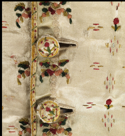
Colete de seda, linho e cetim, tecido entre 1770 e 1790.

https://www.nasjonal museet.no/en/collection/object/OK-03677