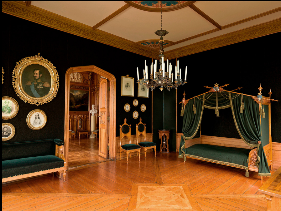
Interior de Oscarshall Palace. https://www.kongehuset.no/nyhet.html?tid=211465&sek=26939