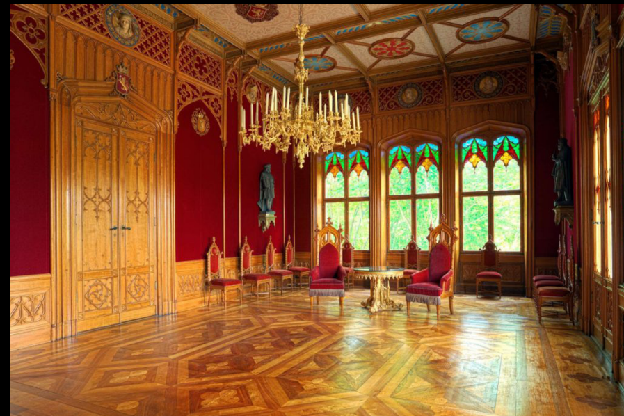
Interior de Oscarshall Palace. https://www.royalcourt.no/artikkel.html?tid=80431