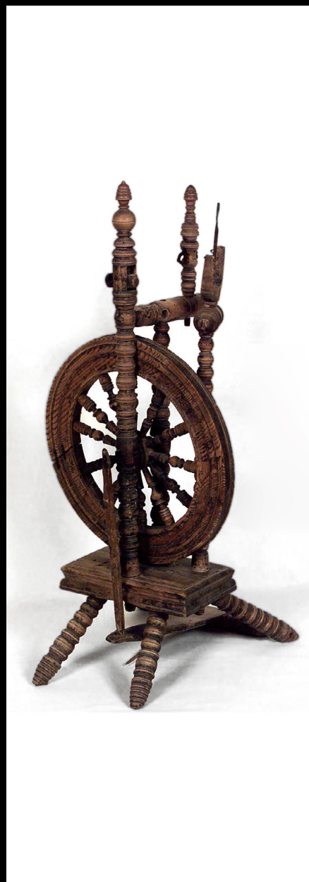
Roda de fiar norueguesa.

https://www.nasjonalmuseet.no/en/collection/object/OK-06353