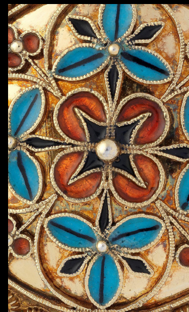
Broches a prata folheada a ouro com decorações a filigrana, 1883. https://www.nasjonalmuseet.no/en/collection/object/OK-02035 https://www.nasjonalmuseet.no/en/collection/object/OK-02037