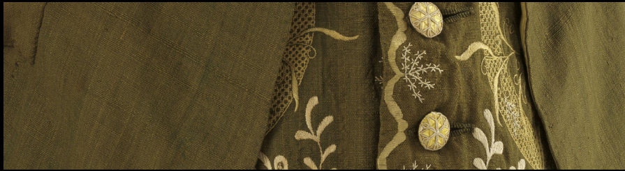
Conjunto costurado à mão em lã e seda, 1763.

https://www.nasjonal museet.no/en/collection/object/OK-02811