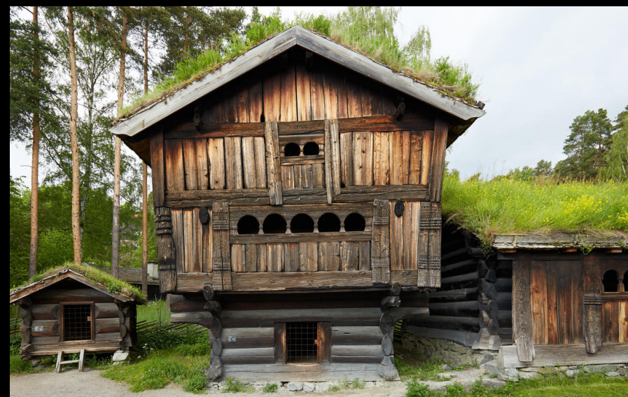
Armazém, 1650-1700, Bygland, Agder, Noruega. https://norskfolkemuseum.no/en/setesdal-1739 .