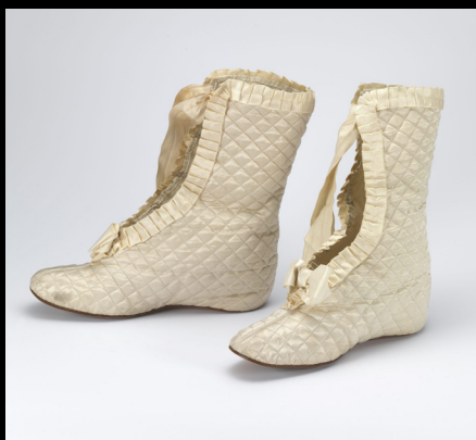
Sapatos de cetim e seda acolchoados e forrados com sarja, 1860-1880. https://www.nasjonalmuseet.no/en/collection/object/OK-1972-0059