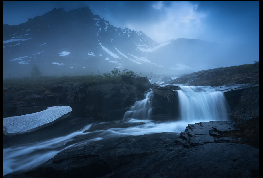
Cascatas na Noruega.

https://www.carlltloveall.com/Galleries/Landscape/