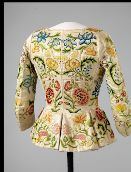
Casaco de seda bordado à mão com fio de seda e lã, 1730-1760.

https://www.nasjonal museet.no/en/collection/object/OK-06197