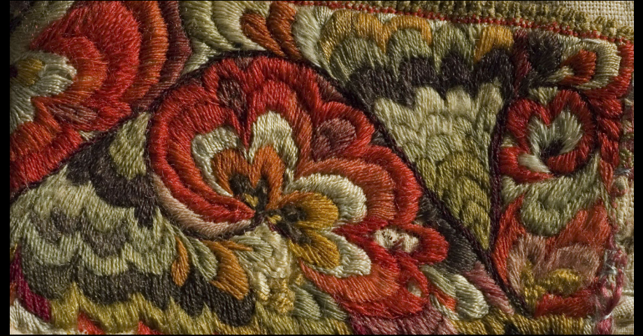
Detalhe de camisa em lã com pontos de fios de seda.

https://www.nasjonalmuseet.no/en/collection/object/OK-05776