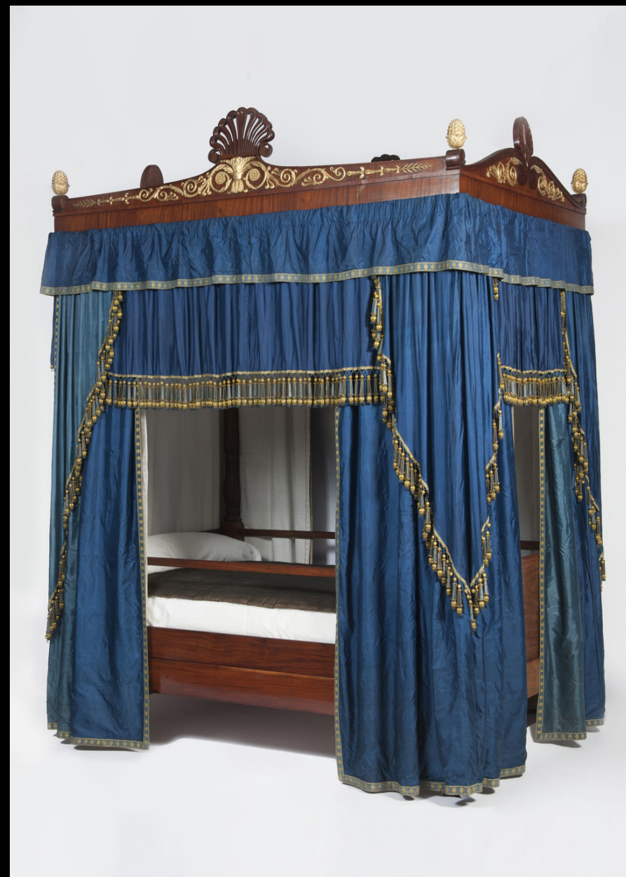
CAMA EM MADEIRA, 1814.

https://digitaltmuseum.no/011023131985/rokk