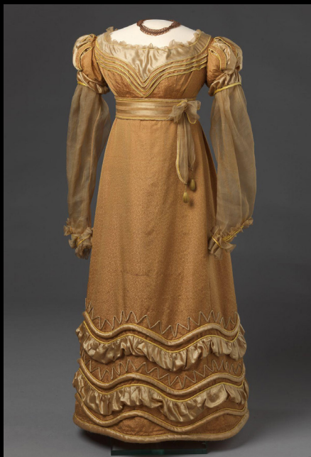
Vestido de seda, com decoração aplicada e ganchos de metal, 1825.

https://www.nasjonal museet.no/en/collection/object/OK-12061