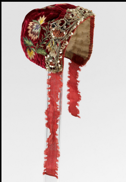
Dåpslue de veludo com pérolas e fitas de seda, 1700.

https://www.nasjonalmuseet.no/en/collection/object/OK-1966-0074