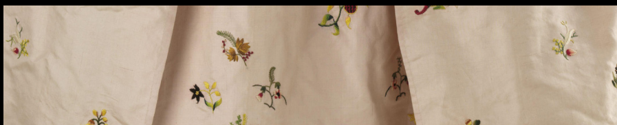
Vestido costurado à mão de linho com bordados de fios de seda, década de 1880. https://digitalmuseum.no/011023132911/seng