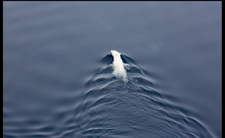
Ursos polares em Svalbard, Noruega.

https://global.hurtigruten.com/destinations/svalbard/inspiration/wildlife/polar-bear/