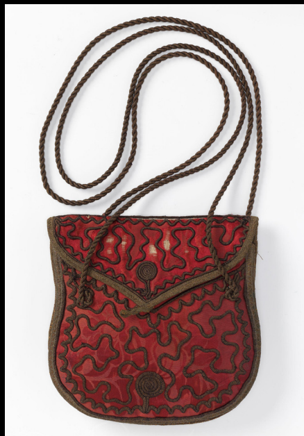
Bolsa de seda, 1880.

https://www.nasjonalmuseet.no/en/collection/object/OK-11737