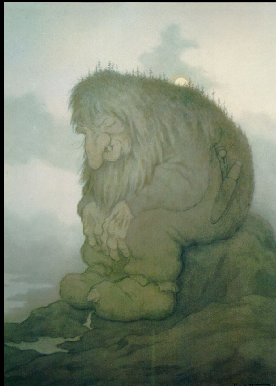
Troll wonders how old he is , por Theodor Kittelsen, 1911. https://www.wikiart.org/pt/theodor-severin-kittelsen/troll-wonders-how-old-he-is-trollet-som-gruner-p-hvor-gammelt-det-er-1911-1W