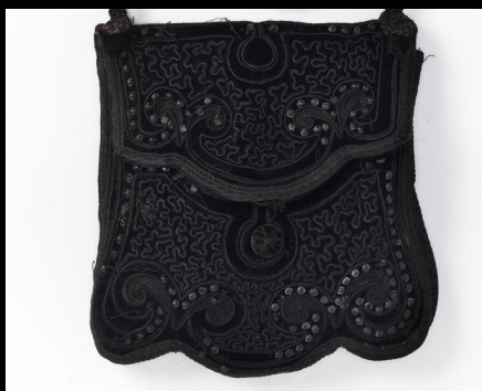
Bolsa de veludo bordado à mão, 1860-75.