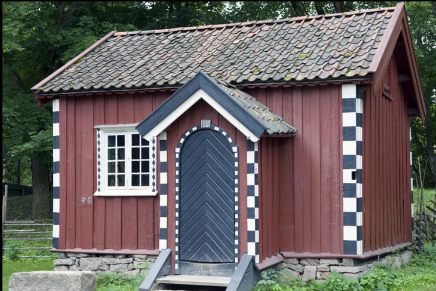
Casa de hóspedes, Akkerhaugen, Norway, 1800. https://norskfolkemuseum.no/en/telemark .