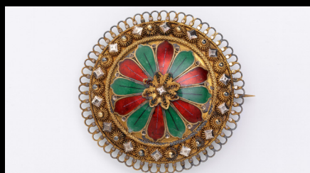
Broche a prata dourada, esmalte e com decorações a filigrana, 1883.