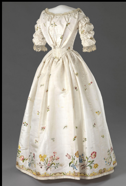
Vestido de seda com renda, e corpete de algodão com barbatanas de baleia 1840.

https://www.nasjonal museet.no/en/collection/object/OK-12061