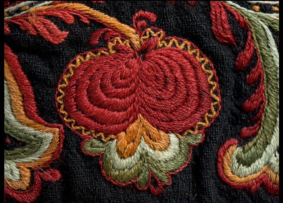
Detalhe de avental em lã com bordados a linho.