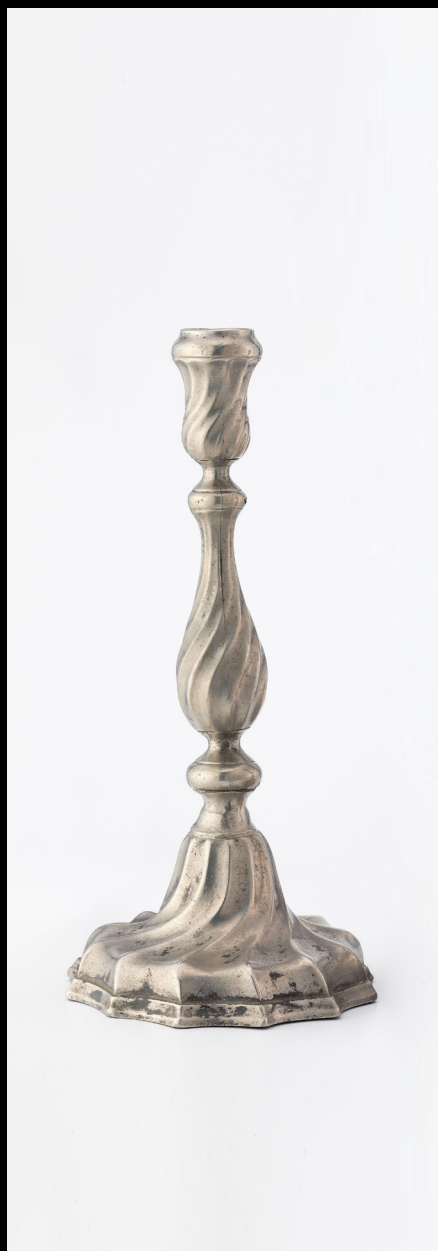
Porta velas século 18.

https://www.nasjonalmuseet.no/en/collection/object/OK-06353