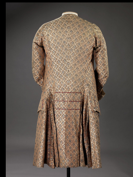
Casaco e colete de seda. 1760-1780.

https://www.nasjonal museet.no/en/collection/object/OK-11663