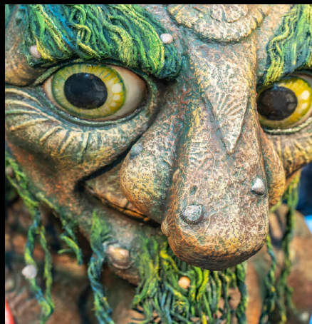
Escultura Troll. https://seatroll.no/trollmuseum