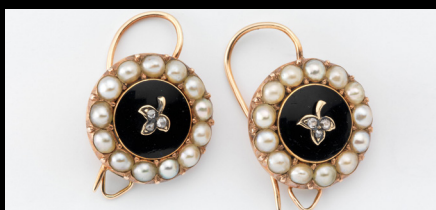
Brincos de ouro fundido com esmalte, pérolas e diamantes embutidos, 1750. https://www.nasjonalmuseet.no/en/collection/object/OK-06868