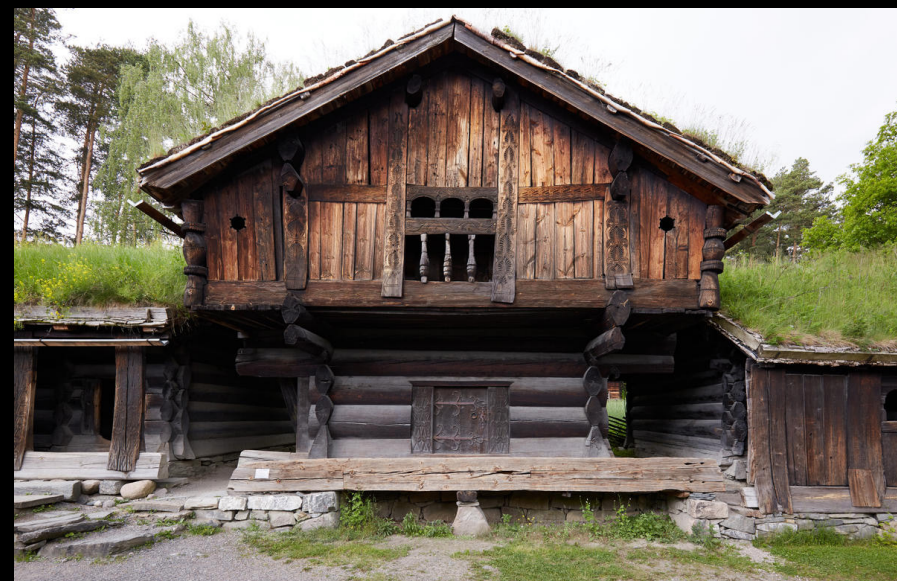
Armazém, 1700, Bygland, Agder, Noruega. https://norskfolkemuseum.no/en/storehouse-from-ose