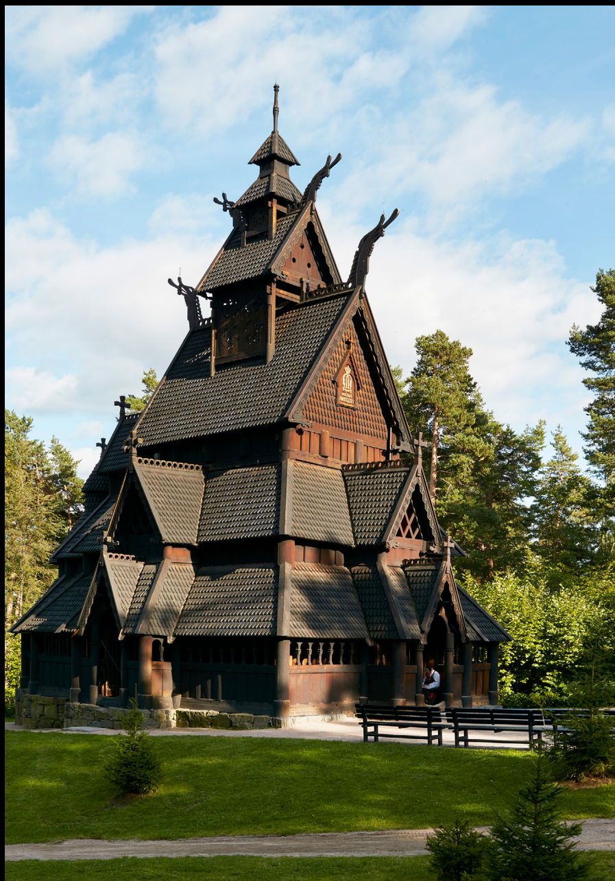
Igreja Stave, de aproximadamente 1200. https://norskfolkemuseum.no/en/king-oscar-iis-collection .