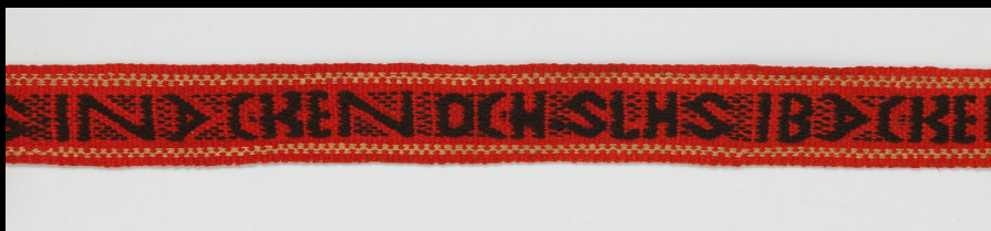
Banda de lã e algodão tecida à mão, 1857.

https://www.nasjonalmuseet.no/en/collection/object/OK-1966-0074