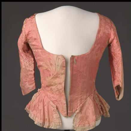
Parte de vestido de seda costurado à mão, 1780.

https://www.nasjonal museet.no/en/collection/object/OK-15892