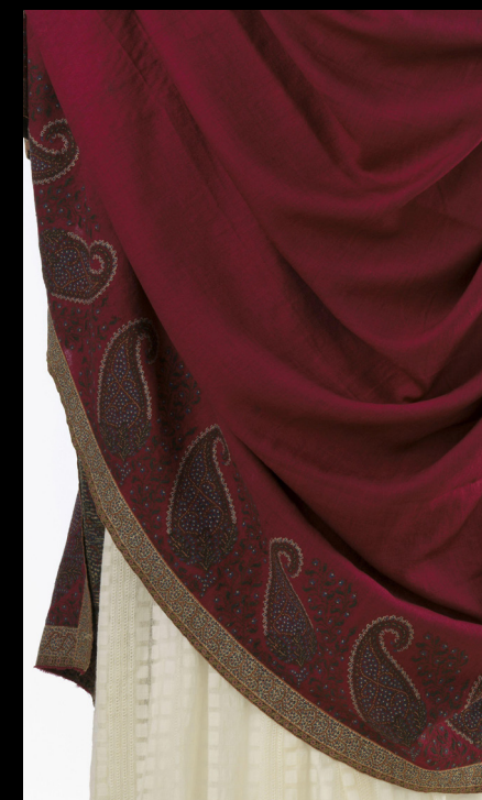
Conjunto de linho e algodão , entre 1795 -1805.

https://www.nasjonalmuseet.no/en/collection/object/NMK.2004.0201