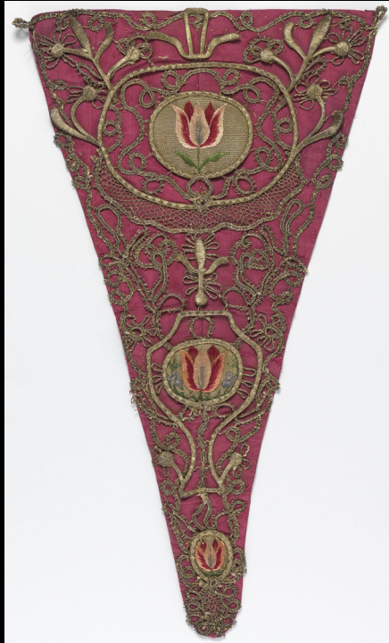
Pano de peito de seda com bordados a seda e metal, 1700.

https://www.nasjonalmuseet.no/en/collection/object/OK-07262