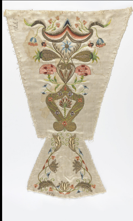
Pano de peito de cetim com bordados a seda e fio de metal.

https://www.nasjonalmuseet.no/en/collection/object/OK-07262