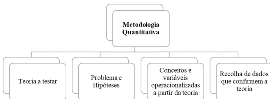
Figura 1 - Estrutura da metodologia quantitativa

No que concerne à estratégia utilizada, a investigação pode ser qualitativa, quantitativa ou mista (Rosado, 2017), na medida que estes paradigmas científicos vão fornecer as “premissas, postulados, métodos e procedimentos para as investigações” (Camayd & Freire, 2020, p.6). Neste caso, o presente trabalho contém uma abordagem quantitativa, ou seja, procura explicar, através da objetividade e quantificação de medidas, determinados factos que geram resultados que possuem uma elevada precisão e poucas chances de deturpações (Dalfovo et al, 2008). Segundo Coutinho (2014b), uma investigação quantitativa deve ser estruturada seguindo um determinado encadeamento lógico (Figura 1).