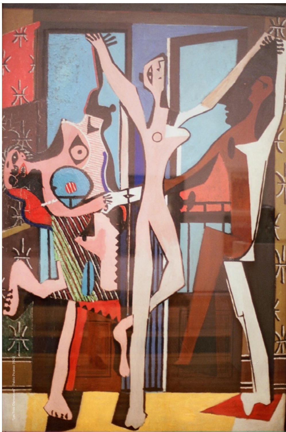
«Les Trois Danseuses» - Pablo Picasso (1925)

A primeira dança é bastante enérgica e lembra em alguns momentos a música do bailado Romeu e Julieta de Prokofiev. Contém também reminiscências de um projeto inacabado do próprio Rachmaninov, o bailado Os Citas , ainda do período em que vivia na Rússia. Já a segunda dança tem como subtítulo «Tempo di valse», muito embora se perceba desde início – pelos acordes contundentes e pelos motivos melódicos serpeantes – que não corresponde à frivolidade dos salões oitocentistas. Por fim, a última dança afasta-se da melancolia e de alguma tristeza para anunciar uma transfiguração anímica, porventura espiritual. É curioso assinalar que a dada altura se distingue claramente a melodia de «Dies irae», o famoso hino que integra a liturgia católica dedicada aos mortos, o Requiem . No manuscrito autógrafo, o compositor escreveu por cima a palavra «Aleluia», porventura clamando redenção.