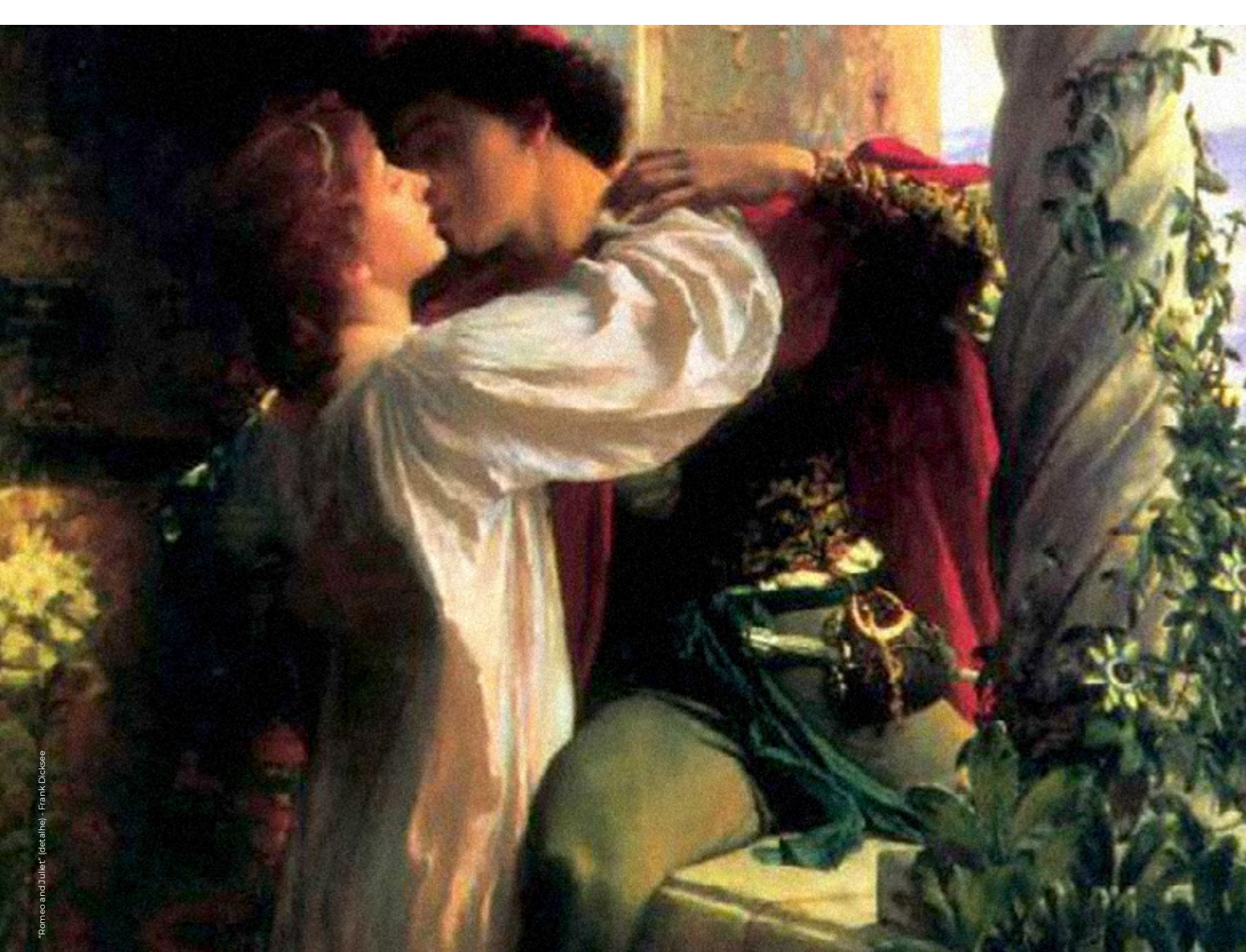
"Romeo and Juliet" (detail) - Frank Dielise