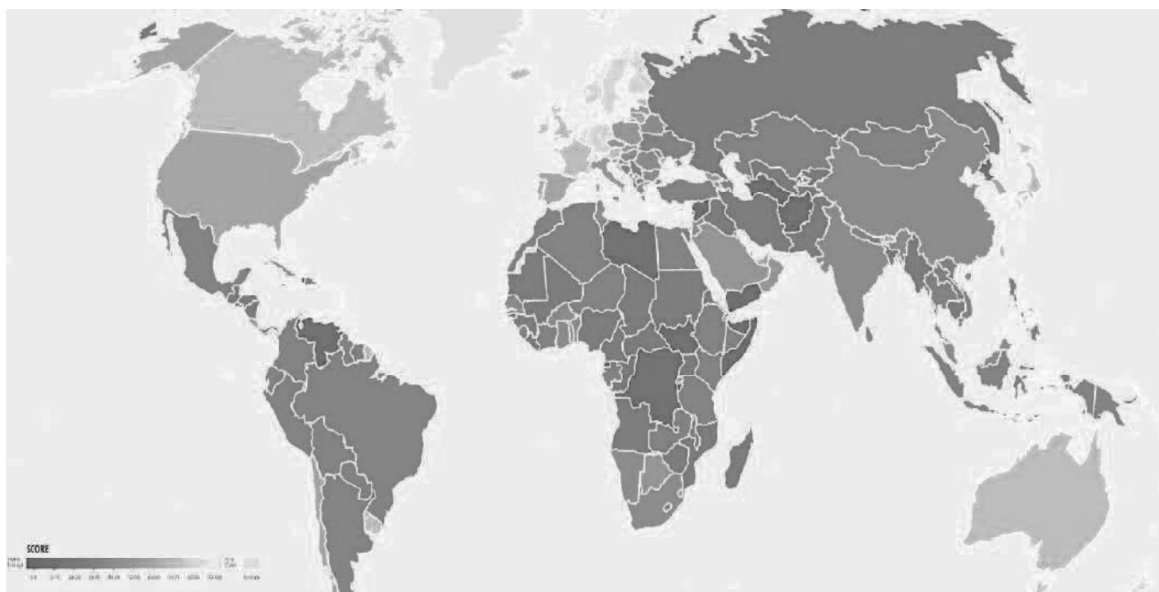
Figura 2: Corruption Perception Index (CPI) / Transparency International