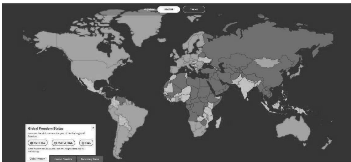
Figura 1: Global Freedom Status / Freedom House