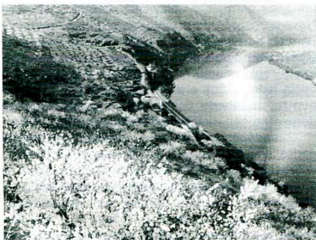
Panorâmica actual do Rio Douro e afluência do Côa

Quem procurar neste trabalho um artigo habitual da Còavisão, ou seja com temática sobre arqueologia ou de aprofundamento histórico, entrecruzada com esquemas, fotografias, tabelas, desenhos, plantas, etc. que suportam os conteúdos com alto rigor científico e cultural, deverá parar por aqui, pois vai encontrar uma outra temática virada para a cultura popular, com traços etnográficos e de âmbito regional e local, cujos destinatários maiores são diferentes dos habituais.