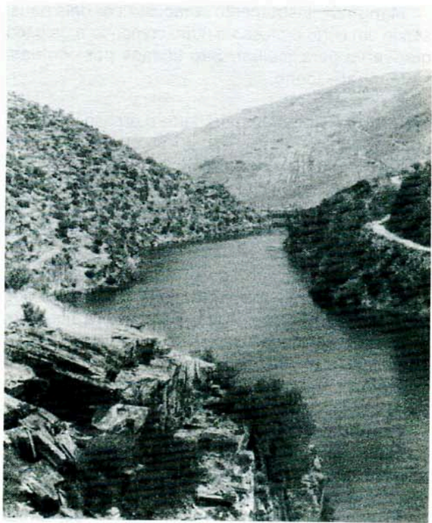
Vista actual do Rio Côa.

Mó Centeia – Mó mais macia que trabalha com a alveira.