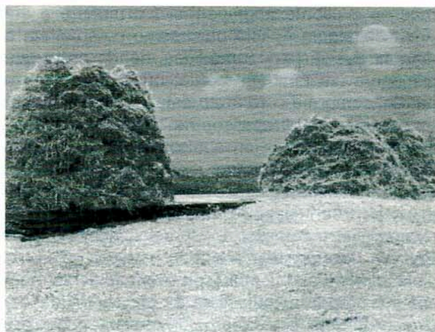
O rolheiro ou borneiro.

Rolheiro ou borneiro – Monte de molhos na eira ou no campo.