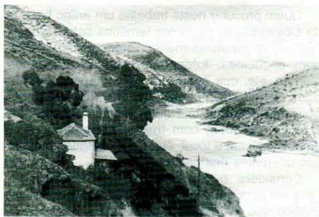
Azenhas no Rio Douro em ambas as margens.

Quando os moinhos se encontravam empolgados (impossibilitados de obrar com as cheias), utilizava-se o picardel, tipo de moinho rudimentar e que não cabe aqui descrever. O canado do Vale dos Moinhos continha tantos como 9 picardéis, o Vale de José Esteves 2, o Rolento 2, o Vale dos Olmos 2 e tantos mais. Nem todos trabalhavam ao mesmo tempo, pois a água acabava-se mais cedo nuns canados que noutros.