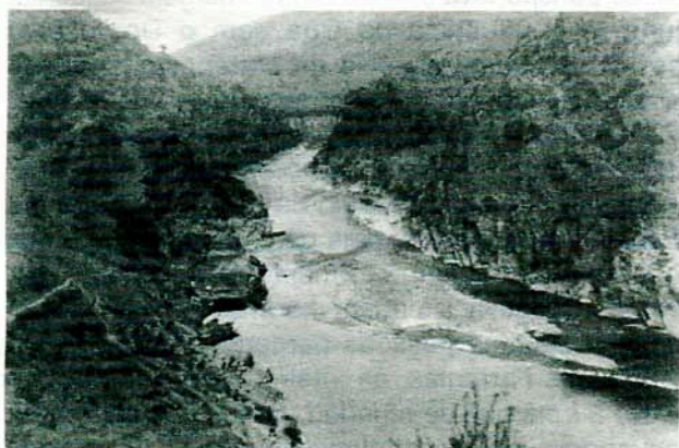
Moinhos no Rio Côa com o respectivo açude.

Os moinhos, esses, existiam no Côa e em vez de serem movidos com a roda vertical, a sua força motriz era produzida pela água, através do rodízio. Também nas condições anteriores existiam 5 no Rego da Vide, 2 dos quais eram os Moinhos das Águas Perdidas – água que sobrava do açude e era reaproveitada – sendo alguns do Peralta, do Cereal e do Moutinho. No fundo do Canado do Rego localizavam-se mais 3 – dos Tomés – na Broeira mais 4 – dois do Antão e 2 do Baraça –. Por último, logo a seguir à actual ponte rodoviária, mais 3 – dois da família Inteiro e um do Falaio.