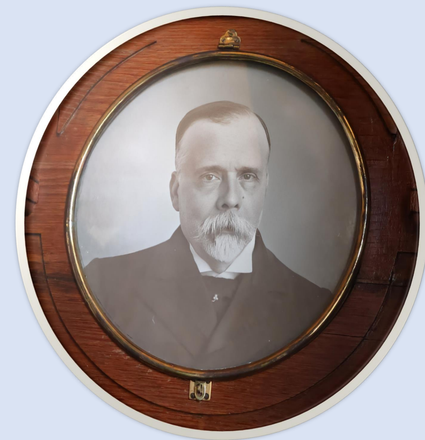
Foto da Sala da Conselho da Delegação do Sul do INMLCF