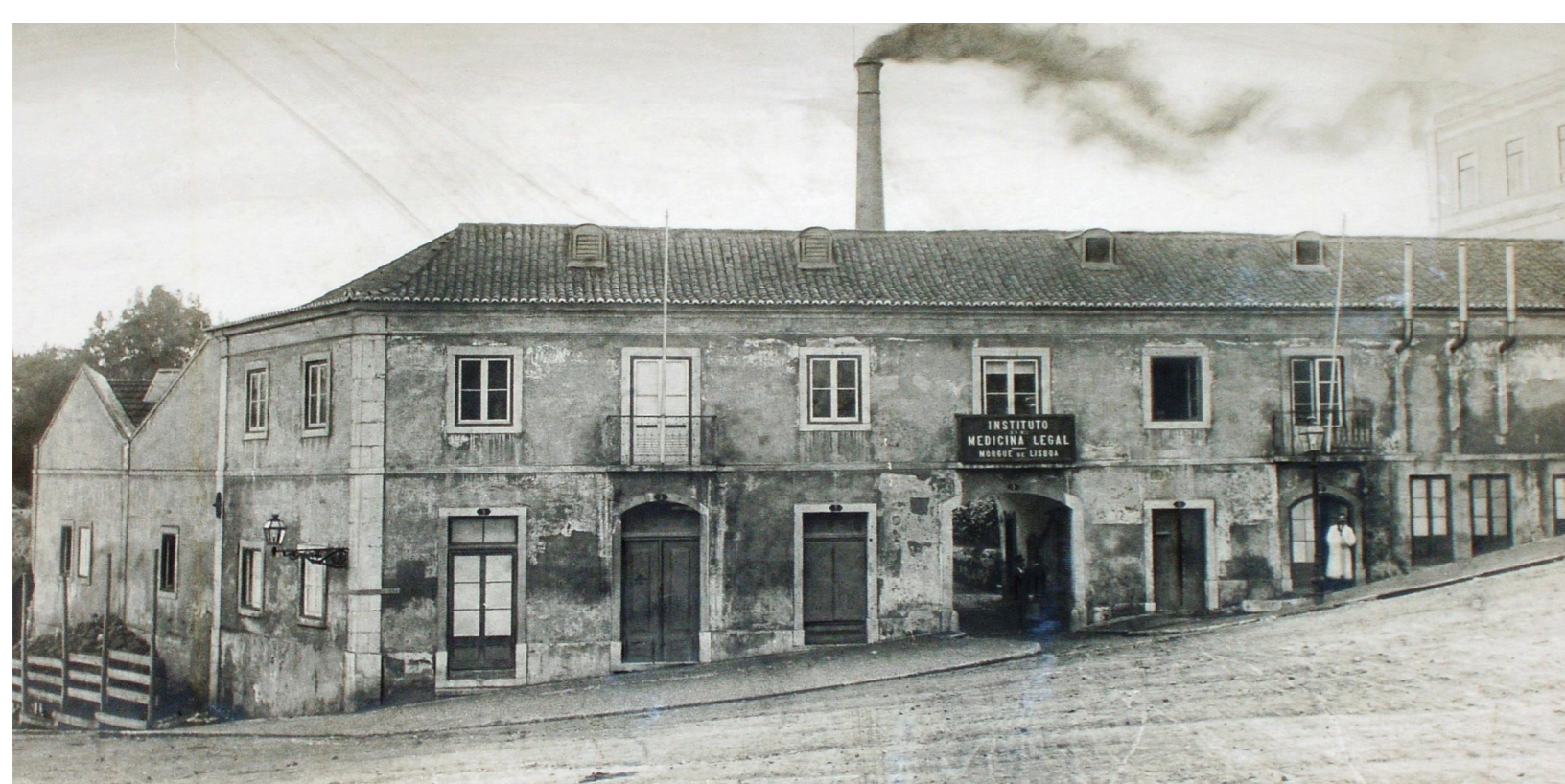
Edifício da Morgue de Lisboa Foto da Sala de Leitura da Delegação do Sul.

Dirigiu a Morgue de Lisboa até 1911 , com um quadro de pessoal limitado — um diretor, um secretário, um contínuo e alguns serventes — sem laboratórios próprios (11) , num período marcado pela instabilidade política e social, dos quais se destaca o Regicídio de 1908 e a Implantação da República, em 1910.