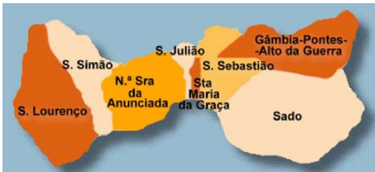
Figura 1: As freguesias do concelho de Setúbal