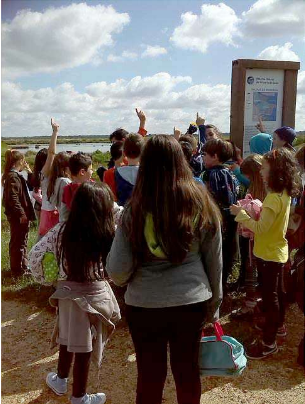
Imagem 2: Actividade com crianças no espaço envolvente do Moinho