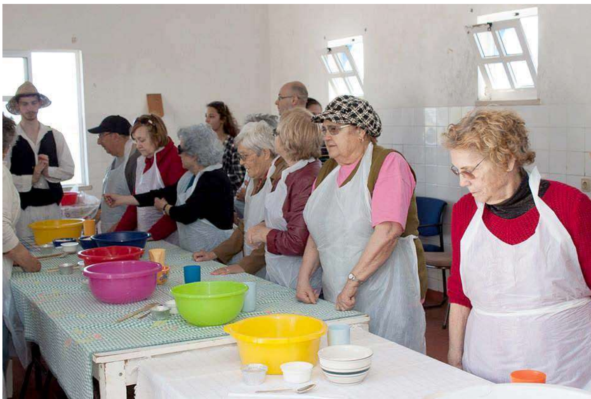
Imagem 3: Actividade com idosos na casa do pão, junto ao Moinho

Os momentos mais ricos do projecto aconteceram quase sempre com a população idosa, tanto num ano como no outro. São eles que ensinam os próprios animadores a fazer pão a partir da experiência de uma vida a fazê-lo (não com a receita que eles levavam) e participam em todo o processo, inclusivamente a sua cozedura no forno a lenha. Esse pão, ainda quente, constitui depois o lanche partilhado à volta da mesa onde as histórias de vida continuam a fluir, numa saudável mistura entre as informações que os animadores compilaram para facultar sobre o funcionamento do moinho e as vivências que eles têm de um tempo e/ou de um lugar pré industrialização.