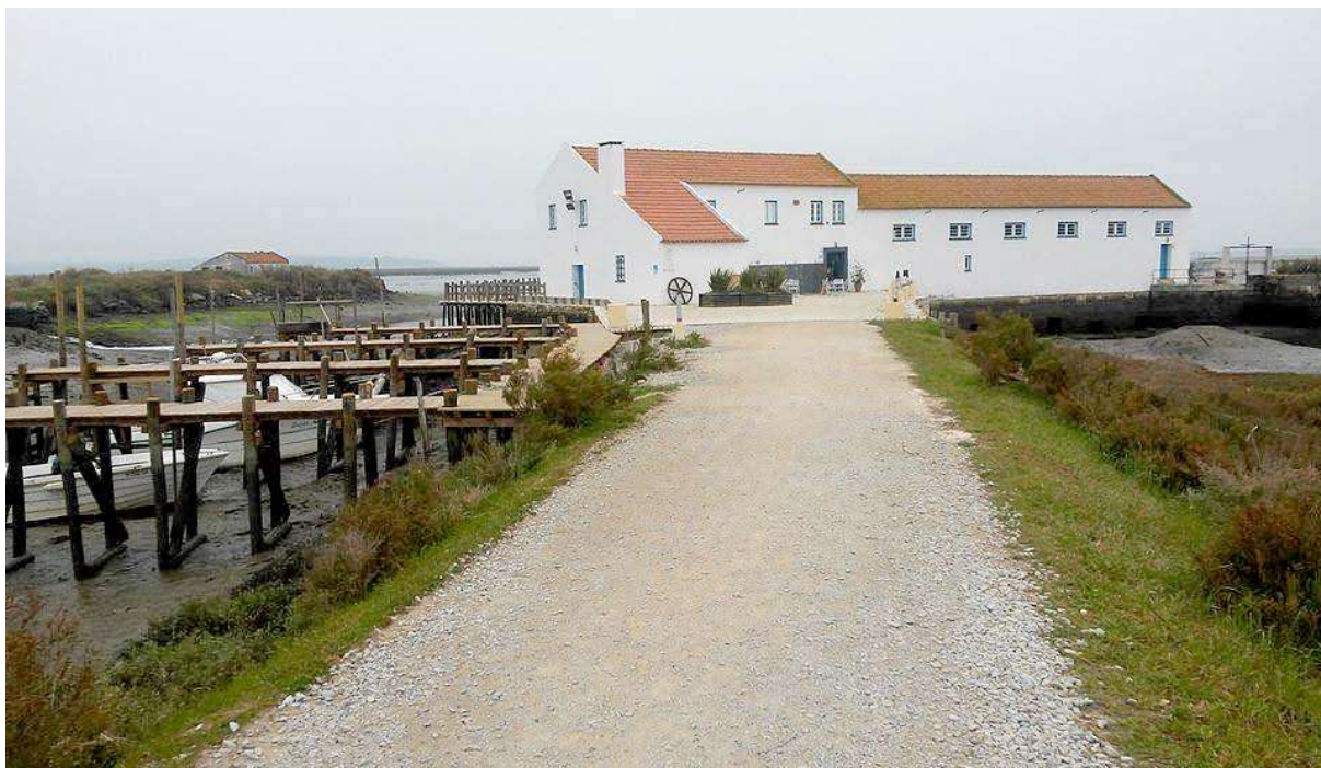
Imagem 1: Moinho de maré da Mourisca

aberto ao público e definiu a educação ambiental como uma missão, tendo desenvolvido um trabalho activo com as escolas da zona. Em 2010, o Moinho fechou portas e em 2011 foi novamente alvo de significativas obras de beneficiação, tendo em 2012 sido assinado um protocolo de co-gestão entre o ICNF e a Câmara Municipal de Setúbal, ficando estas duas entidades responsáveis pela dinamização no moinho de maré e a sua área envolvente.