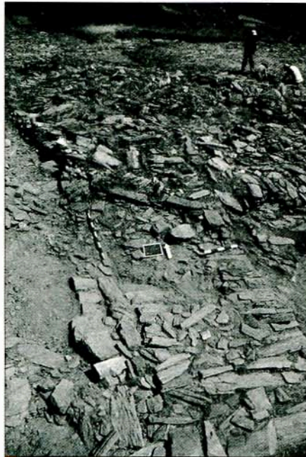
Fig. 4 – Vista geral sobre a “Torre Principal” e, em primeiro plano, o murete que arranca desta estrutura em direcção a Sul (possível continuação do Murete 3).

minada altura pode ter-se transformado numa estrutura maciça, ou seja, o seu espaço interior foi ocultado pela petrificação do que anteriormente seria um espaço passível de circulação.