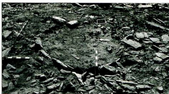
Fig. 5 – Estrutura Circular nº 27, localizada entre o Murete 2 e o Murete 3.

Finalizando, a descrição dos resultados provenientes das escavações em Castanheiro do Vento durante a cam