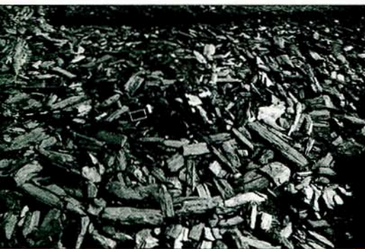
Fig. 1 - Aspecto geral do "Bastião" V.

A 2 de Julho de 2007 iniciou-se a 10ª campanha de trabalhos arqueológicos no topo da colina de Castanheiro do Vento (Horta de Douro, Vila Nova de Foz Côa), um sítio que genericamente se enquadra no IIIº-1º metade do IIº milénios a.C.