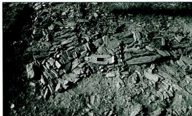
Fig. 2 - Pormenor da intersecção do murete que perfaz o "Bastião" W e o Murete 3.