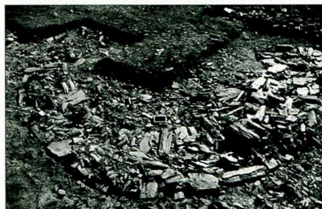
Fig. 3 - Aspecto geral do "Bastião" W.

"Bastião" W caracteriza-se pela existência de uma grande quantidade de argila entre as lajes basais, e aparentemente parece cortar o final do murete que perfaz o "Bastião" V, sem que seja claro o limite do arranque do "Bastião" W.